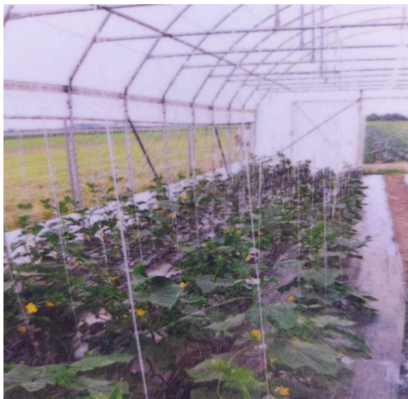
Slika 19. Krastavac u zaštićenom prostoru

Krastavci salatari se vežu jednom potpornom špagom po biljci, dok se na kornišone stavlja potporna mreža kako bi se ostvario uspravan rast te smanjila mogućnost pojave bolesti (Slika 19).