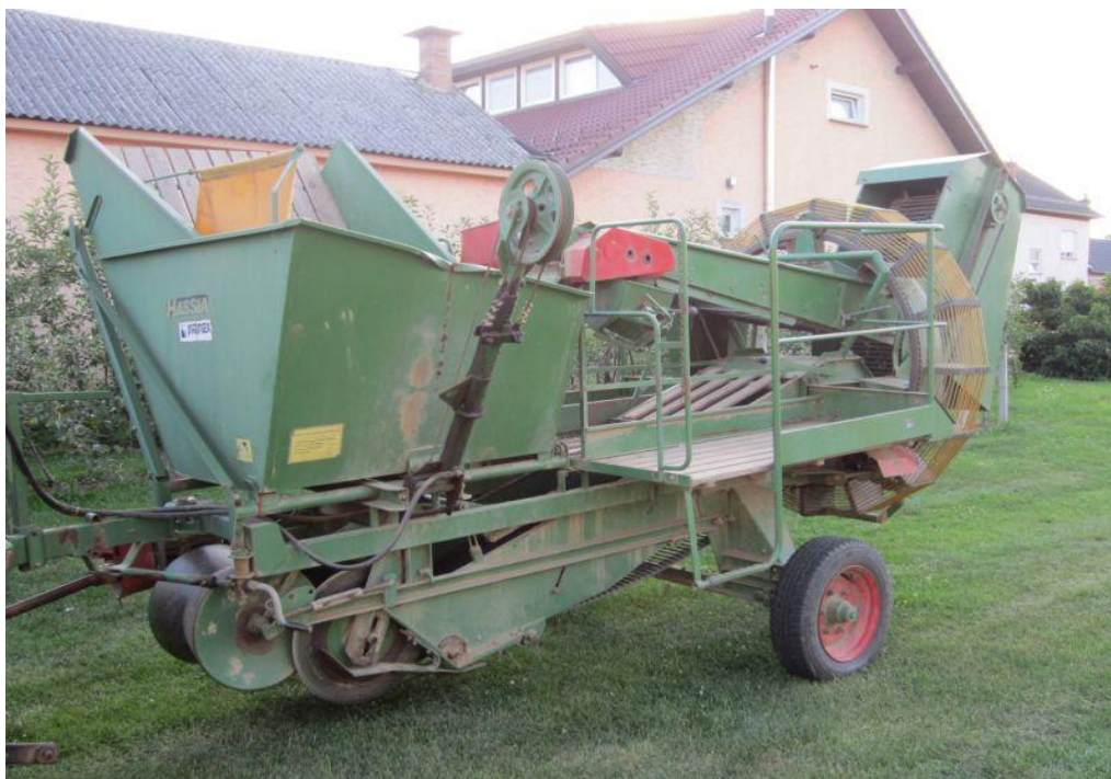
Slika 21. Kombajn za vađenje krumpira