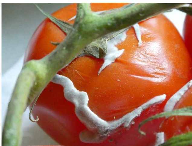
Slika 4. Šteta na plodu rajčice nakon infekcije Sclerotinia sclerotiorum

Sclerotinia sclerotiorum je uzročnik bijele truleži. Napada više od 400 domaćina kultiviranih i korovnih vrsta (Slika 4). Osnovni izvor zaraze predstavljaju sklerocije koje kasnije kliju u micelij ili apotecij sa askusima i askosporama. Klijanjem sklerocija u tlu nastaje micelij koji se prvo naseli na mrtvu organsku tvar, a zatim prodire u korijen i vrši zarazu. Ukoliko se radi o stabljičnom tipu bolesti zarazu obavljaju askospore, odnosno hife se iz prokljalih askospora šire na lisnu peteljku i stabljiku. Zaraza se može pojaviti i na neoštećenim dijelovima stabljike koju vrše askospore. Suzbija se na način da se treba poštivati plodored (4 – 6 godina), sjetva zdravog sadnog materijala, uništavanje korova i upotrebom kemijskim sredstava (Ivić, 2016; https://www.chromos-agro.hr/ ).