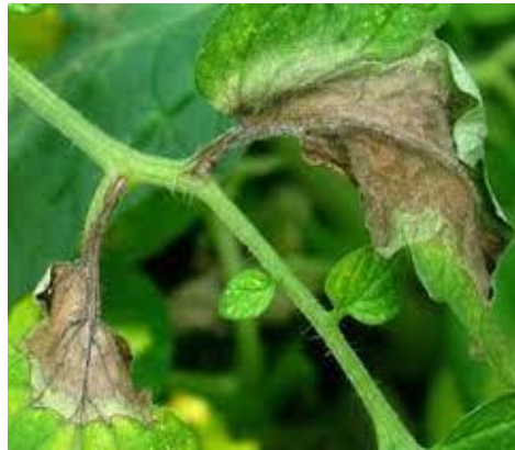
Slika 5. Botryotinia fuckeliana

Infekcija biljaka se odvija kroz prirodne otvore ili rane a za klijanje konidija odnosno njihovu infekciju potrebna je kap vode. Na razvoj gljive povoljno utječe visoka relativna vlaga zraka i temperature između 15 – 20 °C. Klijanje spora je potaknuto od različitih kemijskih tvari koje se nalaze u kapljicama vode kao što su šećeri, aminokiseline, organske kiseline, hormoni rasta i drugo. Suzbijanje gljive nije jednostavno jer preživljava kao saprofit i vrlo brzo napada biljne organe i za kratko vrijeme stvara obilje konidija. Konidije se prenose relativno lako sa zračnim strujama i vrše zarazu. Jako su važne fitosanitarne mjere za suzbijanje ove bolesti, poput kontrole okolišnim uvjeta (staklenici), agrotehničke mjere i primjena fungicida, daju jako dobre rezultate. Preporuka struke je uklanjanje zaraženih biljnih dijelova ili spaljivanje. Siva plijesan se na paprici javlja najčešće na plodovima kroz određene ozljede ili rane ( https://www.chromos-agro.hr/ ).