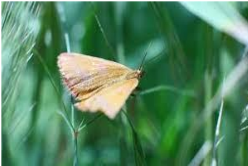
Slika 8. Kukuruzni moljac

Kukuruzni moljac zbog čestog uzgoja kukuruza kao monokulture može napraviti značajne štete jer vrlo često napada papriku i rajčicu (Slika 8). Gusjenice se nakon izlaska iz jaja ubušuju u plodove i najčešće se hrane i ubušuju u sjemenu ložu. Ponekad je teško primijetiti napad štetnika jer rupe koji buši ponekad znaju biti uz peteljku ploda. Suzbijanje je potrebno provesti prvo na izvorima pojave štetnike kao što su stara kukuružišta i biljni ostaci te biljke domaćina na kojim se nalazi. Dozvoljene aktivne tvari za suzbijanje moljca su lufenuron i metaflumizon ( http://www.agroklub.com ).