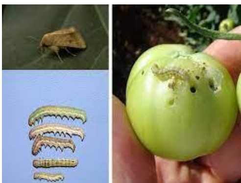
Slika 10. Žuta kukuruzna soвица

Žuta kukuruzna soвица ( Helicoverpa armigera ) je jedan od najopasnijih štetočina poljoprivrednih kultura (Slika 10). Na njezin razvoj povoljno utječu visoke temperature i padaline početkom proljeća i visoke temperature tijekom ljeta. Tijekom godine razvija dvije to tri generacije i prezimi u stadiju kukuljice. Leptiri lete od svibnja do listopada, a najviše ih nalazimo tijekom kolovoza i rujna. Oplođene ženke odlože u prosjeku i do 500 jaja na generativne organe biljaka. Štete rade na takav način da se gusjenice ubušuju u plodove paprike najčešće uz peteljku ploda. Štete je moguće smanjiti uz korištenje tolerantnih sorti i hibrida, određenim agrotehničkim mjerama, te uporabom biološkim i kemijskih sredstava (Parađiković, 2009).