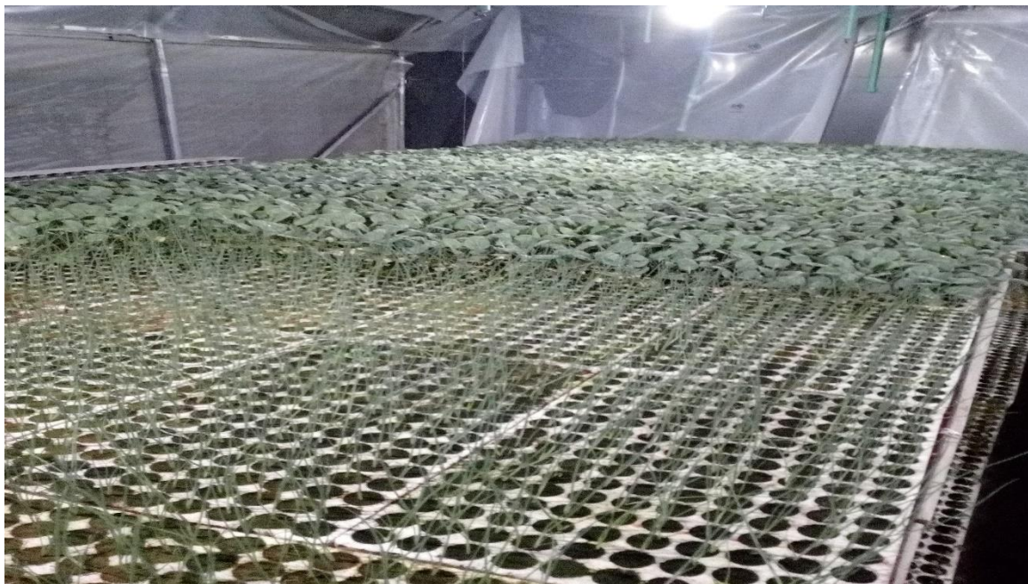
Slika 2. Uzgoj presadnica