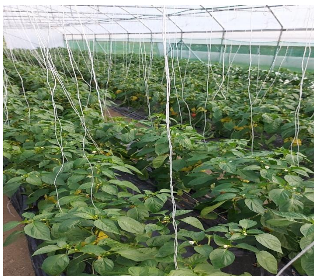
Slika 18. Paprika u plasteniku

Na paprici se ostavljaju dvije plodne grane te se ona veže s dvije potporne špage, dok se ostale grane i zaperci odstranjuju. Paprika u sezoni naraste u visinu i do 1,50 m.