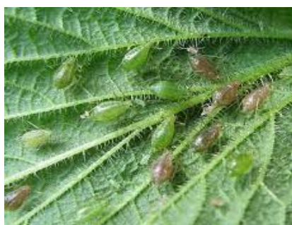
Slika 7. Lisne uši

Lisne uši ( Aphidae ) prave znatne štete kada su biljke u ranijim fazama razvoja, pogotovo kod uzgoja presadnica. Pojavu lisnih ušiju na najmlađem vršnim dijelovima biljke treba kontrolirati već kod proizvodnje presadnica, a posebno nakon presađivanja na otvorene gredice ili u polje. Štete od lisnih ušiju su vidljive na vršnom lišću gdje sisaju biljne sokove i biljke gube prirodnu zelenu boju. Mogu prenositi razne viruse sa svojim usnim aparatom poput virusa mozaika krastavca, Y virus krumpira i slično ( https://www.chromos-agro.hr/ ).