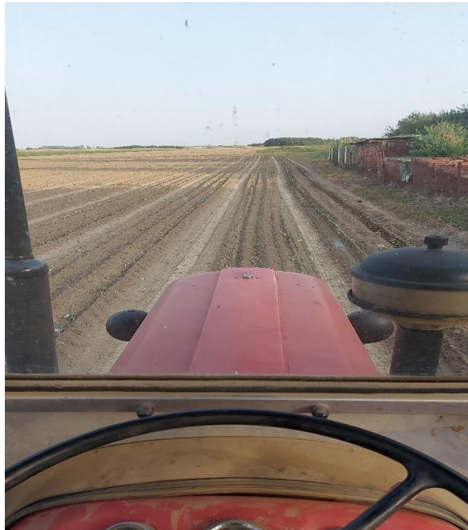
Slika 15. Presadnice na otvorenom polju