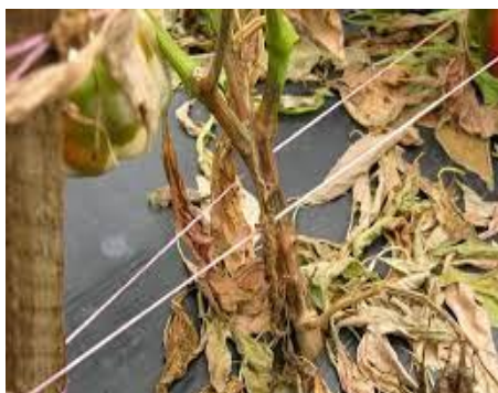
Slika 3. Phytophthora capsici

Phytophthora capsici je uzročnik polijeganja presadnica, truleži korijena, vrata korijena i plodova paprike (Slika 3). Ukoliko do zaraze dođe iz tla nakon presađivanja tada se simptomi javljaju u zoni korijenova vrata (pojava smeđe boje, nekroze i vlažne truleži kore) i biljke venu i suše se. Ako se bolest pojavi u pazušcima lista ili grane tada odumiru dijelovi biljaka koji se nalaze iznad. Zaraza na paprici se može izvršiti direktno ili preko peteljke lista ili ploda. Simptomi na listu su vidljivi u obliku nekrotičnih pjega gdje se pojavljuje micelij za vrijeme vlažnog vremena.