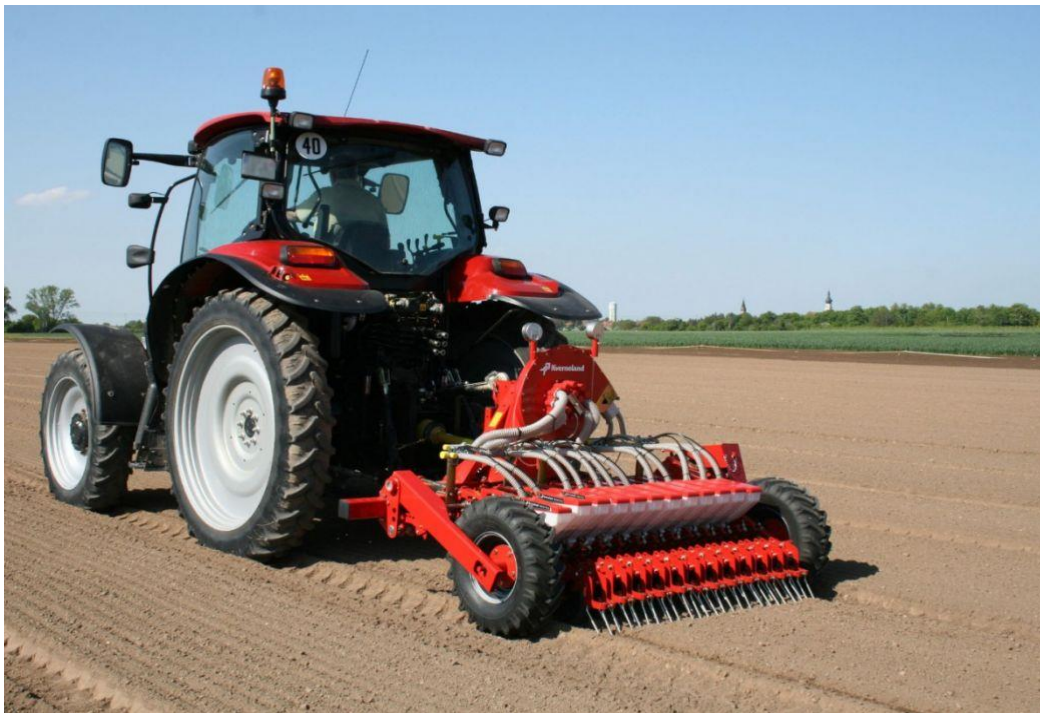
Slika 13. Sijačica za sitno sjeme

Proljetna sadnja na OPG-u se obavlja u 3 različite ture ili termina. Vrijeme sadnje najviše ovisi o vremenskim uvjetima. U prvoj turi se sije povrće direktnom sjetvom sjemena ili polaganjem sadnog materijala kao npr. mahune, grašak, špinat, a zatim krumpir i luk. Ovisno o vremenskim uvjetima, sjetva se obavlja početkom ožujka ili kasnije. Sjetva svih sjemena se odvija posebnim sijačicama sitnog sjemena (Slika 13), dok se krumpir i luk sade sadilicama namijenjenim za te kulture.