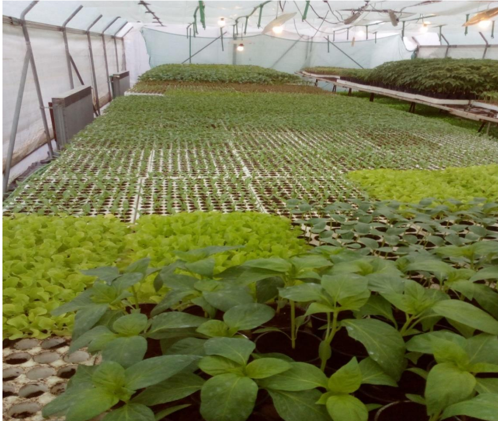
Slika 12. Plastenik za proizvodnju presadnica

Cjelokupna proizvodnja presadnica odvija se u plasteniku specijaliziranom za proizvodnju presadnica u kojemu je pod popločen, pokriven duplim slojem folije tj. dvostrukom folijom te sustavom za grijanje i navodnjavanje (Slika 12). Nakon sjetve plastični kontejneri se odlažu na stolove namijenjene u tu svrhu. Temperature se u plasteniku kreću između 22°C i 25°C što omogućuje optimalnije klijanje te rast i razvoj presadnica.