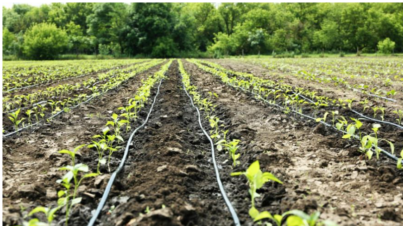
Slika 16. Sustav navodnjavanja kap po kap