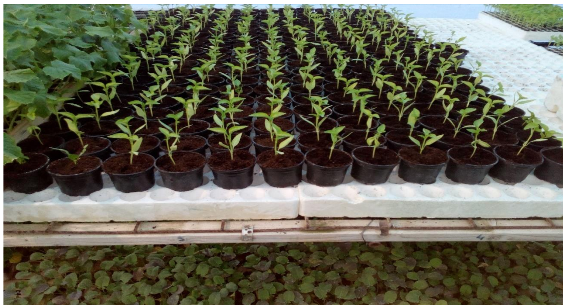
Slika 11. Pikirane presadnice paprike

Za proizvodnju presadnica potrebni su kontejneri koji mogu biti plastični, tresetni ili od polistirena. Postoje i strojevi za sjetvu koji se nazivaju i linije za sjetvu, ali na OPG-u se to još uvijek odvija ručno. Prvo se kontejneri napune supstratom gdje se višak supstrata odstrani. Zatim se u supstratu označi sjetveno mjesto u koje će ići sjeme te se nakon postavljanja sjemenja sve ponovno pokriva supstratom. Sjetva se odvija uglavnom od 10.2. do 10.3. svake vegetacijske godine. Za sjetvu se koriste isključivo hibridi povrća da bi osigurali dovoljno kvalitetne presadnice i kasnije prinos. Presadnice paprike i rajčice se pikiraju da bi se dobila veća i bolja sadnica (Slika 11).