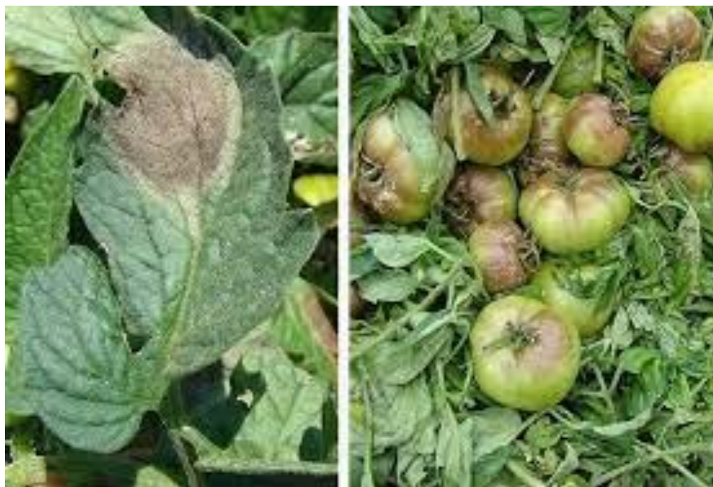
Slika 6. Štete na rajčici od uzročnika Phytium debarianum

bakterija i antagonističkih gljiva, zaštita kemijskim preparatima. Tretiranje se odvija nakon sadnje ili nakon pikiranja i rastađivanja (Paradićović, 2009).