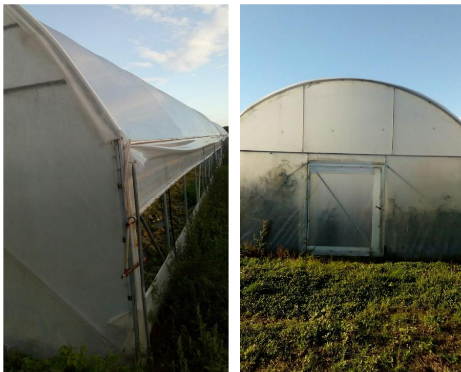
Slika 20. Plastenici na OPG-u Renata Drašković

Za navodnjavanje se koristi voda iz bušenih bunara koja se direktno koristi uz prethodnu filtraciju, a primjenjuje se putem sustava kap po kap. Crna malč folija osigurava zagrijavanje vode u cijevima i ispod folije te tako ne dolazi do primjene vode preniske temperature.