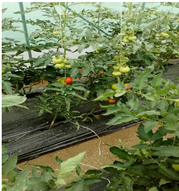
Slika 17. Rajčica u zatvorenom prostoru