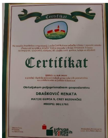
Slika 1. Certifikat vlastite proizvodnje i prodaje

OPG Renata Drašković počelo je s radom 2011. godine. Početna proizvodnja obavljala se na površinama od 0,01 ha zaštićenih prostora te 0,4 ha na otvorenom. Proizvodni program su činile uglavnom rajčica, paprika i salata. Kroz godine rada i unaprjeđenja, OPG je narastao na površine od 0,1 ha zaštićenih prostora te 4 ha uzgoja na otvorenom. OPG trenutno proizvodi preko 10 različitih vrsta povrća koje se plasira na tržnici, odnosno direktnom prodajom krajnjem potrošaču.