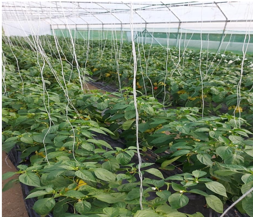
Slika 14. Uzgoj u zaštićenom prostoru

Druga tura je sadnja presadnica u zaštićene prostore koja se obavlja u drugoj polovici ožujka ili početkom travnja, a ovisno o temperaturi (Slika 14). U njima se nakon obrade tla oblikuju gredice na koje se postavlja sustav navodnjavanja (sustav kap po kap) koji se zatim prekriva malč folijom. Na foliji se buše rupe te se sadnja presadnica odvija ručno. Nakon sadnje presadnica, presadnice paprike, rajčice i krastavaca salatara se vezivom vežu za postavljenu žičanu mrežu pri vrhu plastenika da bi se suzbilo polijeganje što je redovita i propisana mjera njege. Za krastavac kornišon se postavlja mreža kao potpora kako bi se omogućio neometan rast i razvoj i olakšala berba.