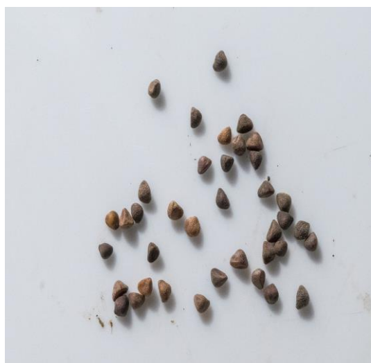
Slika 25. Sjemenke ( Ipomoea purpurea L.)