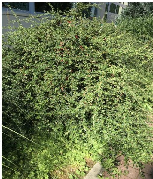
Slika 28. Listopadni grm- Mušmulica ( Cotoneaster spp. )

Cotoneaster spp. poznata je po tome što može apsorbirati 20 posto više zagađenja u odnosu na drugo raslinje, a razlog je njena gusta krošnja i struktura lišća. Sadnja bilja predstavlja dobar način zaštite zdravlja jer se time znatno apsorbira količina ugljika ( https://www.pcnen.com ).