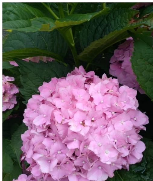
Slika 6. Cvat ( Hydrangea macrophylla L.)