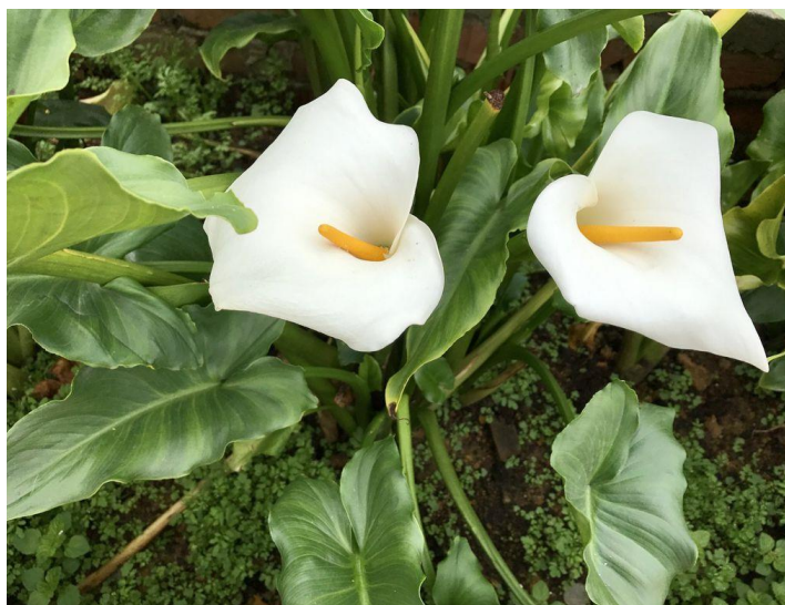
Slika 33. Cvijet- Kala ( Zantedeschia spp. )

Biljka se uzgaja u kućnom vrtu. Vrlo su popularni ukrasi za svečane prigode. Međutim, kala se ubraja u vrlo otrovne biljne vrste. Svi dijelovi biljke sadrže kristale oksalata (Alsop i Karlik, 2016.). Konzumacijom dijelova biljke uzrokuje iritaciju, žarenje i peckanje u ustima i jeziku. Moguće je i povraćanje te lučenje velike količine slina. Zbog pojave intenzivne boli u ustima obično se izbjegava konzumacija velike količine biljke. Kala je posjeduje otrovne alkaloida koji mogu izazvati iritaciju kože te se preporučuje kod branja kale koristiti rukavice. Bitno je napomenuti da je kala otrovna za kućne ljubimce, tako da se njome mogu otrovati mačke i psi ( https://mojecvijece.com ).