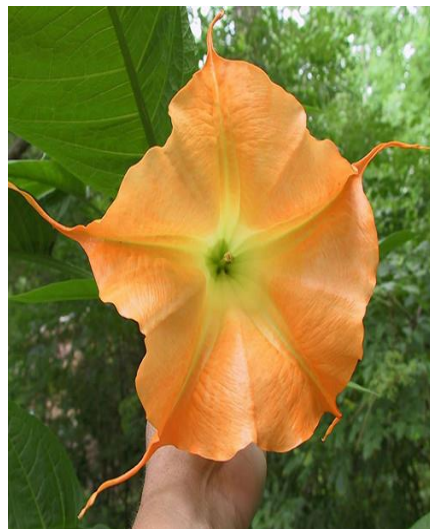
Slika 23. Cvijet ( Brugmansia suaveolens L.)