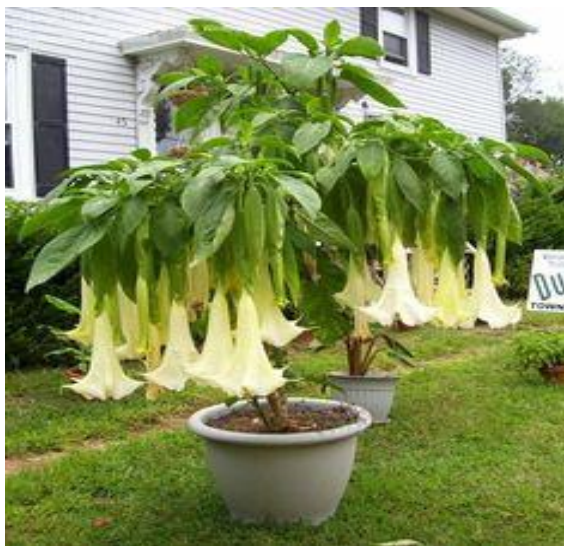
Slika 22. Anđeoska truba ( Brugmansia suaveolens L.)

Tradicionalno se biljka koristila kao halucinogen i za izazivanje euforije. Također se koristi u tradicionalnoj biljnoj medicini za liječenje iritacija kože, artritisa, glavobolja i reumatizma (Lowry, 2013.).