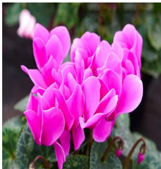
Slika 18. Cvijet