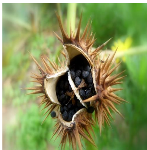
Slika 31. Tobolac ispunjen crnim sjemenkama ( Datura stramonium L.)