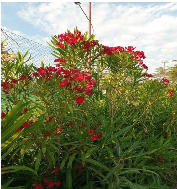
Slika 9. Oleander ( Nerium oleander L. )

Svi dijelovi biljke su otrovni. Biljka sadrži otrovne kemijske tvari kao što su oleandrin i nerin koji se smatraju kao dva vrlo moćna srčana glikozida. Oleander s crvenim cvjetovima se smatra otrovnijim od ostalih boja cvjetova. Biljka je otrovna iako se osuši. Konzumiranjem jednog lista za dijete je to smrtonosna doza. Simptomi trovanja su mučnina, povraćanje, bol u trbuhu, letargiju i vrtoglavicu. Ostali ozbiljni simptomi su usporen rad srca, napadaj i koma. Smrtna doza za ljude očituje se u 4 grama, a simptomi traju od 1 do 3 dana. Iako posjeduje mirisne note, također se smatraju štetnim za organizam. Cvjetni parfem može izazvati iritaciju dišnih putova, a kontakt kože sa sokom može izazvati dermatitis kod osjetljivih osoba ( https://www.childrens.health ). Ako koža stupi u kontakt s biljkom, potrebno je isprati vodom.