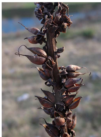
Slika 16. Plod tobolac