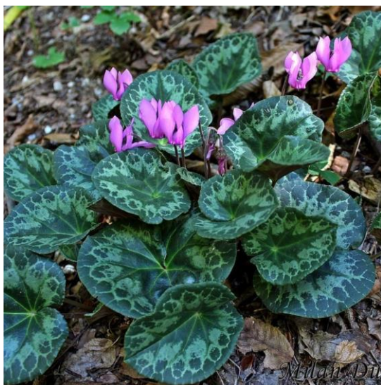
Slika 17. Ciklama ( Cyclamen hederifolium L.)

Ciklama posjeduje otrovne kemijske tvari zvane triterpenoidni saponini, najviše se nalaze u gomolju. Konzumacija gomolja može biti problematičnija u odnosu na konzumaciju listova ili cvijeta. Gomolji su lošeg okusa te će doći do male vjerojatnosti konzumacije. Simptomi trovanja su povraćanje, proljev što dovodi do smanjenja tekućine u tijelu. Naime, većom konzumacijom biljke može uzrokovati abnormalnosti srčanog ritma te napadaje ( https://cornwallmanor.org ).