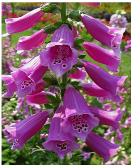
Slika 15. Cvjetovi zvonolikog oblika- Naprstak ( Digitalis purpurea L.)

Naime, biljka se u prošlosti nije smatrala opasnom, već i ljekovitom biljkom. Prije nego što se naprstak počeo koristiti za liječenje i rješavanje srčanih problema, Irci su je vidjeli na drugačiji način. Koristili su ga kao narodni lijek. Oni su ga vidjeli kao ljekovitu biljku koja se koristi za liječenje raznih kožnih problema, kao što su čirevi, ali i glavobolja i paraliza. U ranim stadijima biljka se ponekad može zamijeniti s gavezom ili trputcem. Ta pogreška može biti vrlo opasna i smrtonosna ako pokušate napraviti biljni čaj s običnim naprstcem ( http://bioweb.uwlax.edu ).