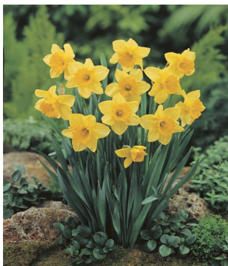
Slika 7. Narcis ( Narcissus L. )

Lukovica narcisa vrlo je slična običnim povrtnim lukovima, ali nema miris po luku te ne izaziva suzenje oka. Lukovica sadrži kemijske tvari zvani oksalati, konzumiranjem lukovice, oksalati uzrokuju jako peckanje i iritaciju usana, jezika i grla. Također, izazivaju iritaciju kože. Ako je došlo do konzumacije, savjetuje se ispiranje usta vodom ili mlijekom. Za simptome popraćene povraćanjem ili proljevom, potrebno je pripaziti na dehidraciju. Također, mogući su i jaki bolovi u grlu, poteškoće s gutanjem ili slinjenjem. Lukovica se smatra najotrovnijim dijelom biljke narcis, ali otrovni su i svi drugi dijelovi. Svi dijelovi sadrže otrovnu kemijsku tvar koju nazivamo likorin, a najveću koncentraciju likorina nalazimo u lukovici. Međutim, konzumacijom bilo kojeg dijela biljke dovodi do trovanja. Simptomi trovanja su mučnina, povraćanje, bol u trbuhu i proljev koji u prosjeku traju oko 3 h ( https://www.poison.org/ ). Naime, većom konzumacijom otrovni dijelova biljke mogući su i ozbiljniji problemi kao što su nizak krvni tlak, pospanost i oštećenje jetre.