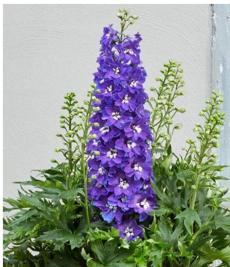
Slika 20. Kokotić ( Delphinium L. )

U davna vremena ljudi su koristili Delphinium u medicinske svrhe, pa čak i za opuštanje i bolji san. Također su koristili cvijet za liječenje i liječenje uboda škorpiona i parazita. Danas to više nije slučaj, jer cvijet sadrži toksine koji mogu uzrokovati unutarnje probleme posebice bolesti srca, nizak krvni tlak i probleme sa disanjem ( https://www.littleflowerhut.com ).