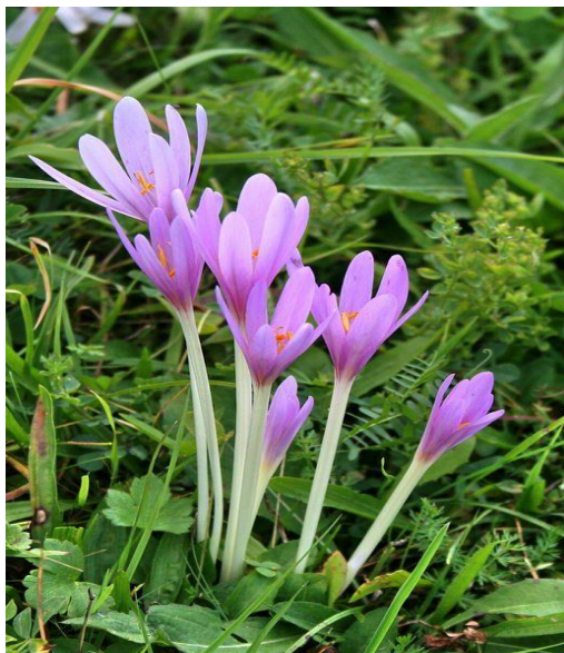
Slika 34. Cvijet- Jesenski mrazovac ( Colchicum autumnale L.)

Razlike između jesenskog mrazovca i šafrana. Jesenski mrazovac je krupniji i cvjeta na livadama u jesen, a šafran cvjeta u proljeće. Zbog svojih širokih listova mrazovac se često zamjeni za šafran koji se koristi kao lijek u svrhu čišćenja krvi. Šafran je poznat po svom specifičnom mirisu koji podsjeća na miris bijelog luka, dok jesenski mrazovac ne posjeduje nikakav miris.