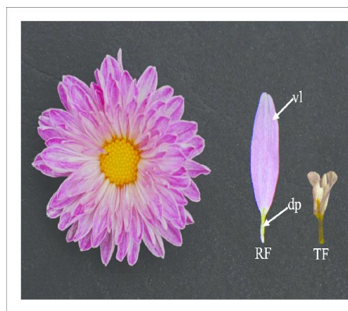
Slika 12. Prikaz sastava cvata