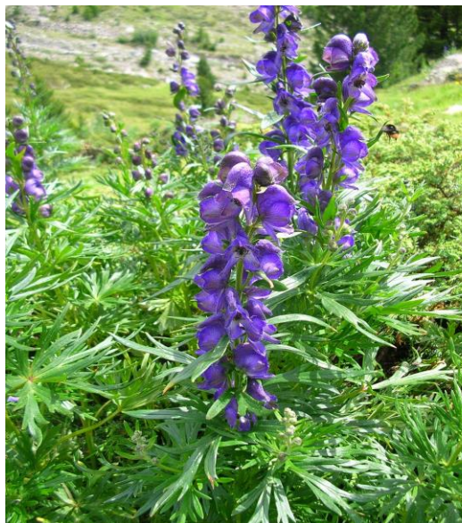
Slika 32. Cvjetovi- Modri jedić ( Aconitum nappelus L.)

Biljka se koristila u lovu. Njome su se trovali vrhovi oružja (koplje i strijele) te bi pomoću njih uspjeli savladati životinju. Naime, Aconitum napellus koristio se i kao dodatak hrani (mamac) za vukove.