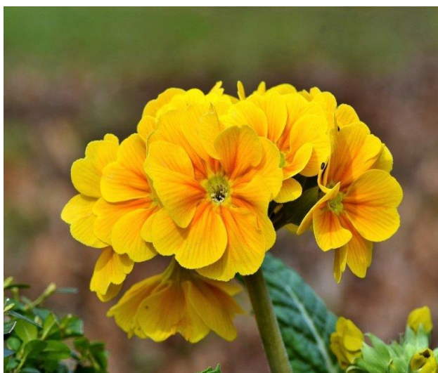
Slika 19. Cvijet- Jaglac žeravac ( Primula obconica L.)

Također, biljka se smatra opasnom tokom cvatnje jer ispušta alkaloidne koji mogu izazvati mučnine i povraćanje te se preporučuje da se biljka ne drži u zatvorenim prostorima gdje većinu vremena boravite.