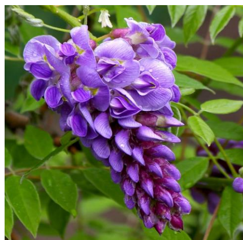
Slika 14. Cvat grozdaste strukture