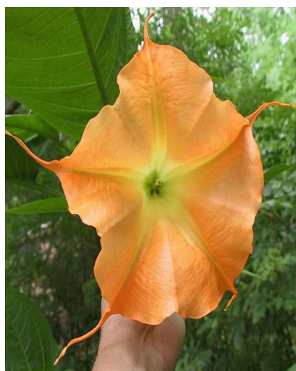
Slika 23. Cvijet ( Brugmania suaveolens L.)