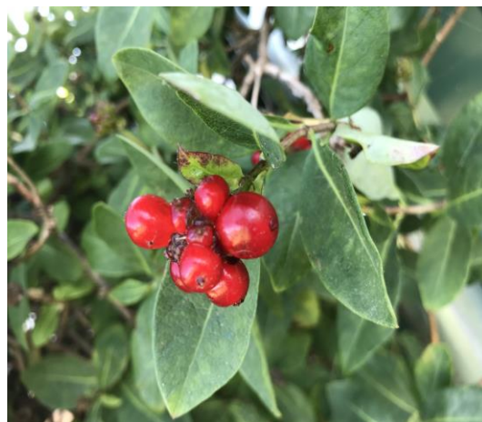
Slika 27. Plod ( Lonicera L. )