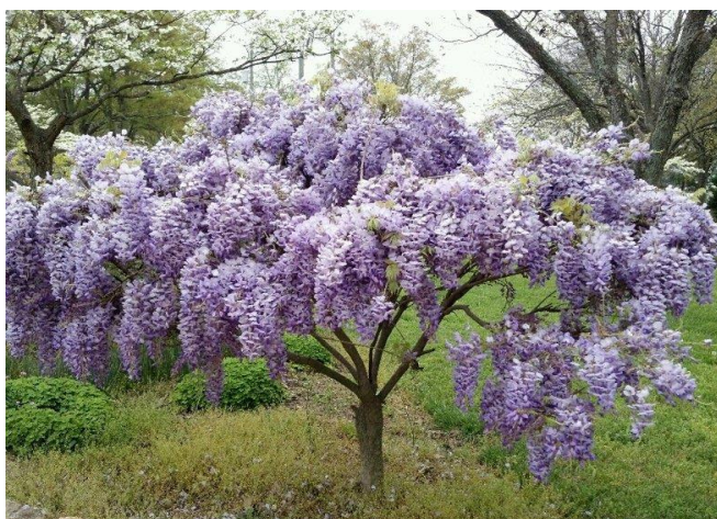
Slika 13. Stablo glicinije ( Wisteria L. )

Mahune i sjemenke se smatraju najotrovnijim dijelom biljke, ali i svi ostali dijelovi sadrže otrovne kemijske tvari kao što su lektin i wisterin. Trovanjem biljke sa samo dvije sjemenke može uzrokovati posljedice, kao što su oralno pečenje, bol u želucu, proljev i povraćanje. Gastrointestinalni simptomi mogu se pojaviti za 1,5-3,5 h. Javljaju se simptomi kao što su zbunjenost, sinkopa, vrtoglavica i slabost (Slattery, 2005.). Konzumacijom dijelova biljke dodatno je zabilježen porast broja bijelih krvnih stanica. Navedeni simptomi se općenito povuku unutar 1-2 dana. Također, prilikom paljenja iste biljke preporučuje se ne udisati dim jer su istraživanja pokazala da izlaganje dimu izgaranjem ove biljke uzrokuje glavobolje.