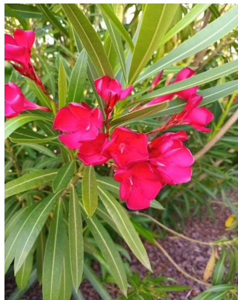
Slika 10. Cvijet ( Nerium oleander L. )