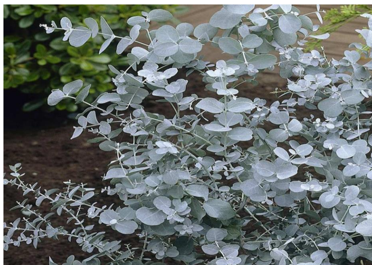
Slika 2. Eukaliptus ( Eucalyptus gunnii L.)

Ubraja se u zimzeleno stablo (Slika 2.). Dolazi iz porodice Mierčike ( Myrtaceae ). Vrlo su poznate samonikle biljke u Australiji, Novom Zelandu, Tasmaniji i Indoneziji. U visinu raste i do 80 m. Kod biljke lišće je zeleno-sive boje, široko i plosnato. Eukaliptus sadrži eukaliptol. Eukaliptol je organski spoj koji je vrlo toksičan u visokim dozama. Listovi biljke su otrovni za ljude. Znakovi trovanja eukaliptusom mogu uključivati bolove u želucu i peckanje, vrtoglavica, mišićna slabost, male zjenice oka, osjećaj gušenja i neki drugi. Ulje eukaliptusa također može uzrokovati mučninu, povraćanje i proljev. Smrtonosna doza se očituje u 3,5 mL ne razrijeđenog ulja. Iako listovi posjeduju otrovne kemijske tvari, koriste se u medicinske svrhe i kozmetici. List eukaliptusa sadrži kemikalije koje bi mogle pomoći u kontroli šećera u krvi. Sadrži kemikalije koje mogu djelovati protiv bakterija i gljivica. Njegovo isparavanje je baktericidno i fungicidno te mnoge bolnice stavljaju eukaliptus na prozor. List se koristi kao lijek za infekciju, vrućicu, pomaže u ublažavanju kašlja, astme, plućne tuberkuloze, za akne, rane, opekline, jetra te za probleme sa žučnim mjehurom. Za potrebnu konzumaciju ulje je potrebno razrijediti. Razrijeđeno ulje uzima se na usta kod bolova i otekline (upala) sluznice, respiratornog trakta, kašlja, bronhitisa, bolova i upala sinusa, astme, kronički opstruktivna pluća i respiratorne infekcije ( https://hr.orthopaedie-innsbruck.at/ ).