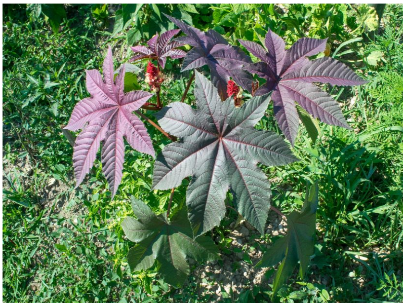
Slika 1. Ricinus ( Ricinus communis L.)

Iako su svi dijelovi biljke otrovni, sjemenke se koriste u medicini i kozmetici. Sjemenke su sadrže 45-55% ulja. Ulja koja se koriste u medicini i kozmetici nije otrovno, jer sjemenke prolaze kroz preradu. Hladnim tiještenjem sjemenki dobiva se biljno ulje pogodno za uporabu. Nekoć se ulje smatralo lijekom (laksativ) kod zatvora, no prestalo se primjenjivati jer izaziva unutarnje krvarenje.