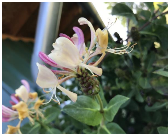
Slika 26. Cvijet- Kozja krv ( Lonicera L. )

Biljka je bogata kalijom, kalcijem i magnezijem, a sadrži i blago otrovan saponin. Kada su to otkrili ribolovci. Kozju krv su počeli koristiti tako što su potapali u potok da bi omamili ribu i potom je lakše ulovili ( https://www.bastovanka.com ).