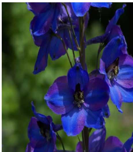
Slika 21. Cvijet ( Delphinium L. )