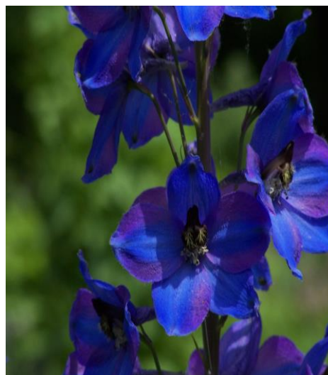
Slika 21. Cvijet ( Delphinium L. )