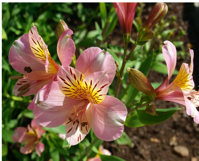
Slika 35. Cvijet- Peruanski ljiljan ( Alstroemeria aurea L.)

Alstroemeria aurea poznat je i kao cvijet prijateljstva. Odabir boje nose različito značenje. Crveni ljiljan je boja ljubavi i vjernosti, ružičasti simbolizira nježne osjećaje, bijela simbolizira čistoću i duhovnost, žuti ljiljan simbolizira radost i optimizam, narančasta simbolizira buđenje i strast te ljubičasta koja simbolizira elegantnost i gracioznost.