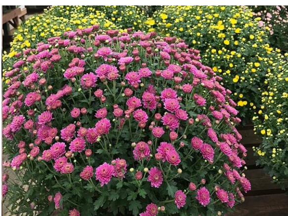
Slika 11. Krizantema ( Chrysanthemum L. )

Chrysanthemum u Hrvatskoj najčešće se koristi kao ukrasno vrtno cvijeće. Vrlo su otporne na niske temperature. Simboliziraju prolaznost, smrt i žaljenje te se uoči blagdana Svih svetih nose na groblje. Dok se u drugim zemljama primjenjuju u druge svrhe. Pa tako, u Kini se od krizantema radi vino koje zrije godinu dana, a ispija se devetog dana u devetom mjesecu i vjeruje se kako taj čin obitelji donosi dug, miran i zdrav život ( https://www.vrtlarica.com ).