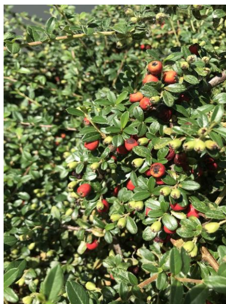
Slika 29. Plod ( Cotoneaster spp. )