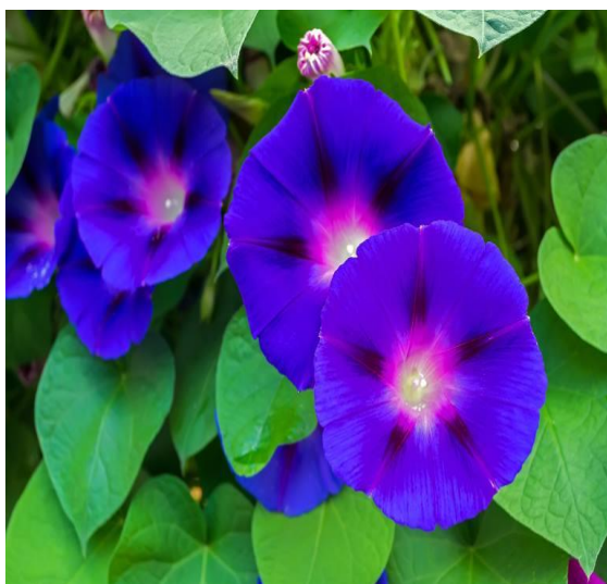
Slika 24. Cvijet- Vrtni slak ( Ipomoea purpurea L.)

Jedna od zanimljivosti vrtnog slaka ( Ipomea purpurea ) je ta da predstavlja kratko vrijeme koje provodimo na zemlji. Svaki cvijet podsjeća na naše vrijeme života i da je svemu suđeno da dođe kraju. Biljka cvjeta u jutarnjim satima, od izlaska sunca, a ono predstavlja vrijeme života. Dok je noć simbol smrti jer biljka umire čim zađe sunce.