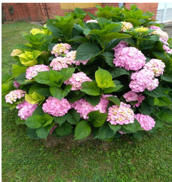
Slika 5. Hortenzija ( Hydrangea macrophylla L.)

Hortenzija se ubraja među otrovne biljke. Sadrži saponine koje često pronalazimo u ljekovitim biljkama, u malim količinama pozitivno djeluju na organizam. Međutim, u koncentriranom obliku može doći do iritiranja sluznice u ustima i području želuca. Jedna od otrovnih tvari koje hortenzija sadrži je cijanovodik. Budući da cijanovodik blokira ključni enzim u respiratornom lancu može brzo dovesti do nedostatka kisika. Opasnost od trovanja ovisi o količini konzumacije te o dijelovima biljke. Konzumirana količina i dijelovi biljke utječu na rizik od trovanja. Iako je cijela biljka smrtonosna, lišće i cvjetovi imaju najvišu razinu toksičnosti. Simptomi trovanja kod ljudi su vrtoglavica, tjeskoba, nedostatak daha, grčevi ili problemi s cirkulacijom (Abby, 2021.). Zbog svog gorkog okusa mala je vjerojatnost da će doći do veće količine konzumacije te i do trovanja.