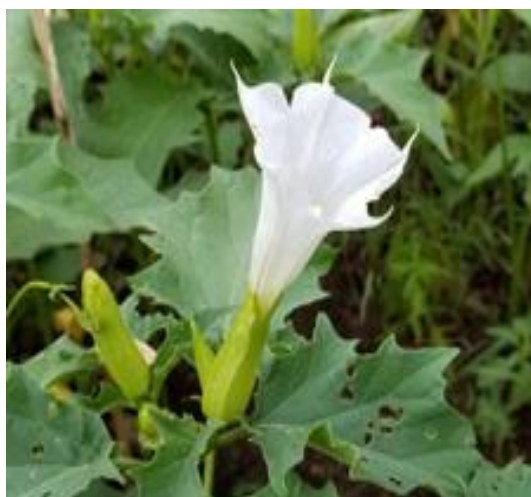
Slika 30. Cvijet- Bijeli kužnjak ( Datura stramonium L.)

Datura stramonium se koristio za liječenje raznih ljudskih bolesti, uključujući čireve, rane, upale, reumatizam i giht, išijas, modrice i otekline, groznicu, astmu i bronhitis te zubobolju. Datura stramonium koristila se u obliku paste ili otopine za ublažavanje lokalne boli, ne mora imati štetan učinak; međutim oralna i sustavna primjena može dovesti do teških antikolinergičkih simptoma (Gaire i Subedi, 2013.).