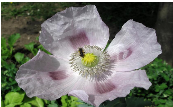
Slika 3. Vrtni mak ( Papaver somniferum L. )

Simptomi trovanja opijumom su mučnina, usporeno disanje, zatvor, zbunjenost, suha usta i sluznica nosa, tjeskoba, depresija, povraćanje, nesаница te svrbež. Predoziranje opijumom, osoba može pasti u komu i smrt. Opijum također utječe na mnoge unutarnje organe kao što su mozak, dišni sustav, središnji živčani sustav, gastrointestinalnog sustava, imunološkog sustava te jetra (Vermai sur., 2019.). Iako se smatra jakim opijumom. Koristi se u medicinske svrhe. Opijumski mak ima dugu povijest upotrebe kao lijek. Naime, posjeduje najvažnije terapijske vrijednosti. Koristi se kao analgetik, narkotik, sedativ, stimulans te kao i nutritiv. Također, koristan je i za glavobolju, kašalj, nesanicu, srčanu astmu te u liječenju žučnih kolika. Napomena, upotrebljava se samo u slučaju iznimno teških bolova zbog posjedovanja velike otrovnosti.