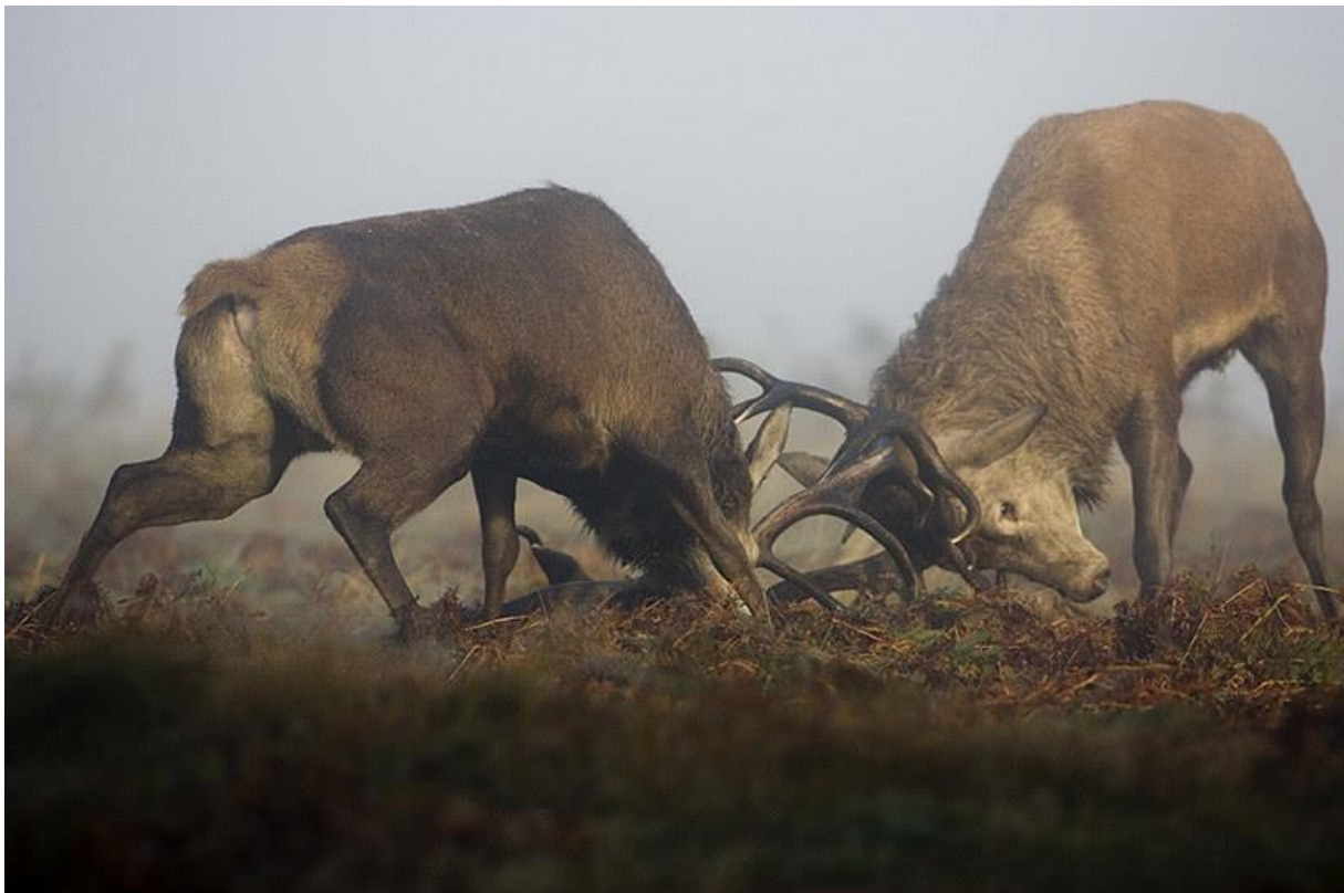
Slika 2. Dvoboj mužjaka u sezoni parenja

također uglavnom ugibaju mužjaci što je razlog omjera spolova odrasle jelenske divljači u korist ženki.