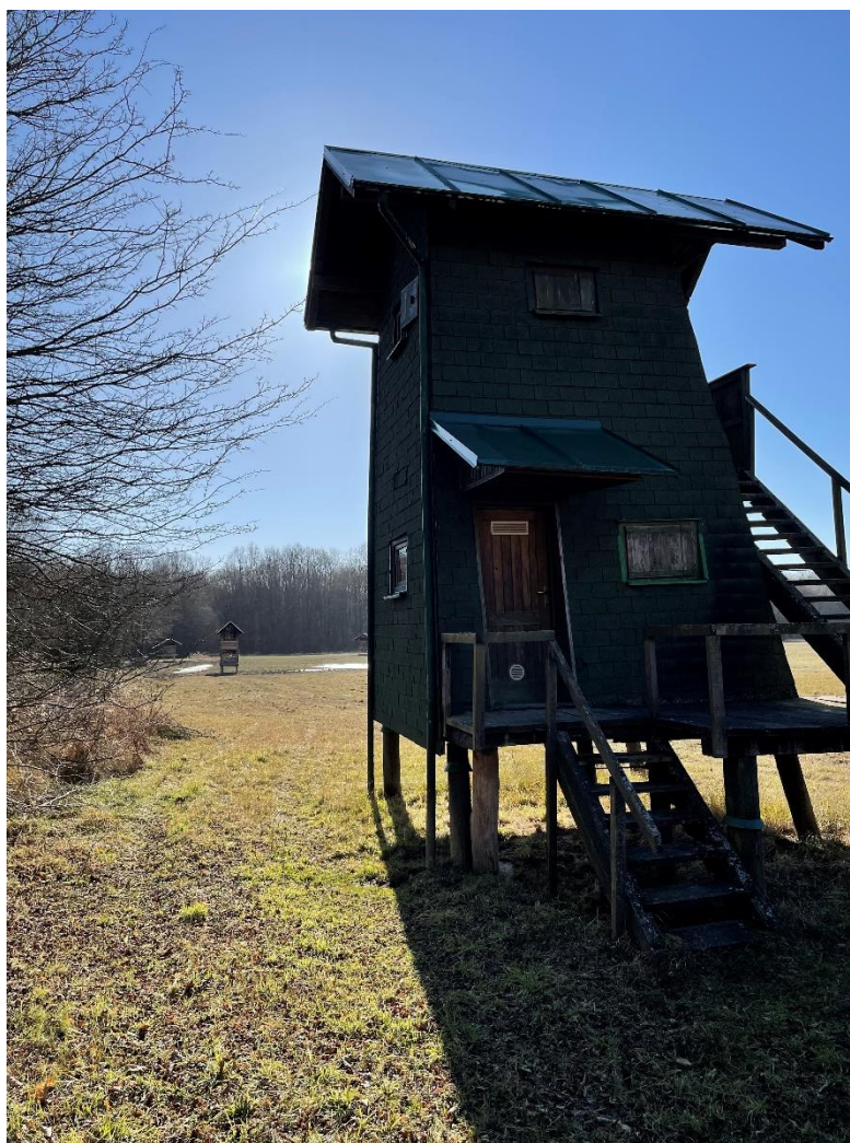
Slika 10. Osmatračnica u lovištu „Kapelački lug“

Od lovnotehničkih objekata u lovištu pronalazimo čeke i osmatračnice. One su zapravo tehnički jednaki objekti , ako su podignute za promatranje divljači onda su osmatračnice, a ako su podignute radi lova onda su čeke. Osmatračnice su postavljene u vidokrugu hranilišta, s njih se ne lovi. Čeke su postavljene na putevima jelenske divljači , na rubovima šuma ovisno o dominantnim vjetrovima. Putevi do čeka su očišćeni od grančica tako da divljač ne bi čula primijetila lovca kada se penje na čeku, a granje koje zaklanja vidik redovno se reže. Izrađene su od drveta . metalne čeke ne dolaze u obzir se jer se prvenstveno ne uklapaju u prirodu, mogu biti opasne za vrijeme grmljavine, a zvukovi koji se proizvode u dodiru s metalnom čekom su nepotrebni te zbunjuju i uznemiruju nama dragocjenu divljač.