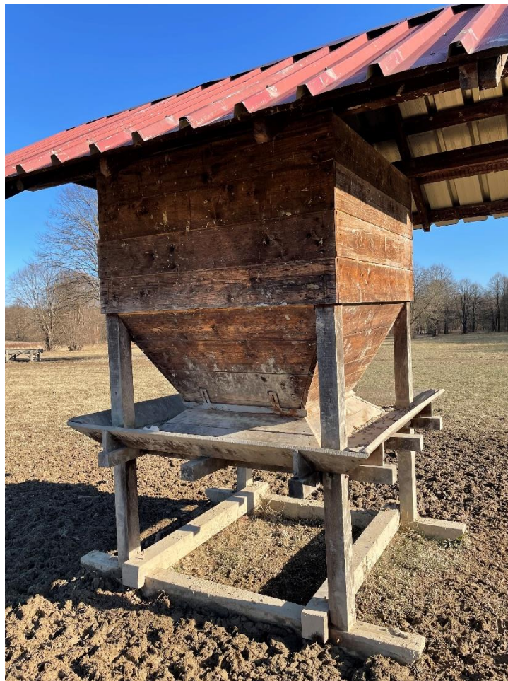
Slika 9. Hranilište za jelensku divljač za zrnatu hranu

Solišta su u lovištu postavljena uz hranilišta, kako bi se redovno nadopunjavala i kontrolirala divljač koja dolazi na sol. Spremišta za hranu su u većini slučajeva i mjesta hranjenja jelenske divljači. Hranilišta za jelensku divljač izrađena su od drva kao prirodnog materijala, dostupna divljači i da se što drže oduže. Lovnotehnički objekti se redovno obilaze i zapisuje se njihovo stanje te se sukladno tome popravljaju ili podižu novi.