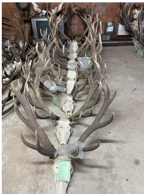
Slika 6. Ocjenjeni trofeji jelena običnog u lovištu Kapelački lug