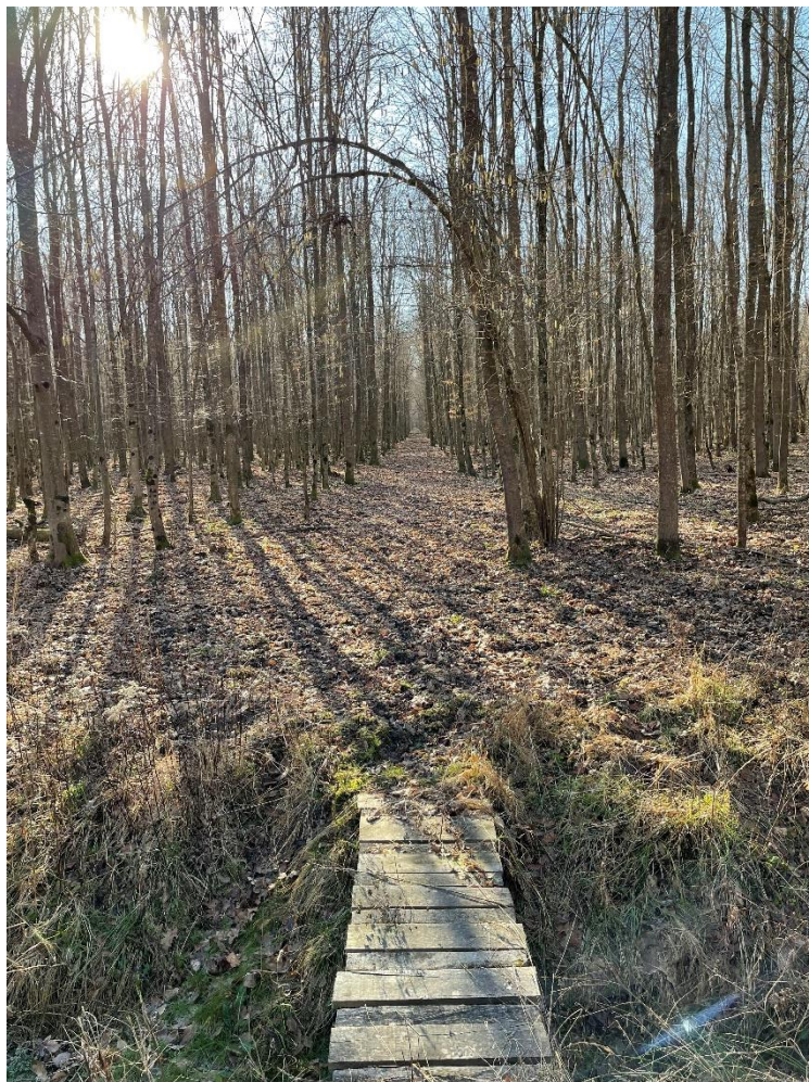
Slika 7. Šumska biljna zajednica u veljači – Lovište „Kapelački lug“

razvijena na pokosima odvodnih kanala , plićacima i obalama potoka. Livadna vegetacija nenadomjestiva je prehrambena baza sa svojom produkcijom zelene mase za jelensku divljač, ali i ostalu krupnu divljač. Stoga je obveza lovoovlaštenika da agrotehničkim mjerama potiče produkcije iste (podsijavanje, redovita košnja). S obzirom na vrste drveća, grmlja, prizemnog rašća te livadnu vegetaciju prehrambeni potencijal svih spomenutih biljnih zajednica povoljan je za se vrste divljači jer gotovo cijele godine osiguravaju dovoljno prirodne hrane, te se u tom pogledu nadopunjavaju.