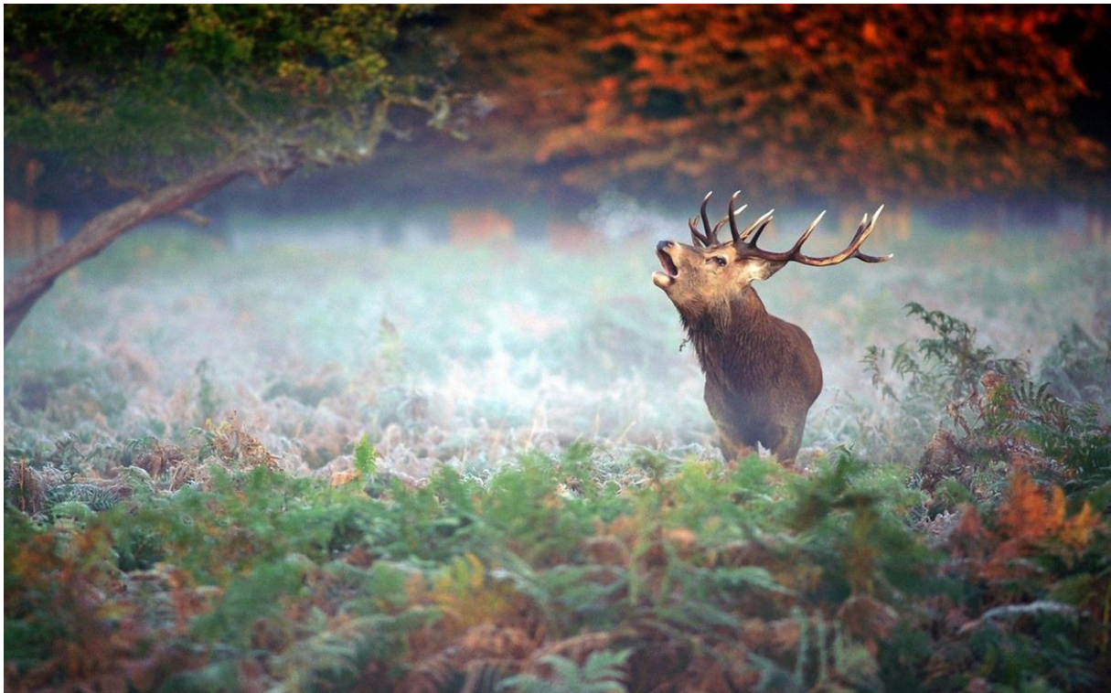
Slika 1. Jelen obični ( Cervus elaphus L.) u prirodnom staništu

izraženije. Boja dlake je ljeti hrđavo- crvena, na trbuhu svjetlija do žućkasta. Krški soj jelena je znatno tamniji boja mu je tamno- hrđastosmeđa što je odlika križanja s nizinskim sojem. Zimska dlaka je puno gušća i duža te varira od sivosmeđe do tamnosmeđe. Duža dlaka na vratu nakon treće godine dobiva izraziti oblik grive pa se po veličini grive približno ocjenjuje starost jelena. Zadnjica i košute i jelena je prljavo- bijele do žuto- crvenkaste boje, a obrubljena je tamnocrvenom dlakom , zimi je siva. Jelen ima vrlo dobro razvijena osjetila. Nanjušiti može čovjeka i na 150 metara uz povoljan vjetar, a također i dobro čuje. Zbog asigmatične građe očiju lošije vidi. Životni vijek jelena kreće se od 15 – 20 godina. Rast jelena završava sa 8 – 9 godina, a košute sa 3 – 4 godine (Mustapić i sur. 2004., Tucak i sur. 2002.).