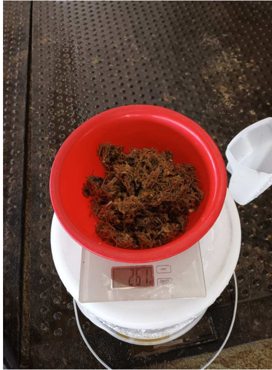
Slika 8. Pokus 1. sito