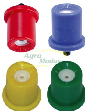
Slika 3. Mlaznice raspršivača

Mlaznice raspršivača (slika 3.) otporne na začepljenja zbog svoga okruglog dizajna otvora. Ove mlaznice su keramičke izrade te osiguravaju fine kapljice da bi se ostvarila visoka pokrivenost lisne mase, te imaju osigurač koji ih osigurava od ispadanja.