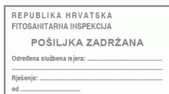
Slika 10. Izgled žiga, pošiljka zadržana