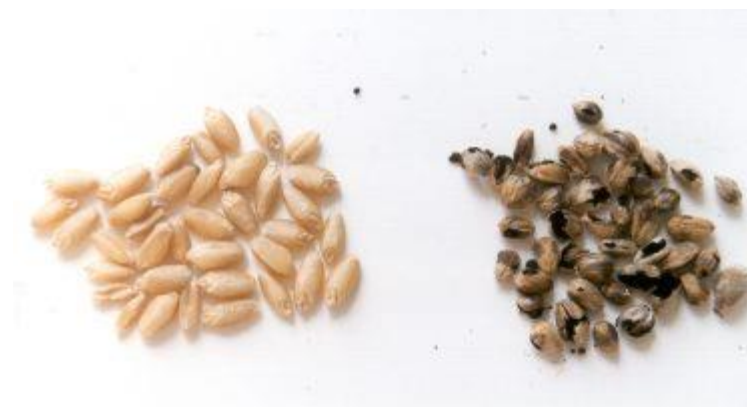
Slika 11. Simptomi zaraze Tilletia caries na zrnju pšenice

Prema autorima Sever i Cvjetković iz članka 2012. godine u jednom zaraženom zrnju može biti od 4 do 9 milijuna teliospora. U žetvi dolazi do pucanja zaraženih zrna prilikom čega se oslobađaju teliospore koje kontaminiraju zdrava zrna i tlo. Ako se posije kontaminirano sjeme istovremeno sa zrnjem klijanju i teliospore u bazidij koji sadrži 8 do 16 bazidiospora. Anastomozom dolazi do kopulacije fiziološki različitih bazidiospora te nastaje diploidni micelij.