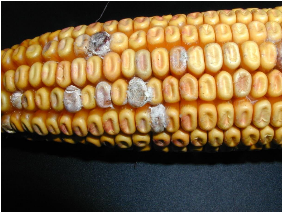
Slika 9. Prevlaka micelija Fusarium graminearum na zrnju kukuruza

uočiti dva tipa simptoma. Na vrhu klipa kukuruza u vidu crveno-ružičaste ili prljavo sivo-ružičaste prevlake koja se pruža od vrha prema bazi klipa uočljiv je prvi tip simptoma. Kod jačih slučajeva zaraze klipa komušina u potpunosti biva prekrivena micelijem parazita i zajedno sa svilom zalijepljena za klip kukuruza. Između zrna se može uočiti prevlaka bjeličastog micelija parazita (Slika 9.). Zrna su također zahvaćena, s njih se trulež širi na oklasak koji uslijed toga oslabi i lako je lomljiv. Ranije zaraze klipova dovode do njegove potpune truleži. Fusarium graminearum najčešći je uzročnik prvog tipa simptoma. Kod kasnijih infekcija simptomi nisu uočljivi na površini klipa, već između redova zrna ili na poprečnom presjeku klipa. U nekim godinama, u vrijeme berbe vidljivi su crni periteciji, plodišta telemorfno stadija gljive Gibberela zaeae , u kojima nastaju askusi s askosporama (Lević i sur., 2004).