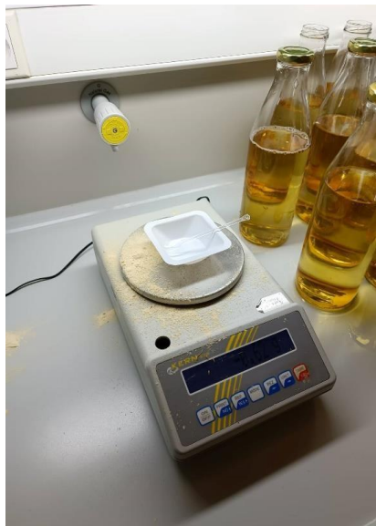
Slika 2. Vaga KERN 572 korištena za pripremu hranjivih podloga

Potato Dextrose Broth, Potato Dextrose Agar, Mycorrhiza medium (tekuća i čvrsta), Nutrient Broth i Azospirillum medium (tekući i čvrsti). Nakon što bi se za određenu kulturu od navedenih pripremio sadržaj, taj se sadržaj usipao u čistu bocu te se zatim taj sadržaj prelije destiliranom vodom i čvrsto zatvori čepom. Nakon rada s vagom (Slika 2.), ista se morala očistiti i isključiti.