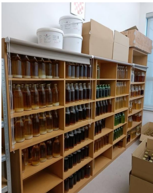
Slika 6. Boce s korisnim mikroorganizmima

U prethodno pripremljene vrećice s 1.5 kg Bio-lita pažljivo su se ulili mikroorganizmi Azotobacter chroococcum i Azospirillum brasilense , zatim su se dobro umiješali s supstratom, hermetički zatvorili s varilicom (Slika 7.) te je takva vrećica (Slika 8.) spremna za tretiranje sjemena. Na isti način se pripremio i biopreparat za zaštitu od bolesti koji je sadržavao benefiitnu gljivu Trichoderma harzianum i bakteriju Bacillus subtilis (Slika 9.).