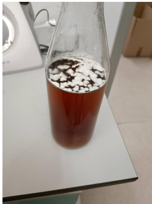
Slika 5. Mikroorganizmi u boci s hranjivom podlogom