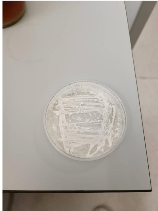
Slika 4. Kolonije korisnih mikroorganizama za potrebe proizvodnje biopreparata