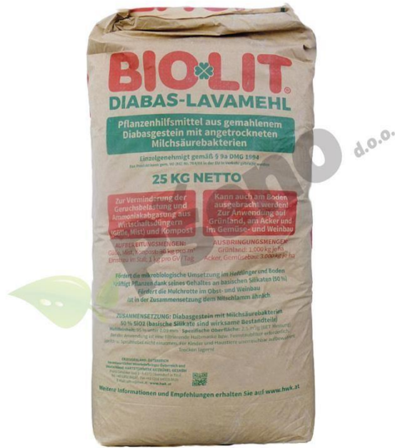
Slika 1. Biolit kameno brašno, supstrat za biopreparat

Potato Dextrose Broth, Potato Dextrose Agar, Mycorrhiza medium (tekuća i čvrsta), Nutrient Broth i Azospirillum medium (tekući i čvrsti). Nakon što bi se za određenu kulturu od navedenih pripremio sadržaj, taj se sadržaj usipao u čistu bocu te se zatim taj sadržaj prelije destiliranom vodom i čvrsto zatvori čepom. Nakon rada s vagom (Slika 2.), ista se morala očistiti i isključiti.