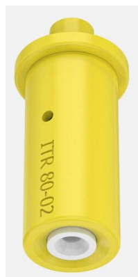
Slika 6. Lechler ITR model mlaznice