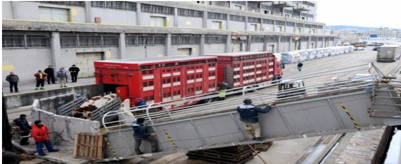
Slika 13. Kamion za transport stoke