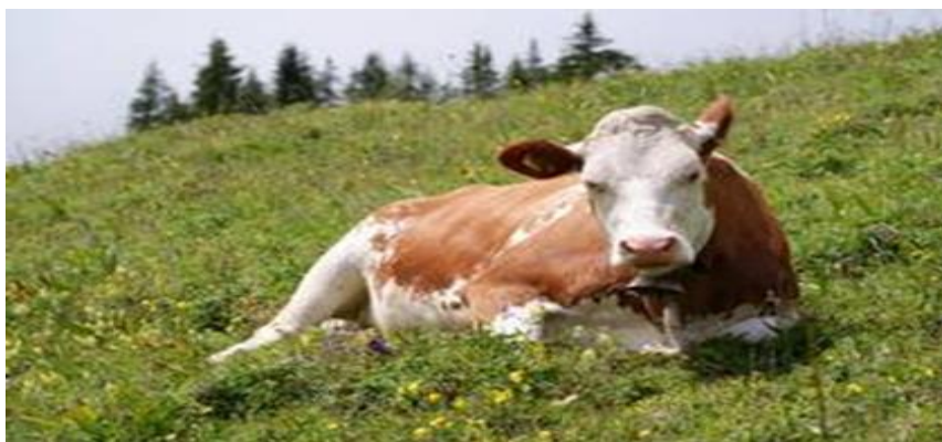
Slika 1. Pasma simentalac

Izbor pasmine uvjetovan je ekološkim prilikama i krmnim resursima područja u kojem se planira uspostava proizvodnje, nužnim investicijskim zahtjevima u farmsku infrastrukturu, tradicijskim navikama budućih proizvođača i njihovim osobnim afinitetima, kao i mogućnosti nabave i cijeni proizvodnih grla na tržištu. Simentalska pasmina je dominantna po broju i proizvodnji mlijeka i mesa u Hrvatskoj. Po svom genotipu predstavlja "plastični genom" za naglašeniju proizvodnju mlijeka ili mesa, zavisno o tržišnim kretanjima. Takvu karakteristiku nemaju jednostrano specijalizirane pasmine. Zato se smatra da je uputno i u vrlo naglašenoj potražnji za samo jednim govedarskim proizvodom dio fonda goveda uzgajati u kombiniranom tipu. U uvjetima kad je neostvariva internacionalna specijalizacija proizvodnje potrebno je njegovati uzgoj kombiniranog goveda.