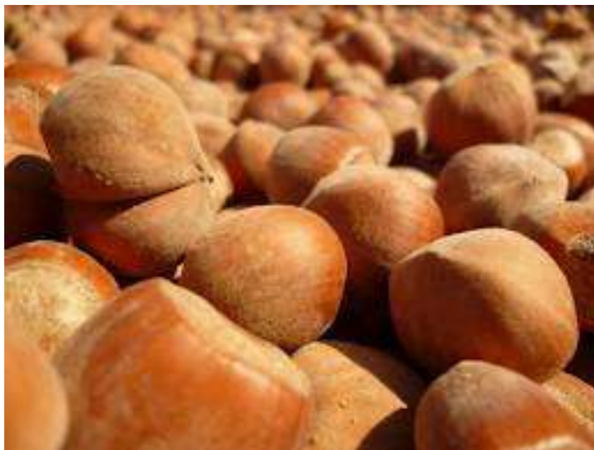
Slika 3. Rimski