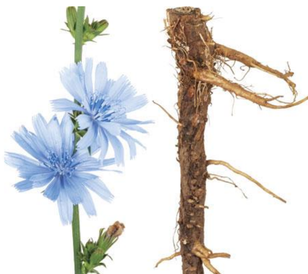
Slika 6. Cikoriija ( Cichorium intybus L.)

Korijen cikoriije se uvelike koristi kao sirovina koja služi u pripremi kave. Njen mesna ti zadebljali korijen predstavlja glavni dio cikoriije čija je glavna svrha dobivanje dodataka koji služe kavi. Prije čak 150 godina počelo je istraživanje kako bi upotreba cikoriije postala zamjena za kavu. Sorte cikoriije koje su bile dostupne u Europi i Aziji imale su vrlo malen i sitan korijen, loše kvalitete što je ponukalo proizvođače da krenu u smjeru selekcije i oplemenjivanja cikoriije kako bi se ostvarili što bolji rezultati u proizvodnji. Sam porast proizvodnje cikoriije dovodi do razvoja tehnologija za samu preradu pa tako tehnološki zreo svježi korijen cikoriije sadrži 13 % do 19 % inulina što se godinama kroz selekcije povećava. Što se nutritivnih vrijednosti tiče, cikoriija je iznimno velik izvor vitamina (vitamin C, betakaroten) i minerala (kalij). Mesnati zadebljali korijen sadrži 40 % inulina, tanine, masne kiseline, šećer (osobito fruktozu i manozu) te gorke tvari i pektine te se upotrebljava kao zamjena za kavu (Bošnjak, 1960.).