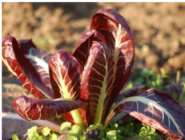
Slika 2. Radič

Radič je vrsta cikoriје uzgajana za prehranu odnosno salatu. Poneki ju još nazivaju crvena cikoriја zbog svoje tamno crvene boje, a u prirodi ga možemo pronaći upravo u ovom obliku jer se uzgaja isključivo za konzumiranje u prehrani. Intenzivan i jak okus, bogat željezom ostavljaju dojam prilikom konzumiranja radiča ( https://www.vrtlarica.hr/sadnja-uzgoj-cikoriје ).