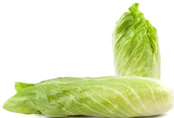
Slika 3. Slatka cikorija

Slatka cikorija poznata je po svom slatkom i ukusnom okusu. Više je kao salata pa je i popularnija za konzumaciju. Listovi su mu zeleni te se također se uzgaja, ali ga nema u prirodi. Listovi su joj hrskavi i mogu se duže čuvati u hladnjaku ( https://www.vrtlarica.hr/sadnja-uzgoj-cikorije ).