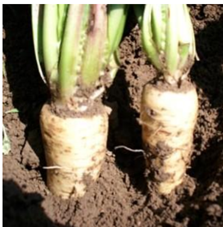
Slika 5. Stočna cikorija

Stočna cikorija koristi se i uzgaja upravo zbog svog zadebljalog korijena koji je pogodan za ishranu stoke i preradu u stočnu hranu. Korijen je sam po sebi sočan sa puno gorkog sadržaja zbog kojeg se u hranidbi stoke mora miješati s drugim krmivima kako bi se gorki sadržaj reducirao ( https://www.vrtlarica.hr/sadnja-uzgoj-cikorije ).