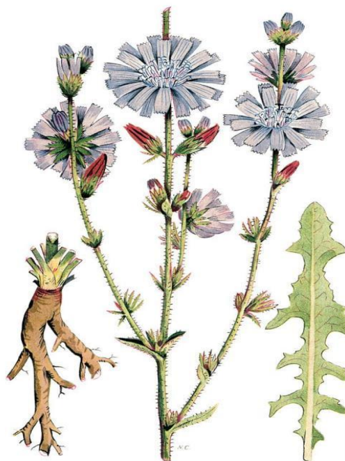
Slika 7. Morfologija cikoriје

Upravo takvo stanje biljke dovodi do smanjenja prinosa i smanjuje kvalitetu korijena koji je ključan predmet samog uzgoja, a takve se biljke nužno mora otkloniti s usjeva (Pospišil, 2013.).