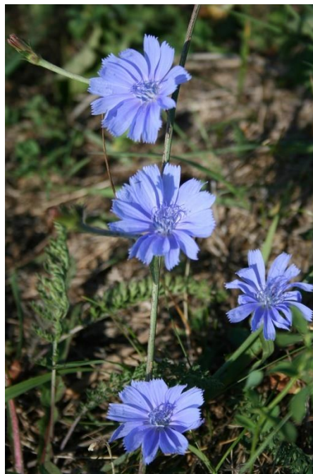
Slika 1. Divlja cikorija

Divlja cikorija je samonikla biljka koja sadrži velike količine sjemena te se iz tog razloga iznimno lako širi te ju upravo iz tog razloga možemo pronaći širom Republike Hrvatske. Listovi su mu gorki i opori, ali se kuhanjem smanjuje njihova gorčina, osim toga važan je dio mediteranske kuhinje jer se koristi kao sastojak u salatama. Divlji radič cvate prepoznatljivim plavo-ljubičastim cvjetovima ( https://www.vrtlarica.hr/sadnja-uzgoj-cikorije ).