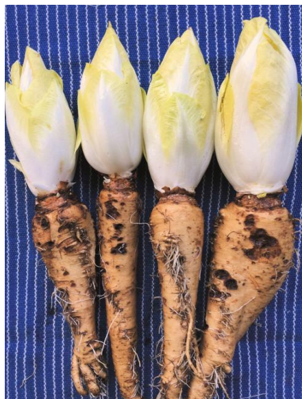
Slika 4. Belgijska endivija

Belgijska endivija je vrsta salate specifičnog izgleda. Ima usku bijelu glavu sa žutim vrhovima listova. Ima prilično ljut okus i vrlo je hrskav. Zato se najčešće priprema na roštilju s malo balzamičnog octa i izrazito je popularna u francuskoj kuhinji ( https://www.vrtlarica.hr/sadnja-uzgoj-cikorije ).