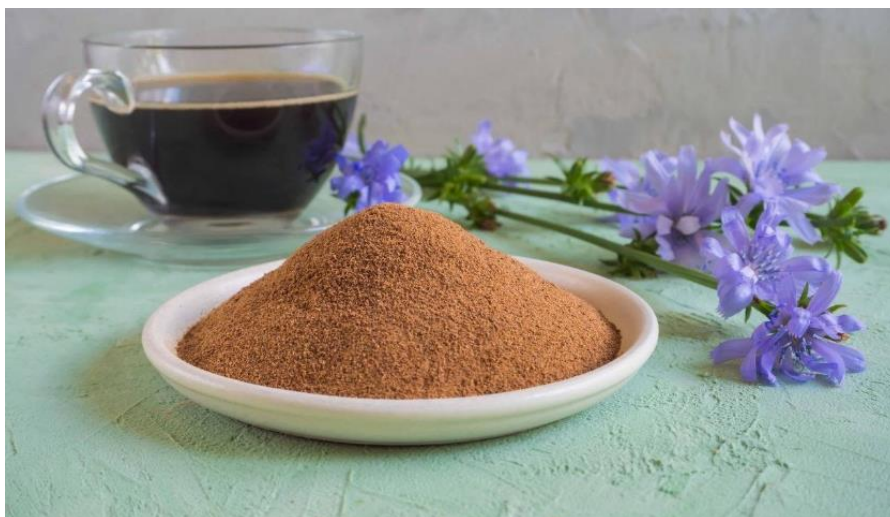
Slika 9. Dodatak kavi (prah cikoriје)

Procesom prženja korijena cikoriје razvija se specifična boja, okus i miris koji podsjeća na kavu te se upravo zbog toga koristi kao dodatak kavi. Oprani krojen se zagrijavanjem u bubnjevima na visokim temperaturama potiče proces razdvajanja inulina na glukozu i fruktozu što dodatku daje slatkoću, takve kockice pažljivo su birane od strane radnika, a kasnije prerađene u prah pomoću stroja za mljevenje.