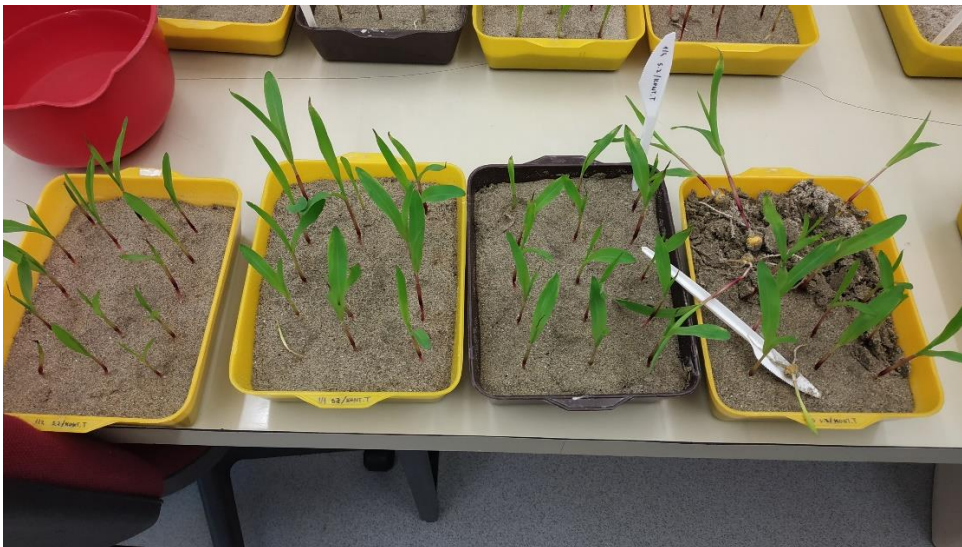
Slika 10. Klijanci tretman T2 – sterilno zrno i zaraženi pijesak