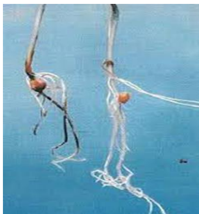
Slika 2. Trulež klijanaca kukuruza u uvjetima umjetne zaraze zrna gljivom Fusarium proliferatum