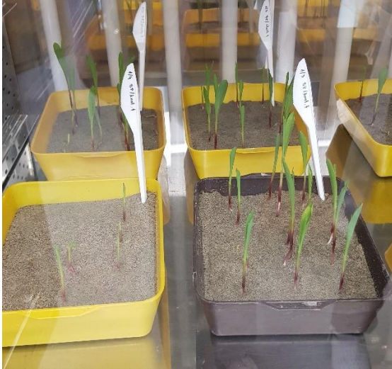
Slika 12. T4 tretman – klijanci kukuruza (Izvor: laboratorij za fitopatologiju) (Fakultet agrobiotehničkih znanosti Osijek)

Prema statistici prikazanoj u tablici 3. utvrđeno je da nema statistički značajnih razlika među tretmanima za sve elemente mjerenja osim mase korijena nakon liofilizacije. Tretman T4 se statistički razlikuje od tretmana T2 (Slika 12./13.) i kod njega je utvrđena najmanja masa korijena. Među tretmanima T1, T2 i T3 nije bilo statistički značajnih razlika.