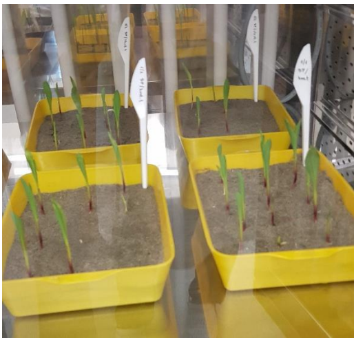
Slika 13. T4 tretman – klijanci kukuruza (Izvor: laboratorij za fitopatologiju) (Fakultet agrobiotehničkih znanosti Osijek)