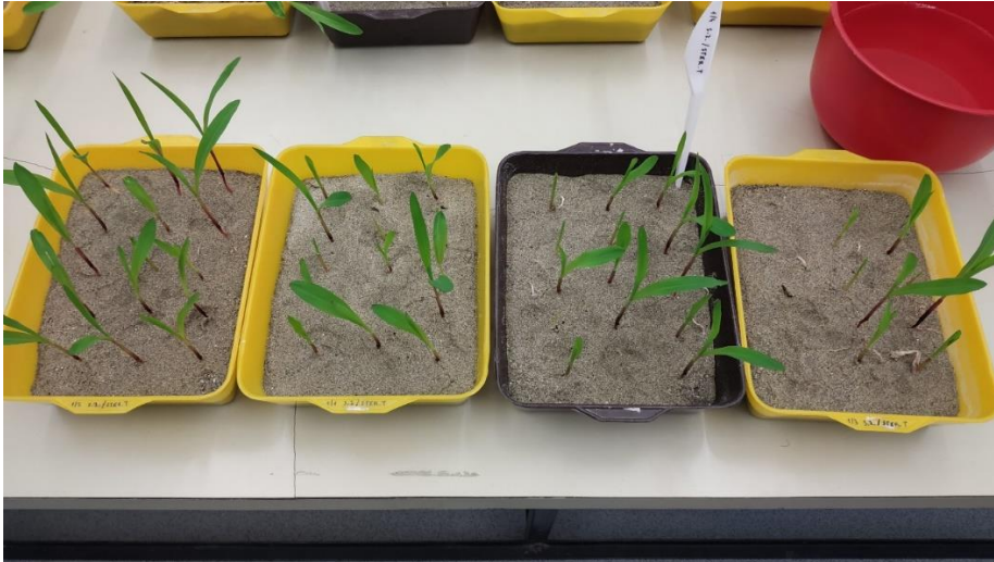
Slika 11. Klijanci tretman T1 – sterilno zrno i čisti pijesak