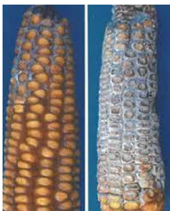
Slika 4. Simptomi truleži klipa kukuruza uzrokovane gljivom Fusarium graminearum (Izvor: Lević i sur., 2004.)