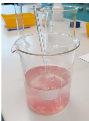
Slika 6. Izmiksana smjesa micelija Fusarium graminearum

Zaražena zrna su stavljena u posudice s pijeskom (10 zrna/posudici). Kako bi osigurali dobru zarazu pijeska on je dodatno zalijevan suspenzijom micelija u sterilnoj destiliranoj vodi. Za pripremu suspenzije korištene su 7 dana stare kulture F. graminearum . U 40 ml destilirane vode dodan je micelij iz jedne Petrijeve zdjelice (promjer 9 cm). Micelij je sastrugan sterilnim skalpelom te je miksanjem homogeniziran (Slika 6.). Svaki red zrna koja su zasijana je zaliven s 5 ml inokuluma F. graminearum . Zrna za sjetvu su dezinficirana na način da su prvo isprana pod mlazom tekuće vode, nakon toga 1 min. su držana u otopini 70 % etanola i potom su isprana dva puta po jednu minutu destiliranom vodom i posušena na sterilnom filter papiru. Dezinficirana zrna su potopljena u otopinu biološkog preparata u trajanju od 4 sata (10 ml BP/120 zrna). Kontrolna zrna su držana u destiliranoj vodi. Za sjetvu je korišteno 15 zrna po posudici. U tretmanima zalijevanja s BP jednokratno nakon sjetve, posijana su zrna zalivena s 5 ml biološkog preparata po redu. Tretmane smo označili oznakama T1, T2, T3 i T4 gdje slovo T označava tretman, a broj od 1-4 broj tretmana (Tablica 1.). Za zalijevanje je korišten razrijeđeni biološki preparat u omjeru 1:3. Biološki preparat je na bazi kapsaicina, a za sada nije komercijaliziran i u tijeku je njegova valorizacija.