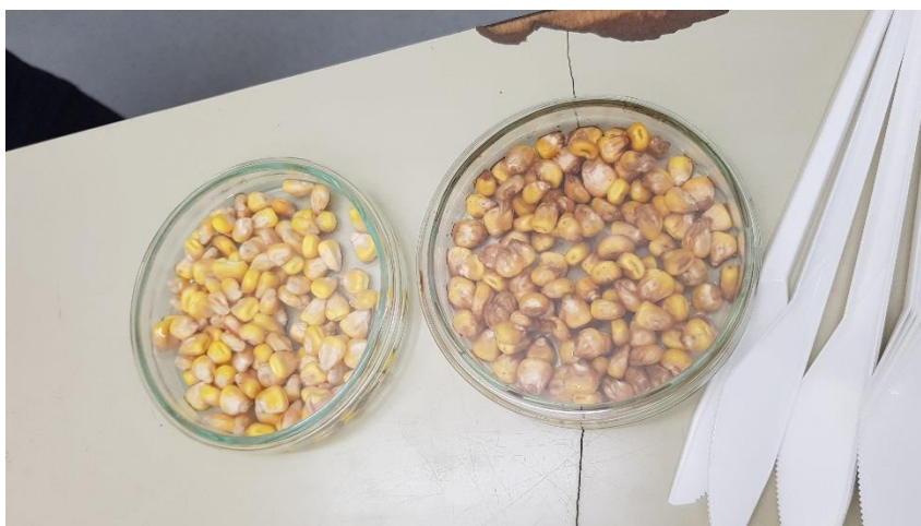
Slika 5. Zrna kukuruza namočena u destiliranoj vodi i biološkom preparatu u Petrijevim zdjelicama

U laboratorijskom pokusu je korišten biološki preparat (BP) na bazi ekstrakta kapsaicina koji je dokazan kao prirodni fungicid (El-Desouky i Hussain, 2022). Za provedbu pokusa korišteno je zrno kukuruza sa i bez biološkog preparata (Slika 5.) te sterilan i zaraženi pijesak. Pokus je postavljen u 4 tretmana. U svakom tretmanu je bilo četiri ponavljanja po 15 zrna kukuruza u svakom ponavljanju. Uzorci su postavljeni u posudice s pijeskom. Za inokulaciju supstrata (sterilni pijesak) korišten je izolat F. graminearum . Supstrat je zaražen zaraženim zrnima kukuruza i zalijevanjem suspenzijom micelija. Sterilni supstrat kontaminiran zrnima kukuruza zaraženim s F. graminearum je pripremljen na način da su u sterilni pijesak stavljena zaražena zrna s F. graminearum . Supstrat je navlažen i posudice su držane u termostatu na 22 °C 48 h prije sjetve. Zaražena zrna koja su korištena za kontaminaciju supstrata su pripremljena prema metodi Snijders i Eeuwijk (1991.). Zrna kukuruza namočena su u vodi preko noći (Slika 5.). Sljedećeg dana višak vode je dekantiran i zrna su autoklavirana i inokulirana izolatom F. graminearum . Inokulirana zrna inkubirana su tri tjedna na 25 °C, zaštićena od sunčeve svjetlosti.