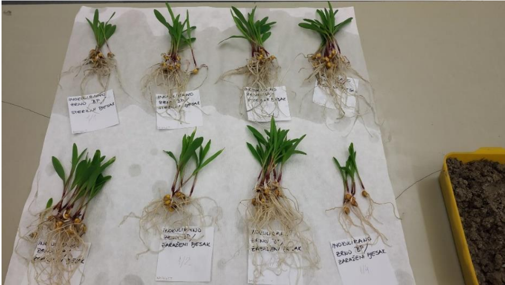
Slika 9. Klijanci kukuruza tretman T3 (gore) i T4 (dolje)