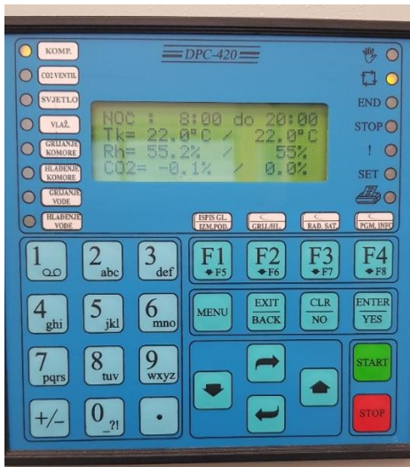
Slika 8. Program za podešavanje uvjeta klima komore