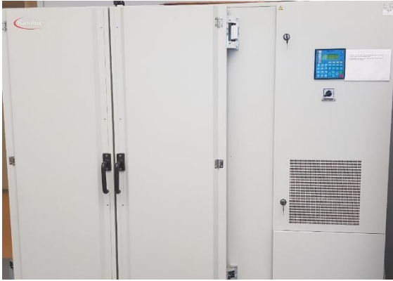
Slika 7. Klima komora