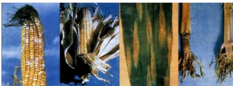
Slika 3. Trulež stabljike i vršnog klipa kukuruza