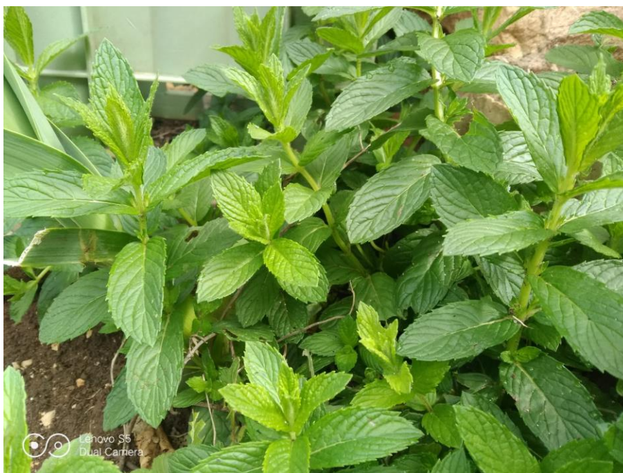
Slika 3. Paprena metvica

Njena najpoznatija primjena je u obliku eteričnog ulja koje se dobiva destilacijom listova i stabljika. Eterično ulje paprene metvice ima antiseptička svojstva i koristi se kao prirodni lijek protiv prehlade i kašlja. Također se koristi za ublažavanje glavobolje, smanjenje mučnine. Djeluje na bolji rad žuči, odstranjuje grčeve prouzrokovane žučnim kamencima ili pijeskom, smiruje želučane ili crijevne probleme i ublažuje podražaj na povraćanje. Osim toga, paprena metvica se koristi i kao sastojak u različitim proizvodima za njegu kože i kose