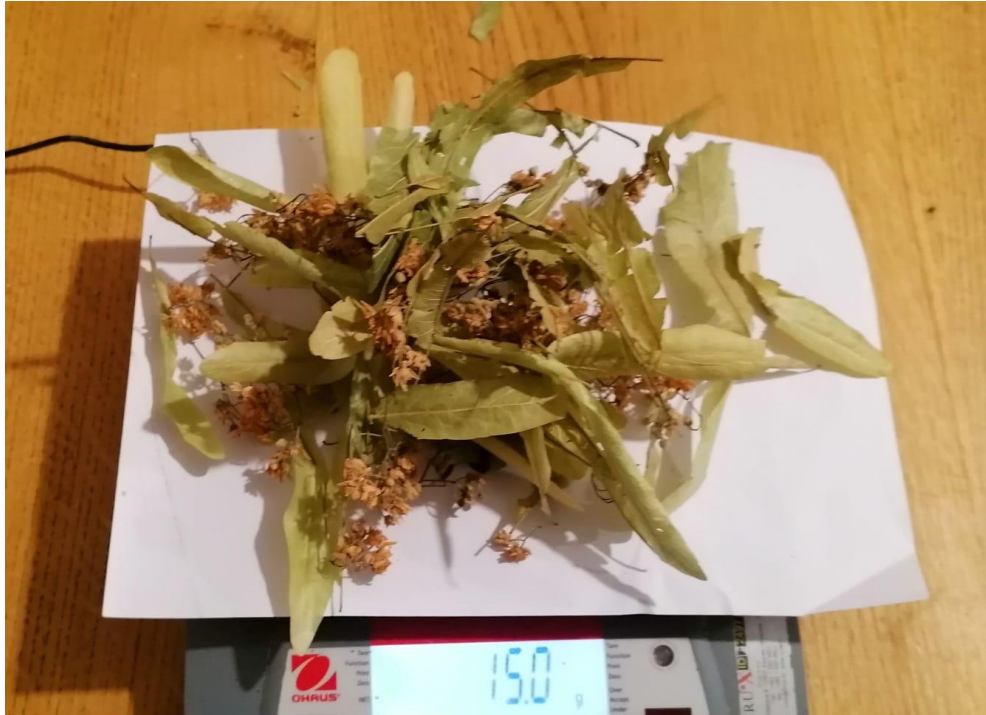
Slika 6. Vaganje biljaka (Vlastiti izvor)