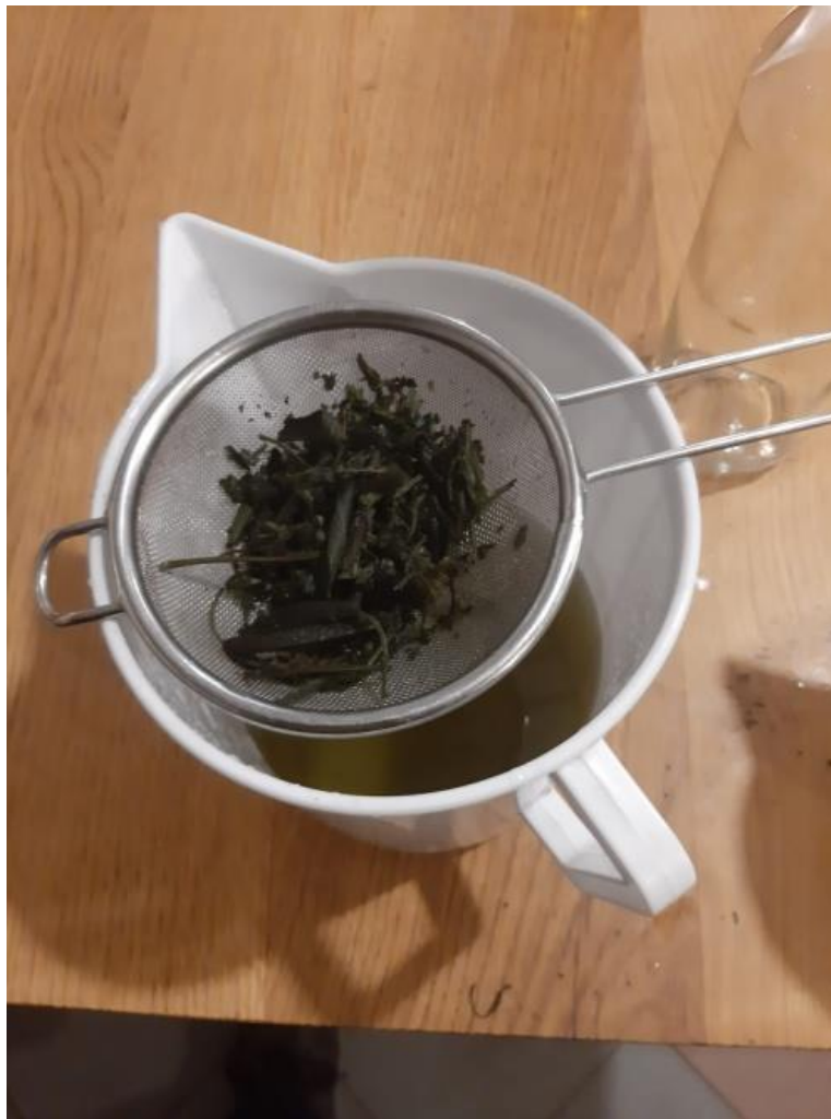
Slika 8. Procjeđivanje rakije

Nakon 15 dana maceracije procijedili smo po jedan uzorak macerata od sve tri trave (Slika 8.). Ostaci biljaka nakon što ih odvojimo od temeljne rakije se bacaju. Za filtraciju se može koristiti i filter papir. Nakon 30 dana maceracije procijedili smo i druga tri uzorka svake travarice, te ih uskladištili na tamnom i hladnom mjestu, kako bi se travarica sa protokom vremena harmonizirala.