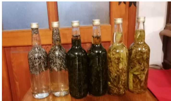
Slika 7. Maceracija rakije

Za izdvajanje sastojaka bilja može se koristiti maceracija, digestija ili perkolacija. U ovom radu koristili smo metodu tradicionalne maceracije (Slika 7.). Maceracija se u pravilu odvija u tamnim prostorima na sobnoj temperaturi. Mi smo za maceriranje suhih biljaka koristili rakiju komovicu jačine od 44 % vol. Tijekom maceracije u alkohol se prvo izdvajaju glikozid, eterična ulja i kumarin, a nakon toga klorofil i ostali spojevi.