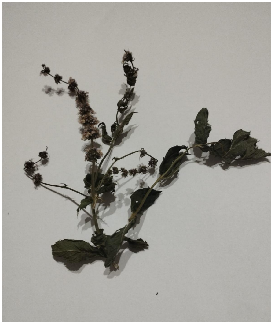
Slika 5. Sušenje metvice

Kao bazna rakija za travaricu koristila se komovica od 44% vol. Proizveli smo šest uzoraka travarice: 2 od kadulje, 2 od paprene metvice i 2 od sitnolisne lipe. Svaka od travarica macerirana je u dva različita vremenska perioda, prvi period od 15 dana i u drugom periodu od 30 dana. Za sve travarice dodana je ista količina osušenog bilja, u iznosu od 15 grama na litru svakog uzorka.