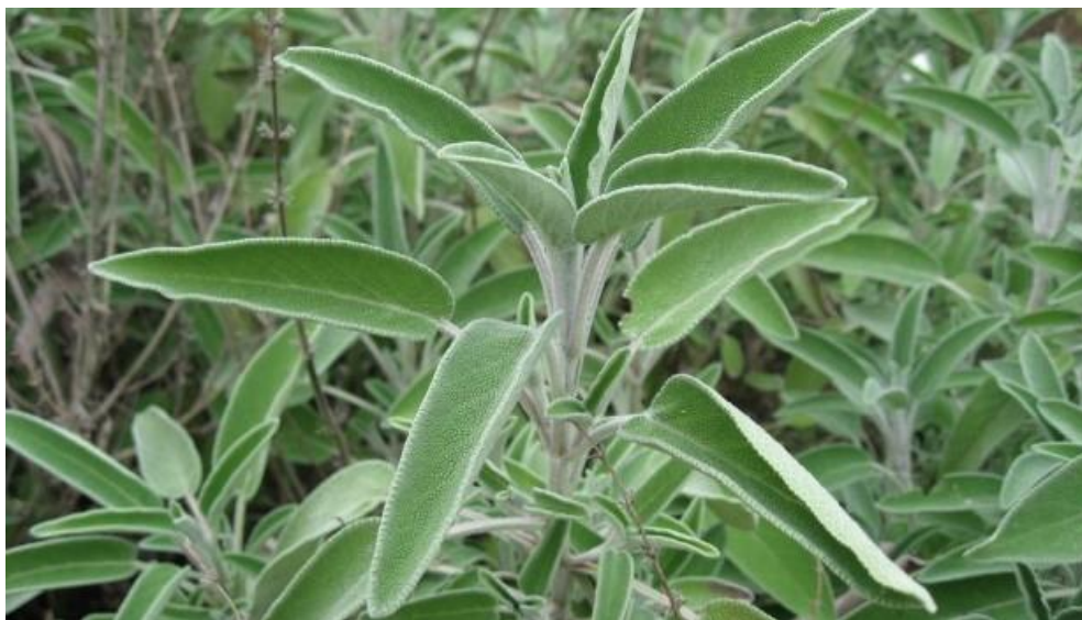
Slika 2 Kadulja

Kadulja od ljekovitih kemijskih tvari sadrži: esencijalna ulja, flavonoide, fenole, tanine, ružmarinsku kiselinu i tvari poput karnosola, rozmanola i izorozmanola koji su jaki antioksidansi. Flavonoidi su prisutni u cvjetovima kadulje i imaju antioksidativna svojstva, a fenolne kiseline su prisutne u listovima i imaju protuupalna svojstva. Tanini su prisutni u listovima i stabljikama kadulje, a njihova glavna funkcija je zaštita biljke od štetnika i infekcija. Kemijski sastav je uvjetovan zemljopisnim podrijetlom i razvojnim stadijem biljke ( www.gospodarski.hr , 2023.).