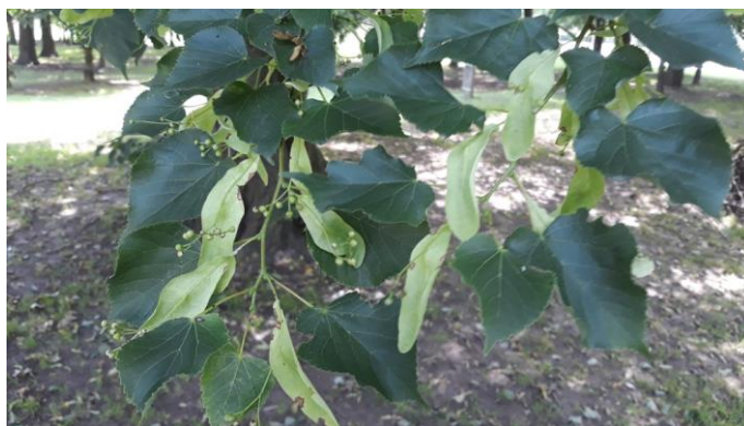
Slika 4. Sitnolisna lipa

Lipa je biljka koju posjećuju pčele i odlična je medonosna biljka. Cvjetovi se tradicionalno koriste u ljekovite svrhe. Čaj izaziva mokrenje, znojenje, preporučuje ga se kod prehlada, također ima protu upalna i antioksidativna svojstva. Cvjetovi se mogu koristiti i u kulinarstvu kao začin. Drvo lipa se lagano obrađuje i koristi se za izradu namještaja i glazbala.