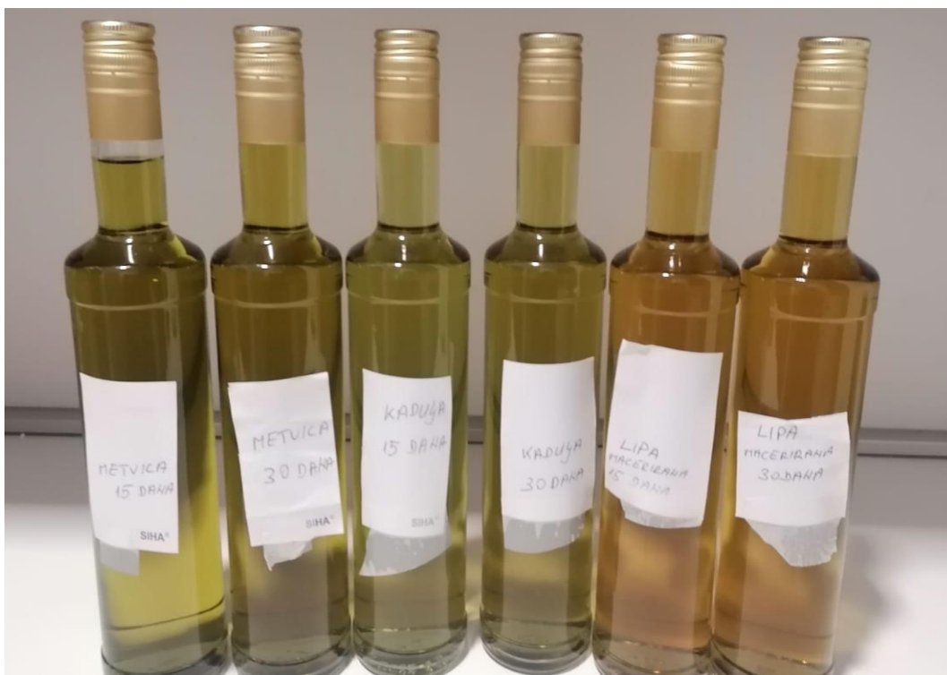
Slika 9. Skladištenje rakije (vlastiti izvor)

Gotove travarice smo nakon procjeđivanja punili u boce kapaciteta 0,5 l te ih začepili navojnim čepom i označili svaki uzorak. Nakon toga rakije smo spremili u skladište (Slika 9.). Boce se mogu začepiti i plutenim čepom, a u skladištu se čuvaju u okomitom položaju.