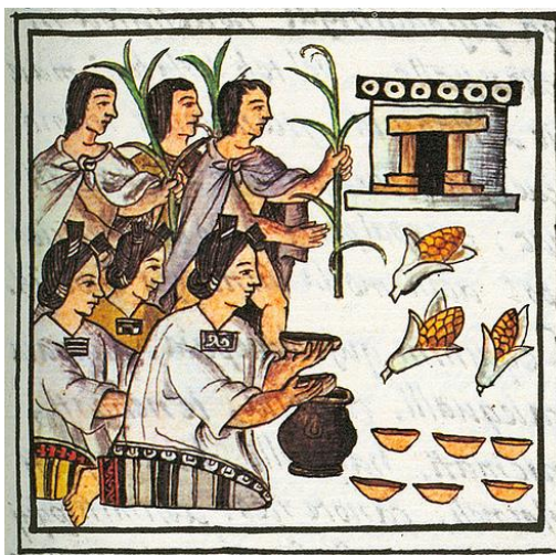
Slika 1. Obrada kukuruza kod starih Azteka (ilustracija)

Kukuruz ( Zeamays ) jednogodišnja je biljka iz porodice trava ( Poaceae ). Domovinom kukuruza smatra se Središnja Amerika, a u Europi i na drugim kontinentima se proširila nakon otkrića Amerike u 15. stoljeću. Na osnovu arheoloških nalaza i genetičkih istraživanja pradomovinom kukuruza smatra se Meksiko (Slika 1.). U prilog tome govori i podatak da je pelud kukuruza stara 80 000 godina pronađena na području današnjeg Meksika (Nikolić, 2013.). Postoje razna nagađanja o porijeklu jer divlji oblik kukuruza ne postoji. Prema literaturnim navodima (Hulina, 2011.) predak je jednogodišnja samonikla vrsta teosint ( Zeamaysssp. mexicana ). Kultiviran je 6 000 godina prije Krista (Mägdefrau i Ehrendorfer, 1997.).