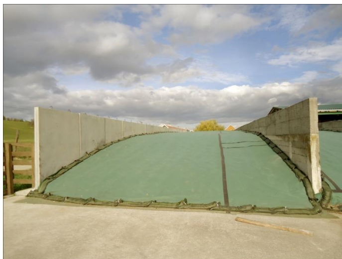
Slika 8. Pokriveni silos