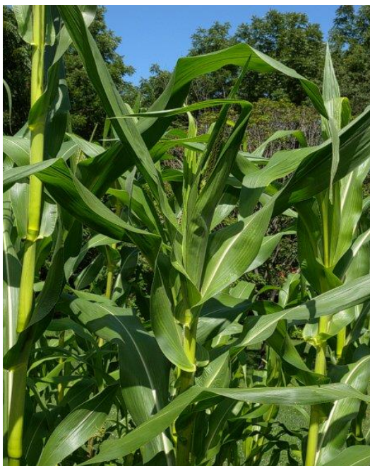
Slika 3. Pravi listovi kukuruza

Razlikuju se tri tipa lista kukuruza, a to su: klicini listovi, pravi ili listovi stabljike i listovi omotača klipa (komušina). Nakon formiranja pravih listova, klicini listovi većinom propadaju budući da gube značaj. Veći dio klicinih listova stoga se osuši u prvom dijelu vegetacije. Pravi listovi kukuruza nalaze se na stabljici (Slika 3.), a sastoje se od plojke, rukavca i jezička. Listovi omotača klipa (ili listovi „komušine“) razvijaju se na koljencima skraćenog bočnog izdanka odnosno na dršci klipa. Oni štite klip od nepovoljnih vanjskih utjecaja poput mraza, mehaničkog oštećenja, štetočina i bolesti (Kovačević i Rastija, 2013.).