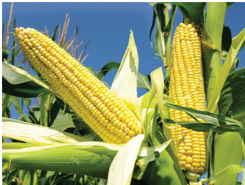
Slika 5. Plod kukuruza (zrno na klipu)

oko 7%, a klica 7-10% (Gagro, 1997.). Boja zrna može biti različita: crvena, prošarana prugama, narančasta, smeđa, bijela, a ponekad i bezbojna (Slika 5.). Zrno je osnovna sirovina u pripremi stočne hrane i bogato je ugljikohidratima, uljima i određenim mineralnim tvarima. U prehrani ljudi kukuruzno zrno se koristi za pripremu kruha, kokica i slično (Gagro, 1997.).