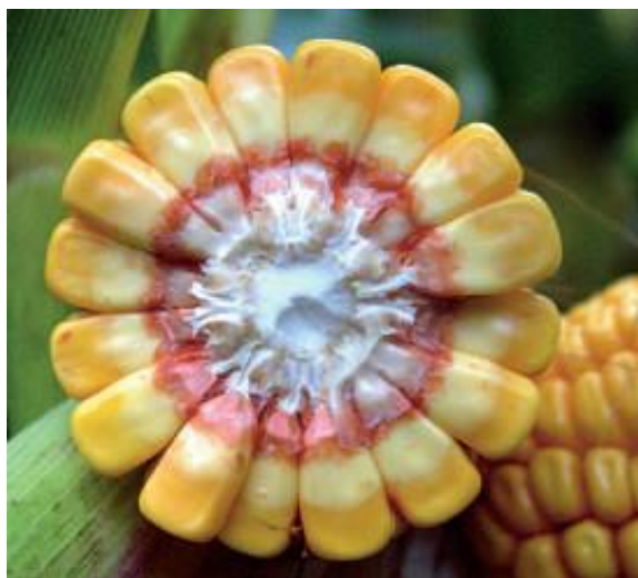
Slika 6. Mliječna linija zrna kukuruza