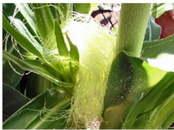
Slika 4. Muški i ženski cvat kukuruza