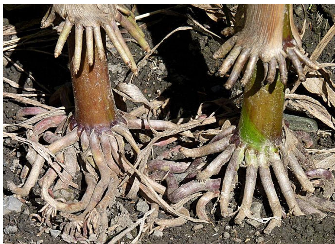
Slika 2. Zračno korijenje kukuruza

Sekundarno korijenje razvija se iz podzemnih i nekoliko nadzemnih nodija stabljike (Kovačević i Rastija, 2013.). Njegova je uloga pričvršćivanje i stabiliziranje biljke. Također, biljka kukuruza razvija i zračno korijenje(Slika 2.)koje raste iz nodija stabljike iznad površine tla. Ovo korijenje nosi naziv i nadzemno-nodijalno korijenje. Uloga je stabilizirati biljku; stabljika kukuruza raste visoko pa u slučaju vjetra ili jake kiše može doći do polijeganja stabljike. Kada vjetar puše u jednom pravcu, zračno nodijalno korijenje s jedne strane podupre, a s druge strane zategne stabljiku, čineći ju tako stabilnijom (Gagro, 1997.).