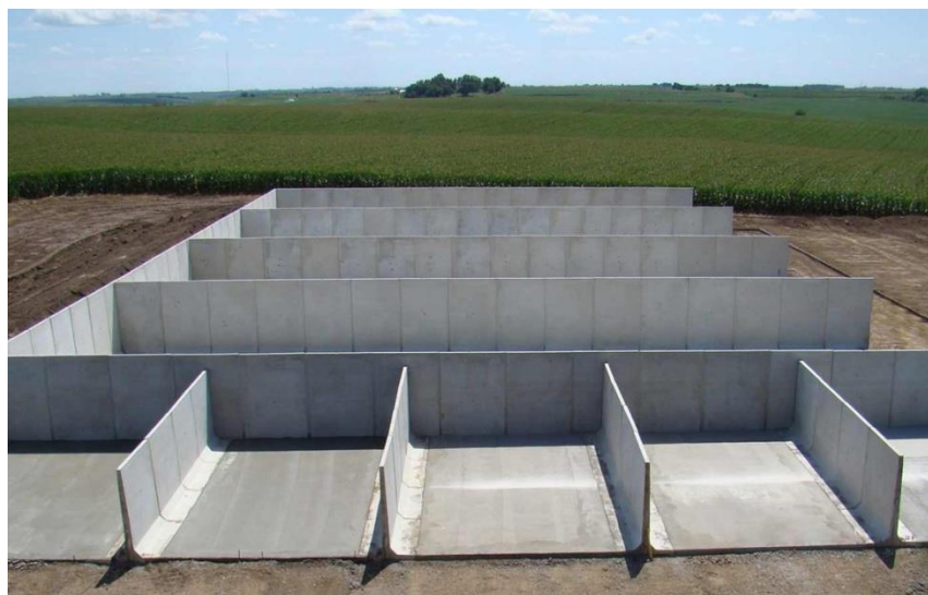
Slika 7. Trench silos

(Izvor: https://www.patiodrummond.com/en/store/precast-concrete/storage/silage-bunker/silage-bunker/ )