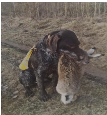
Slika 10. Aport (Al Dagistani, 2022.)