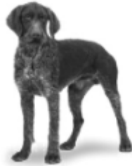
Slika 5. Psi brakoidnog tipa (Ristić, Matejević, 2016.)