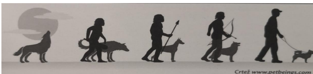
Slika 1. Povijest nastanka psa (Al Dagistani, 2022.)

Odmah nakon pripitomljavanja psa, čovjek je započeo sa njegovom selekcijom i prilagođavanjem, iz čega saznajemo da gotovo sve pasmine lovačkih pasa vode podrijetlo od istog pretka - psa tragača. Oni koriste svoje urođene sposobnosti kako bi nalazili divlju životinju po mirisu. Pas koji je tada stajao uz čovjeka, bio je iznimno pouzdan pomoćnik u lovu jer je nepogrešivo mogao da uradi ono što čovjeku nikada skoro nije polazilo za rukom, da slijedi i pronađe divljač. Psi su ustrajni i vrlo hrabri borci i to je dokazano ukoliko se čovjek nađe u opasnosti od divlje zvjeri. Lov je čovjeka i psa tako zbližio jer su se nadopunjavali (Al Dagistani, 2022.).