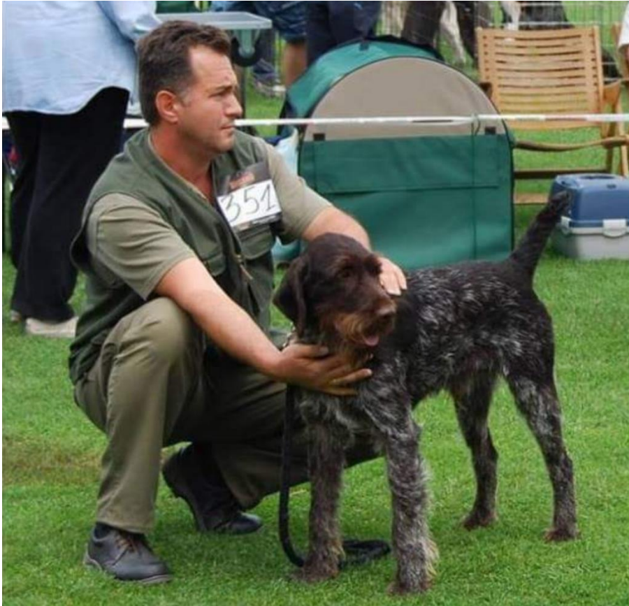
Slika 6. Njemački oštrodlaki ptičar