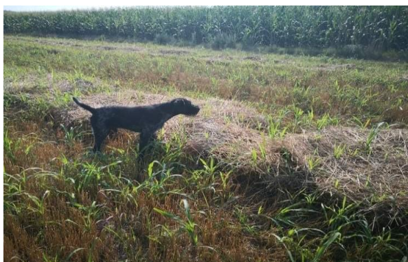
Slika 9. Markiranje