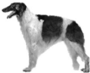
Slika 3. Psi graioidnog tipa (Ristić, Matejević, 2016.)