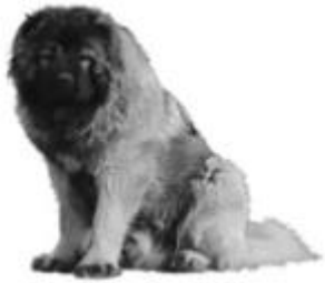
Slika 2. Psi molosoidnog tipa (Ristić, Matejević, 2016.)