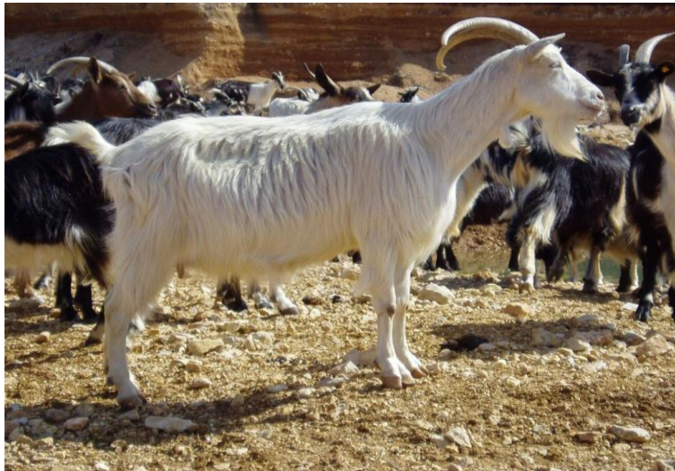
Slika 2. Prikaz hrvatske bijele koze