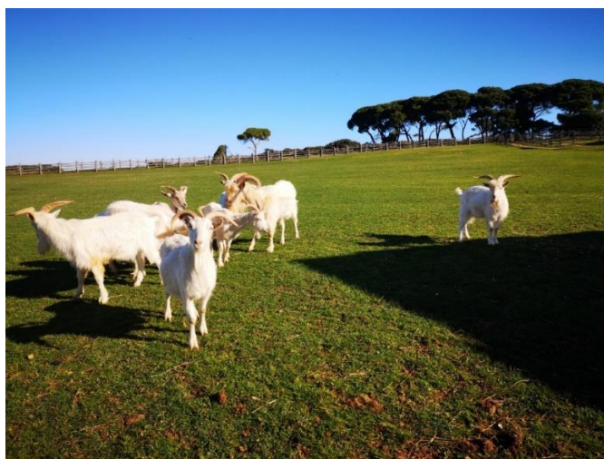
Slika 4. Prikaz stada istarske koze