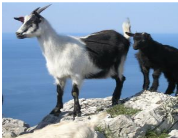
Slika 1. Prikaz hrvatske šarene koze

Navedena pasmina je, u odnosu na hrvatsku bijelu kozu, kasnozrela te se koze ove pasmine prvi put jare u dobi od 2 godine. Plodnost je u prosjeku 1,2 jareta po jarenju godišnje. Tjelesna masa jaradi pri rođenju je od 2,5 do 3 kg, dok sa navršениh tri mjeseca teže u prosjeku od 12 do 15 kg. Ova pasmina je izrazito niske mliječnosti koja se kreće od 100 do 400 l po laktaciji, a traje 7 do 8 mjeseci ( www.agroklub.hr ).