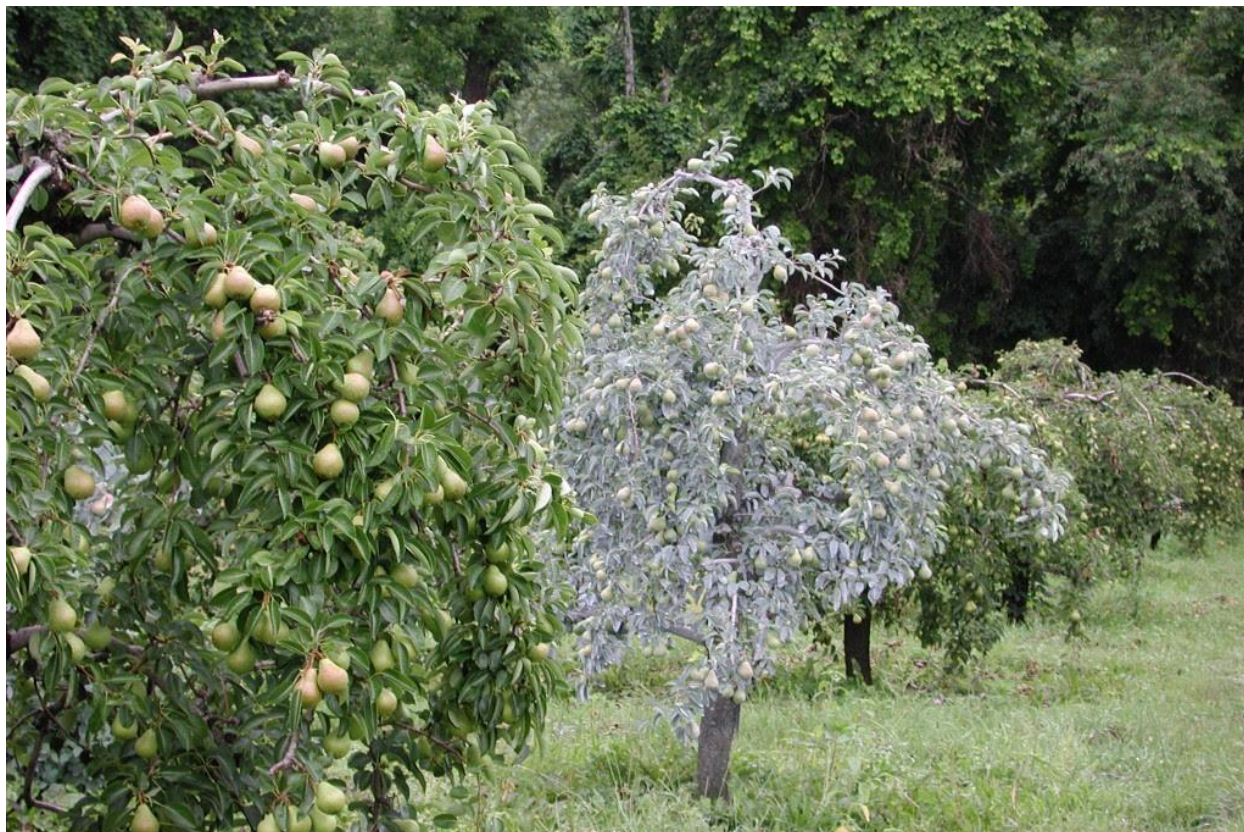
Slika 9. Stablo kruške tretirano kaolinskom glinom

Sugar i sur. (2005.) navode da na rast stabala i produktivnost kruške 'Doyenne du Comice' ('Comice') nisu utjecali programi tretiranja kaolinom (Slika 9.), a u 2 od 3 godine, programi tretiranja kaolinom smanjili su opseg mrežavosti na površini plodova.