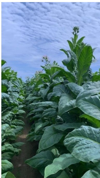
Slika 12. Virginiski tip duhana visine preko 200 cm i s preko 30 listova.