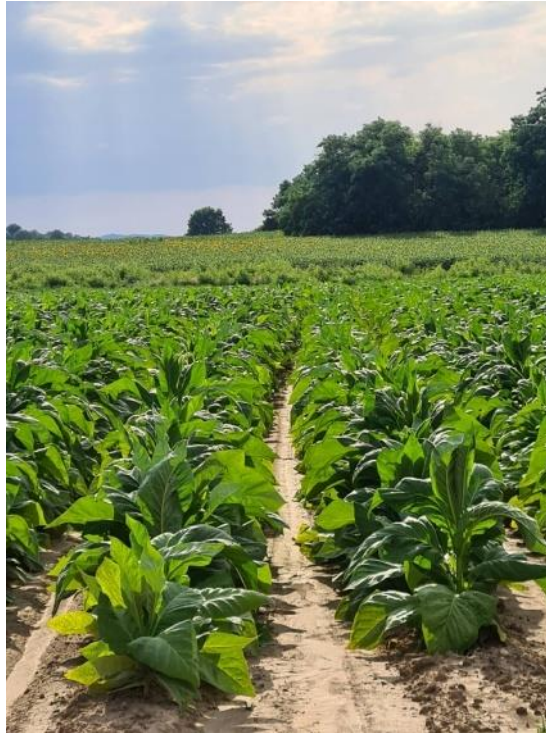
Slika 8. Valjkasti habitus