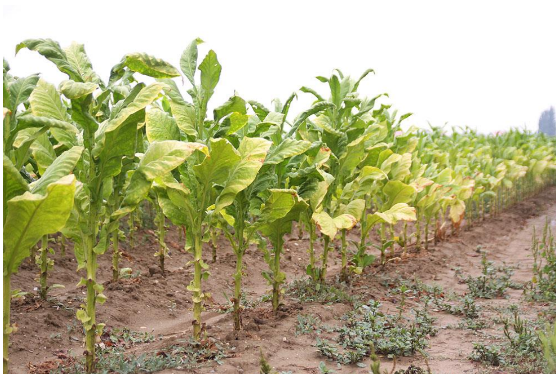
Slika 7. Stabljika duhana sorte burley, nodiji i internodiji

Duhan ima zeljastu i uspravnu stabljiku (Hulina, 2011.). U gornjem dijelu stabljika je razgranata, a u donjem drvenasta. Oblasla je sitnim žljezdanim dlačicama. Stabljiku još nazivamo i struk. Podijeljena je na nodije i internodije (Slika 7.). Dužina internodija ovisi o sorti. Selekcijom duhana nastojalo se razviti niži kultivar s kraćim internodijima i većim brojem listova. Stabljika naraste, ovisno o tipu duhana, ekološkim uvjetima i agrotehnici, između 0,5 i 3 m u visinu (Hulina, 2011.). Visina se mjeri od baze do vrha procvjetale biljke.