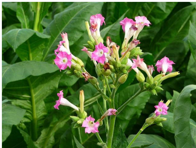
Slika 13. Poluloptasti cvat

Duhan cvjeta od srpnja do rujna. Cvjetovi duhana pojavljuju se pojedinačno na biljci, a mogu biti skupljeni u cvat štitac ili metlicu (Forenbacher, 1998., Hulina, 2011.). Cvat može biti loptast, heksagonalan, poluloptast i valjkast.