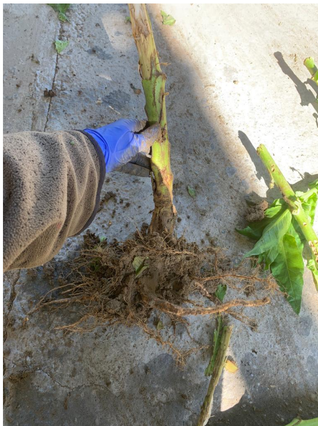
Slika 6. Korijen duhana

Korijen duhana je dvostran i vretenast (Butorac, 2020.) (Slika 6.). Prvo se formira glavni vretenast korijen koji nakon presađivanja duhana u polje puca, iz njega zatim izbija plitko postrno korijenje koje preuzima ulogu glavnog korijena. Ima srednju moć upijanja vode i hranjiva. Rasprostire se u dubinu do 80 cm i 1 m u širinu.