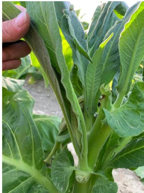
Slika 10. Zaperci

Nakon uklanjanja cvatnog vrha iz pazušaca listova mogu izbiti postrne grane (zaperci)(Beljo i Vuletić, 1990.). Pojava zaperaka je štetna. Zaperci koriste hranjiva i vodu za svoj razvoj, a razvoj glavnih listova za berbu oslabljuje. Zaperci se mogu razviti i u ranijoj fazi vegetacije, dok se na nekim biljkama ni ne pojave. Mogu se pojaviti u gornjem dijelu biljke, ali mogu se razviti i duž cijele biljke. Najčešće se razvijaju nakon raznih oštećenja listova u pazušcu (Slika 10.).