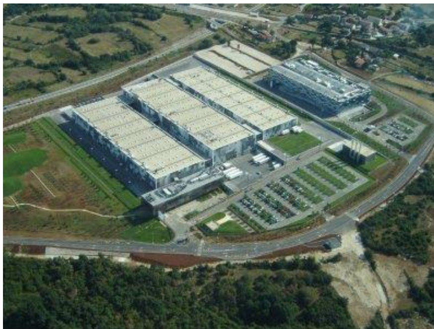
Slika 2. Suvremena tvornica duhana u Rovinju

Na prostorima naše domovine duhan se počeo uzgajati u 16.stoljeću.Godine 1571. uvedena je proizvodnja duhana na području đurđevačke regimente, a sjeme je bilo doneseno iz Italije. Odmah nakon oslobođenja Slavonije od Turaka duhan se počeo uzgajati u Baranji i Podravini, a izvezio se u Austriju, Njemačku i Italiju. U 18. stoljeću otvaraju se manufakture za preradu duhana u Zagrebu, Varaždinu i Rijeci. Godine 1860., sve tvornice u Hrvatskoj postaju državne. U Dalmaciji se duhan uzgajao na području Imotskog, Dubrovnika i Cavtata, uzgajale su se domaće sorte. Nakon 1960.godine na tom području interes za proizvodnju duhana opada, a danas se u Dalmaciji duhan više ne uzgaja.