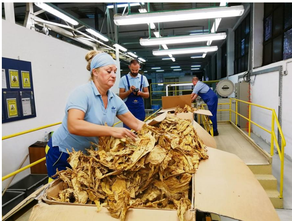
Slika 3. Otkup duhana u Virovitičkoj tvornici

U Zagrebu se osniva Institut 1954. godine koji uvodi proizvodnju duhana tipa virginia i burley, na području Podravine i Slavonije gdje se i danas uzgajaju ti tipovi. Prvo poduzeće za proizvodnju otkup i preradu duhana osnovano je u Slatini 1955. godine, nakon toga u Virovitici, Pitomači i tvornica u Rovinju (Slika 2.) (Butorac, 2020.).Ta poduzeća održala su se do danas, a u Virovitičko podravskoj županiji proizvodi se najveća količina duhana u Hrvatskoj (Slika 3.).