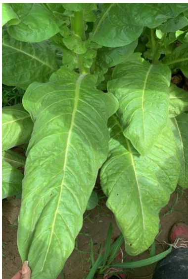
Slika 11. List virginijske sorte duhana

Baza lista može biti srcolika, okrugla, eliptična, s obraslom drškom i izraženim ušima. Vrh lista može biti vrlo zašiljen i izdužen, lagano zaobljen, s dugim istaknutim vrhom, s tupim vrhom, i zaobljenim vrhom. Površina kod lista duhana može biti ravna, malo naborana, smežurana, klobučasta i valovita.