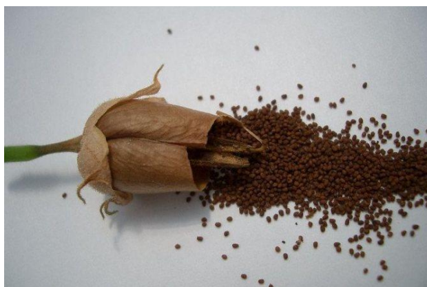
Slika 14. Plod i naturalno sjeme

Za proizvodnju presadnica vrlo je bitna kvaliteta sjemena. Krupnije sjeme brže klija, a razlike u nekoliko dana kod klijanja imaju veliku ulogu na daljnji razvoj biljke. Ako se pravilno i kvalitetno skladišti sjeme ono se može upotrebljavati i 5 do 7 godina nakon berbe. Sjeme treba skladištiti u odgovarajućem skladištu, uz sadržaj vlage od 5-6%, na temperaturi od -3 °C do -5 °C i pri relativnoj vlazi zraka od 10-12%.