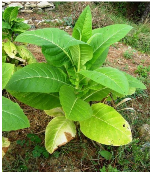
Slika 9. Elipsoidni habitus