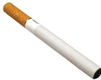
Slika 15. Cigareta

Duhanski proizvodi uglavnom su namijenjeni za uživanje. Zbog nikotina koji sadrži duhan, on ima stimulativan i blago narkotički učinak. Najrašireniji duhanski proizvod su cigarete , smotuljci duhana za pušenje obavijeni cigaretnim papirom (Slika 15.). Cigare rade se od cijelih listova duhana koji se ne omotavaju zaštitnim papirom već zaštitnim listom duhana (Slika 16.). Duhan za lule je rezan krupnije od onog za cigarete, mogu mu se dodavati različite arome i umaci. Duhan za žvakanje je uglavnom u kolutovima, u obliku štapića, kockama pripremljen za žvakanje, njega dobivamo od mesnatih i kožastih listova duhana koji se moče i dorađuju. Burmut takozvani duhan za šmrkanje osušen je i u prah samljeveni duhan uglavnom slabije kvalitete, ima veći sadržaj nikotina, i nije prikladan za pušenje (Đulančić, 2014.).