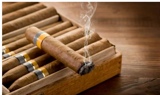
Slika 16. Cigara

Izvor: https://hr.wikipedia.org/wiki/Cigareta