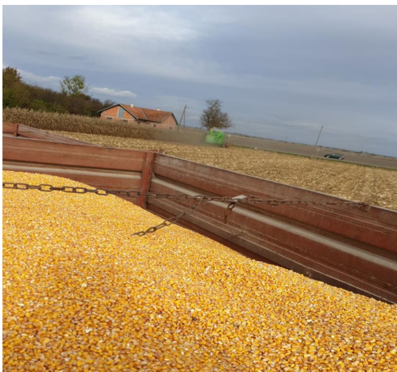
Slika 7. Žetva kukuruza

Žetva kukuruza za zrno (Slika 7.) se obavlja kada je vlaga zrna ispod 20 %. Pošto OPG ne posjeduje vlastiti kombajn za vršidbu kukuruza u zrnu, žetvu obavlja obiteljski prijatelj iz mjesta koji posjeduje vlastiti kombajn Deutzh Fahr TopLiner 4068 HTS i vrši uslužnu djelatnost žetve raznih kultura.