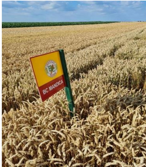
Slika 15. Bc Mandica