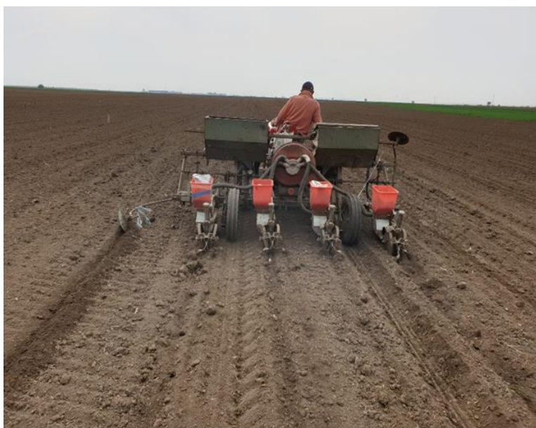
Slika 3. Sjetva kukuruza

Na OPG-u se siju isključivo hibridi kukuruza Bc Instituta radi njihovog dobrog prinosa i u nepovoljnim godinama, ali i zbog toga što OPG ima odličnu saradnju sa sjemenarskom kućom iz Zagreba. Rezultat višegodišnje suradnje je i povećanje količine sjemena hibrida, koju OPG dobije za sjetvu pokusa. S ostatkom sjetvenog materijala OPG uspije posijati preostale parcele na kojima se uzgaja kukuruz u toj vegetacijskoj godini.