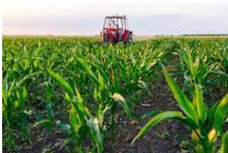
Slika 6. Međuredna kultivacija kukuruza

Međuredna kultivacija (Slika 6.) je agrotehnička mjera kojom razbijamo pokoricu tla i uništavamo novo iznikle korove. Ova agrotehnička mjera ima izuzetnu važnost, posebno u sušnim godinama, jer sprječava gubitak vlage iz tla te poboljšava uvjete za zrak i mikroorganizme u tlu. Također, međurednom kultivacijom se unose mineralna gnojiva u tlo, što igra ključnu ulogu u poticanju rasta i razvoja kukuruza (Lazić, 1990.).