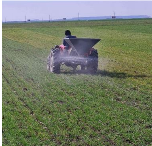
Slika 10. Prva prihrane pšenice

Druga se obavlja tijekom fenološke faze vlatanja s KAN-om u iznosu od 185 kg/ha. Treća, ujedno i završna prihrana 2020. i 2021. godine obavljena je folijarnim putem s tekućim mikrobiološkim gnojivom Slavol (Slika 11.) u dozi od 7 l/ha. 2022. godine je izmijenjena završna prihrana odnosno treća koja se ove godine nije izvodila sa Slavolom, nego sa mineralnim gnojivom Mortonijc Plus, namijenjenom za folijarnu prihranu. Mortonijc Plus (Slika 12.) primjenjuje se u fenološkoj fazi klasanja u kombinaciji sa sredstvima za zaštitu bilja u dozi od 3 kg/ha.