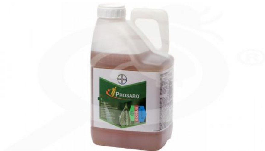
Slika 18. Prosaro 250 EC

spriječili pojavu paleži klasa, na gospodarstvu su početkom klasanja preventivno primjenili već provjereni fungicid Prosaro 250 EC (Slika 18.). Navedeni fungicid ima kontaktno i sistemsko djelovanje protiv pojave paleži klasa, a primjenjuje se u dozi od 0,75 – 1 l/ha.