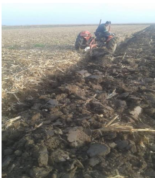
Slika 8. Osnovna obrada tla

Prije sjetve pšenice, gospodarstvo na svojim parcelama provodi osnovnu obradu tla pri čemu se strogo pridržavaju pravila plodoreda. Budući da se pšenica sije nakon dva različita predusjeva (soja i kukuruz), postoje manje vremenske razlike prilikom izvođenja osnovne obrade. Međutim, način osnovne obrade tla i predsjetvene pripreme tla za sjetvu pšenice se već godinama ne mijenja. OPG je osnovnu obradu, odnosno oranje (Slika 8.) izvršilo vlastitim traktorima IMT 539 i IMT 565 i plugovima IMT 757.2 i Slavonac na dubini od 25 do 30 cm (oranični sloj).