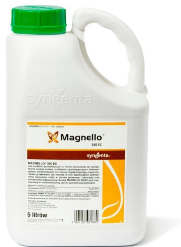
Slika 19. Magnello (fungicid)