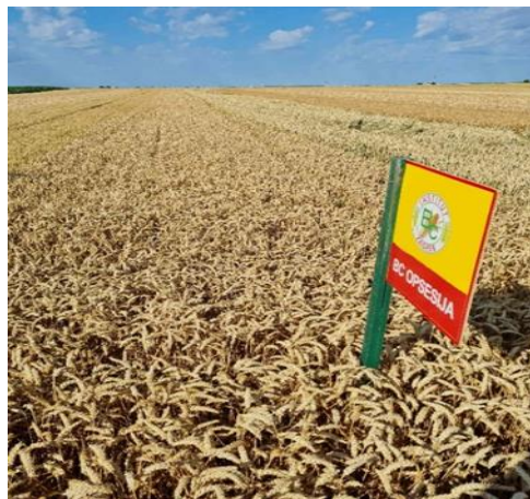
Slika 14. Bc Opsesija

Bc Opsesiju karakterizira srednje rana vegetacija i visina od 80 do 85 cm. Ima visoku otpornost na polijeganje, što je jasno vidljivo na Slici 14. Preporučeno vrijeme sjetve je od 15.10. do 25.10., s preporučenom normom sjetve od 650 do 700 kljavih zrna po kvadratnom metru i količinom sjemena za sjetvu od 280 do 300 kg po hektaru. Prema trogodišnjem prosjeku, ova sorta može postići prinos od otprilike 8,65 tona po hektaru, s sadržajem proteina u rasponu od 12,1 do 14,2% i hektolitarskom masom između 80 i 84 kg po hektolitru ( www.bc-institut ).