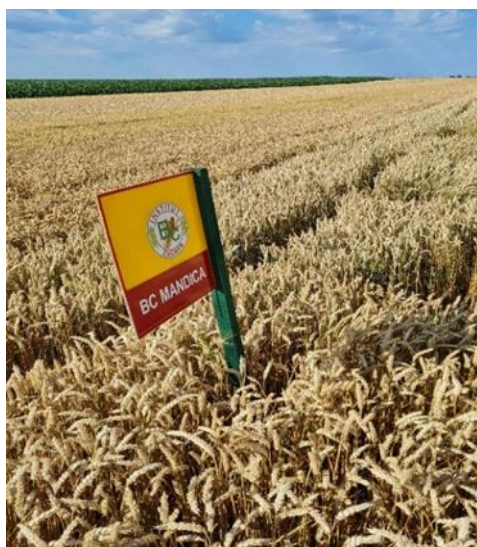
Slika 15. Bc Mandica