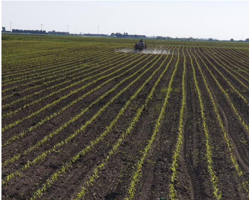
Slika 4. Zaštita kukuruza na OPG-u kemijski putem

Na parceli Rogač osim Adenga primjenjuje se i Principal Plus (Slika 5.) u koncentraciji 440 g/ha u kombinaciji sa Kalimba u dozi od 0,6 l/ha. Primjena navedene kombinacije je 2020. godine obavljena 12. svibnja, 2021. godine 17. svibnja, a 2022. godine 22. svibnja. Principal Plus je kombinirani herbicid s sistemskim djelovanjem koji sadrži tri najvažnije aktivne tvari (nikosulfuron, rimsulfuron i dikambu) u jednom proizvodu. Ovo omogućuje učinkovito suzbijanje svih najvažnijih jednogodišnjih i višegodišnjih uskolisnih i širokolisnih korova u kukuruzu za zrno i silažu. Prvi znakovi odumiranja korova postaju vidljivi nakon 7 dana, a potpuno odumiranje slijedi nakon 14 dana. Važno je napomenuti da toplije i vlažnije vrijeme nakon primjene herbicida ubrzava njegovo djelovanje.