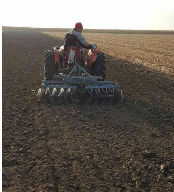
Slika 9. Predsjetvena priprema tla za sjetvu tanjuranjem

Neposredno prije sjetve, obavlja se i dopunska obrada tla tj. priprema tla za sjetvu (Slika 9.). Dopunska obrada obavljena je tanjuranjem tanjuračama OLT (20 i 24 diska) i traktorima IMT 565 i IMT 539 u tri prohoda, kako bi što bolje usitnili tlo i gromade koje su se stvorile prilikom oranja.