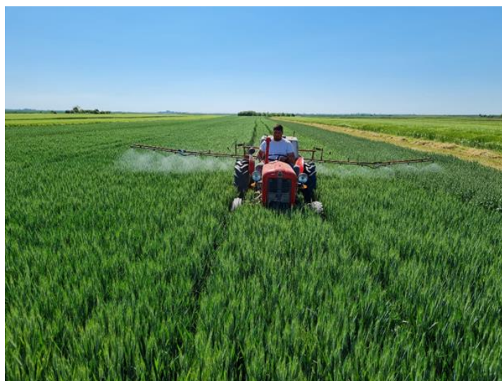
Slika 16. Zaštita pšenice na OPG-u

Zaštita usjeva 2021. godine počela je nastupom toplijih dana, kada pšenica nastavlja s rastom, a kako bi se nesmetano razvijala potrebno je obaviti tretiranje usjeva protiv korova. Na OPG-u su se ove godine za zaštitu usjeva od korova odlučili koristiti herbicidom po imenu Mustang. Mustang (Slika 17.) je kombinirani sistemski herbicid za suzbijanje sjemenskih širokolisnih korova u ozimoj i jaroj pšenici. Primjenjuje se u dozi od 0,4 – 0,6 l/ha i to u proljeće od početka busanja do pojave prvog koljenca (Agrochem maks d.o.o.)