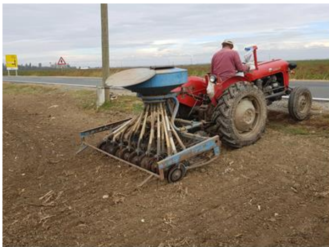
Slika 13. Sjetva pšenice

Sjetva pšenice za vegetacijsku sezonu 2021. godine je zbog loših vremenskih prilika obavljena izvan granica optimalnog roka. Prvo je obavljena sjetva na najvećoj parceli Žitna tabla 1 (2,09 ha) na kojoj je predusjev bila soja. Ovoga puta, na gospodarstvu su odlučili posijati samo jednu sortu i to Bc Opsesiju koja je bila najrodnija sorta prethodne godine na pokusima u količini od 300 kg/ha. Sjetva je obavljena 28. listopada 2021. godine, a par dana kasnije (03. studenog) posijane su i preostale parcele. Najprije su na parceli Rogač posijali pokuse sjemenarske kuće Bc Institut iz Zagreba s 5 sorata pšenice (Bc Anica, Bc Darija, Bc Ljepotica, Bc Opsesija, Bc Mandica), pridržavajući se sjetvene norme koju propisuju proizvođači. Preostale parcele su posijane s ostatkom sjemena sorti koje su namjenjene za makropokuse.