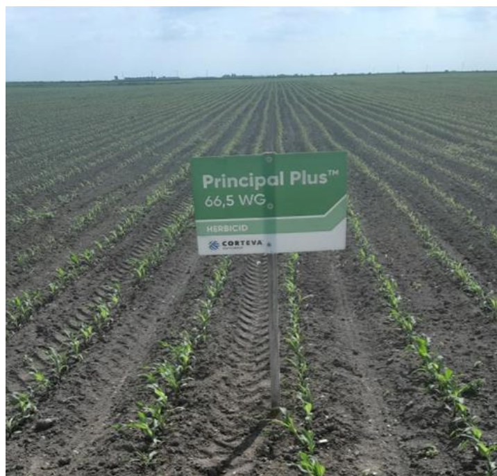
Slika 5. Parcela Rogač na kojoj je primijenjen Principal Plus