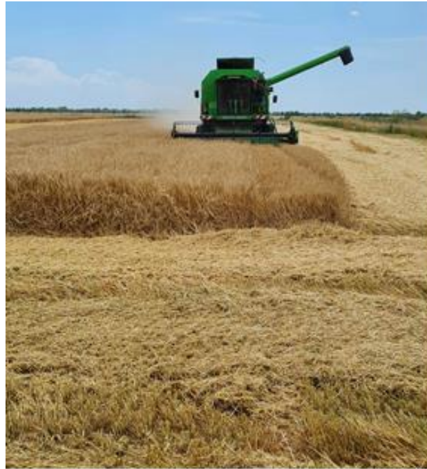
Slika 20. Žetva pšenice

Žetva pšenice 2021. godine obavljena je u tehnološkoj zriobi, pri vlazi manjoj od 14 % (standard). Prvo je 13. srpnja obavljena žetva na parceli Rogač uz javno vaganje i proglašenje najrodnije sorte za 2021. godine na osnovu makropokusa postavljenih a pobjednik 2021. godine bila je sorta Bc Anica. Žetva na ostalim parcelama je obavljena 14. srpnja uz prosječnu vlagu koja je iznosila 12 %.