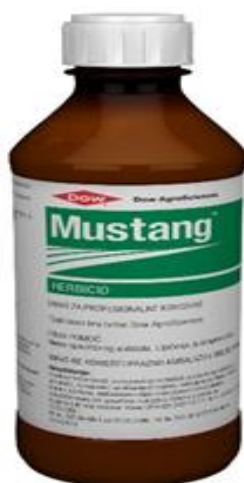
Slika 17. Mustang (herbicid)

Zaštita usjeva 2021. godine počela je nastupom toplijih dana, kada pšenica nastavlja s rastom, a kako bi se nesmetano razvijala potrebno je obaviti tretiranje usjeva protiv korova. Na OPG-u su se ove godine za zaštitu usjeva od korova odlučili koristiti herbicidom po imenu Mustang. Mustang (Slika 17.) je kombinirani sistemski herbicid za suzbijanje sjemenskih širokolisnih korova u ozimoj i jaroj pšenici. Primjenjuje se u dozi od 0,4 – 0,6 l/ha i to u proljeće od početka busanja do pojave prvog koljenca (Agrochem maks d.o.o.)