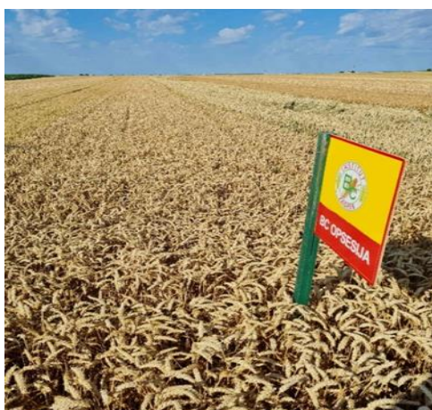
Slika 14. Bc Opsesija

Bc Opsesiju karakterizira srednje rana vegetacija i visina od 80 do 85 cm. Ima visoku otpornost na polijeganje, što je jasno vidljivo na Slici 14. Preporučeno vrijeme sjetve je od 15.10. do 25.10., s preporučenom normom sjetve od 650 do 700 kljavih zrna po kvadratnom metru i količinom sjemena za sjetvu od 280 do 300 kg po hektaru. Prema trogodišnjem prosjeku, ova sorta može postići prinos od otprilike 8,65 tona po hektaru, s sadržajem proteina u rasponu od 12,1 do 14,2% i hektolitarskom masom između 80 i 84 kg po hektolitr (www.bc-institut).