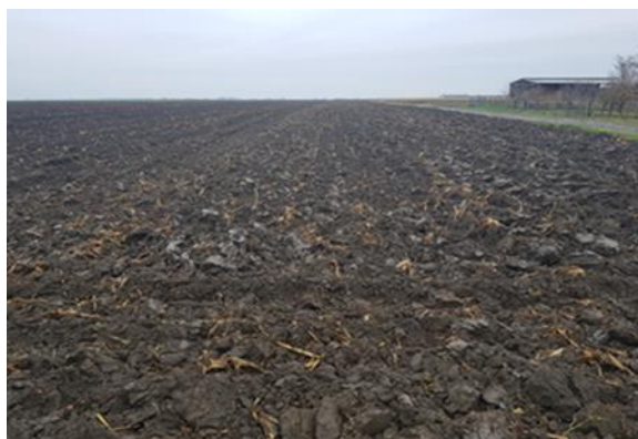
Slika 1. Zimska brazda

Osnovna obrada tla za uzgoj kukuruza na OPG-u se provodi u dva navrata: ljetno i zimsko oranje tj. ljetna i zimska brazda. Ljetna se obavlja u 7. mjesecu nakon žetve pšenice (ili druge strne predkulture) koja je najčešći predusjev na OPG-u. Zimska (Slika 1.) se obavlja najčešće u 10. i 11. mjesecu na dubini od 30-35 cm traktorima IMT 565 i IMT 539 te plugom IMT 757.2 sa dvije brazde koji ima pune daske i plugom Slavonac koji se za potrebe zimskog oranja smanji na jednu brazdu. Tla na OPG-u nisu teška za obradu, stoga je i moguće oranje na toliku dubinu. Zimsko oranje se u sve tri analizirane godine provodilo u razdoblju od 20. listopada do 15. studenog. Nakon oranja u proljeće kada vrijeme dozvoli zatvara se promrzla brazda sa 4-krilnom drljačom i traktorom IMT 565.