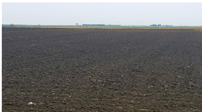
Slika 2. Pripremljeno tlo sjetvospremačem

U proljeće se obavlja predsjetvena priprema (Slika 2.) u jednom proходу sa sjetvospremačem radnog zahvata 2 parna valjka i traktorom IMT 539.