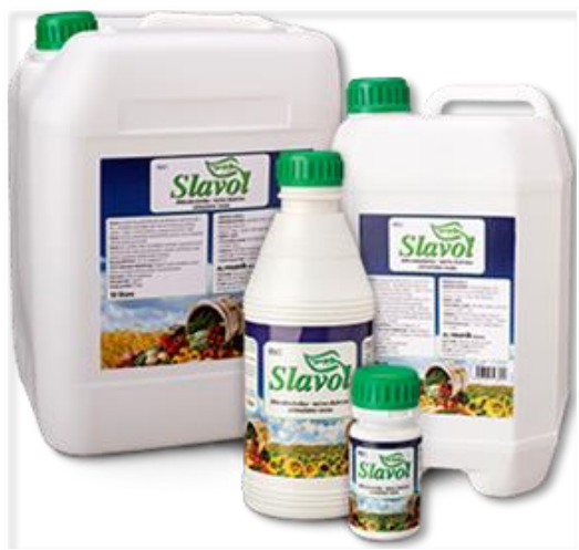
Slika 11. Slavol

Druga se obavlja tijekom fenološke faze vlatanja s KAN-om u iznosu od 185 kg/ha. Treća, ujedno i završna prihrana 2020. i 2021. godine obavljena je folijarnim putem s tekućim mikrobiološkim gnojivom Slavol (Slika 11.) u dozi od 7 l/ha. 2022. godine je izmijenjena završna prihrana odnosno treća koja se ove godine nije izvodila sa Slavolom, nego sa mineralnim gnojivom Mortonijc Plus, namijenjenom za folijarnu prihranu. Mortonijc Plus (Slika 12.) primjenjuje se u fenološkoj fazi klasanja u kombinaciji sa sredstvima za zaštitu bilja u dozi od 3 kg/ha.