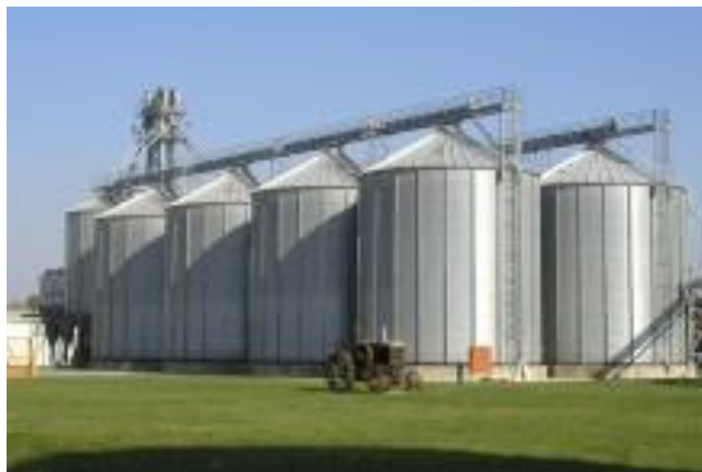
Slika 2. Silosi

Silos, koji se smatraju najmodernijim tipom skladišta za zrnate proizvode. Većina današnjih silosa ima kompletnu mehanizaciju za transport proizvoda, automatsko upravljanje i gotovo stalnu kontrolu proizvoda. Moderni silosi grade se u kompleksima, a često imaju i sušare.