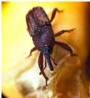
Slika 5. Kukuruzni žižak

Sitophilus zeamais (Motsch.) - kukuruzni žižak