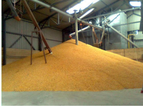
Slika 1. Podno skladište