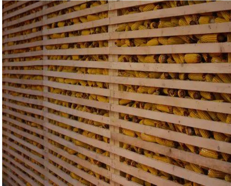
Slika 3. Koševi za kukuruz