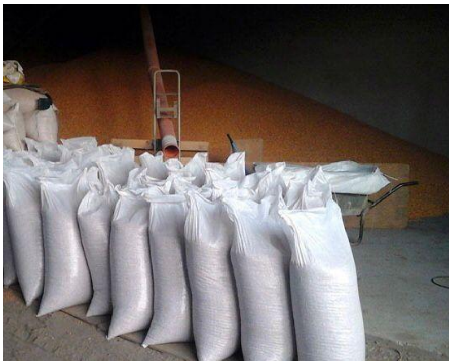
Slika 4. Podno skladište na OPG-u Ante Ivanika