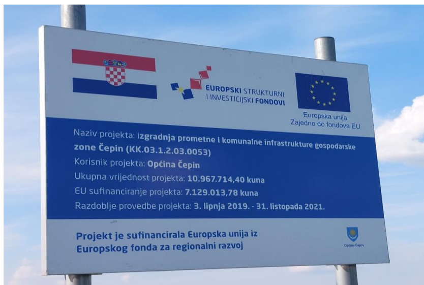
Slika 4. Plakat za izgradnju prometne i komunalne infrastrukture gospodarske zone Čepin

skladištenje na području općine Čepin u cilju osiguranja kvalitetnog prostora za odvijanje i povećanje poslovne aktivnosti na predmetnom području (cepin.hr).