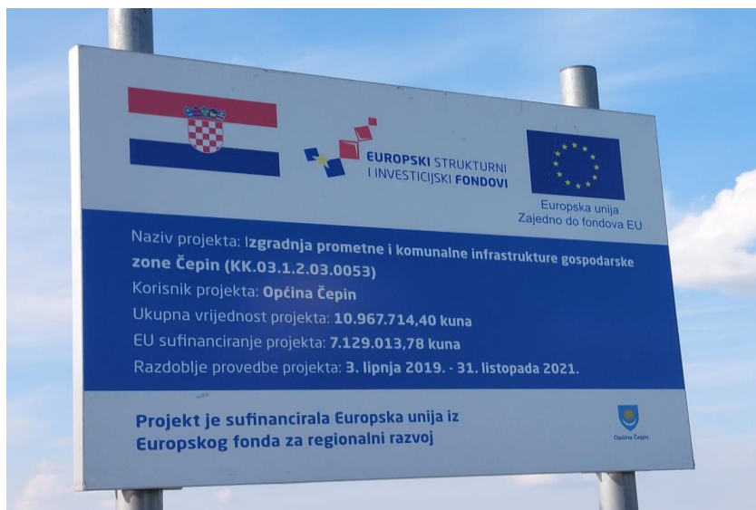
Slika 4. Plakat za izgradnju prometne i komunalne infrastrukture gospodarske zone Čepin

skladištenje na području općine Čepin u cilju osiguranja kvalitetnog prostora za odvijanje i povećanje poslovne aktivnosti na predmetnom području (cepin.hr).