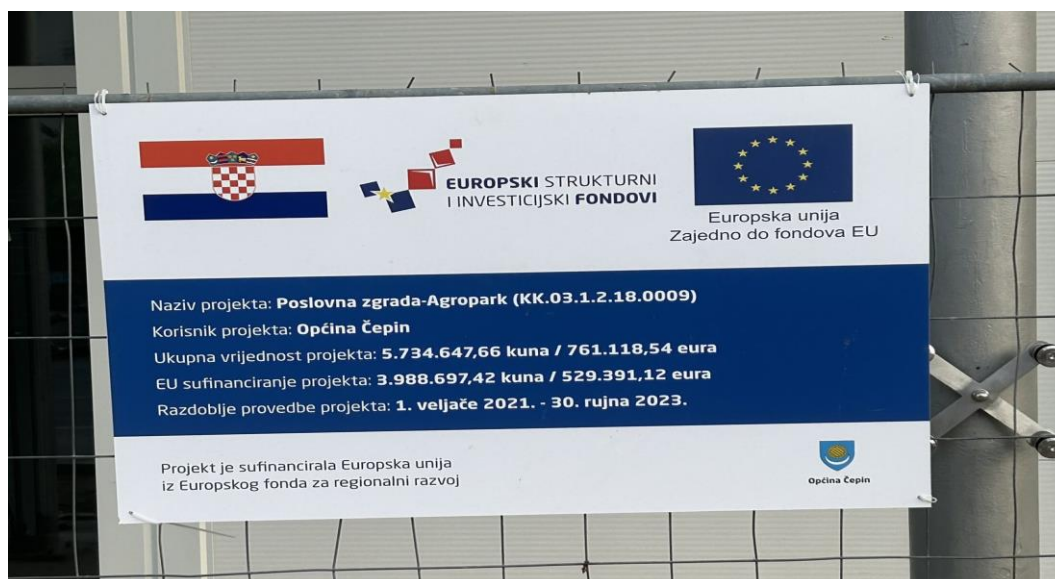
Slika 5. Plakat za poslovnu zgradu-Agropark

Projekt je sufinanciran iz Europskog fonda za regionalni razvoj i to na način da Europska unija sudjeluje u iznosu od 70%, dok je ostatak od 30% sufinanciran sredstvima Općine Čepin. Uz radove izgradnje, projektom Poslovna zgrada-Agropark obuhvaćeno je i opremanje Agroparka te ostali popratni troškovi. Poslovna zgrada Agroparka će sadržavati izložbeno-prodajni prostor gdje će se nalaziti štandovi, a sastoji se od 1 natkrivenog prostora od 211,32 m 2 , te dva zatvorena prostora – 15,89 m 2 i 16,36 m 2 , sanitarnog čvora i skladišta. Ukupna površina iznosi 350 m 2 (cepin.hr).