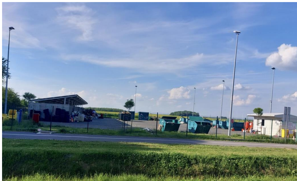
Slika 2. Prikaz reciklažnog dvorišta u Općini Čepin

Cilj projekta je stvoriti uvjete za recikliranje razvrstanog otpada iz mješovitog otpada kako bi osigurali održivo gospodarenje otpadom. Specifični cilj projekta je smanjiti mješoviti otpad koji se odlaže na različitim mjestima u Općini Čepin te podići svijest o štetnosti stakleničkih plinova i utjecaju divljih deponija na podzemne pitke vode.