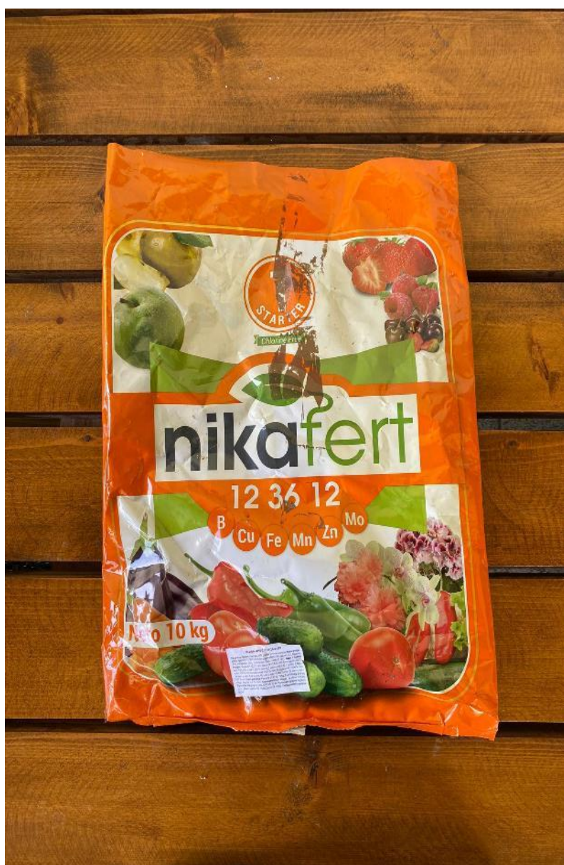
Slika 19. Nikafert, sredstvo za prihranu nakon berbe ploda

Nikafert 20-20-20 je gnojivo koje također koristimo u prihrani bilja, visoko je kvalitetno i daje dobre rezultate. Inače je Novalon sredstvo koje se koristi na OPG-u Ciboci, no zbog nestašice gnojiva, OPG je bio primoran promijeniti gnojivo. Rezultati su bili vidljivi vrlo brzo kao i nakon primjene Novalon gnojiva. Nakon berbe višanja, prihrana je bila odrađena is a ovim gnojivom u formulaciji 12-36-12 (Slika 19.).