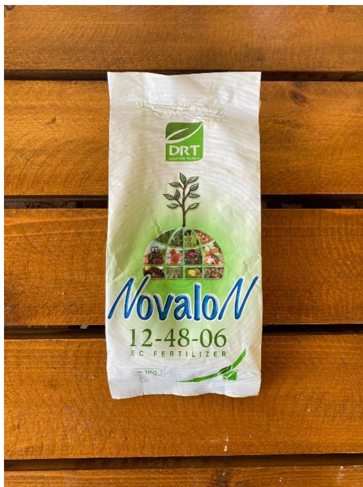
Slika 18. Novalon, sredstvo prihrane

Novalon u formulaciji 20-20-20 je vrlo pogodan za rast i razvoj biljke. Vrsta je hraniva (prihrane) koju možemo koristiti nekoliko puta kroz godinu kako bi poboljšali rast, kvalitetu i izgled biljke. Vrsta je folijarnog gnojiva i primjenjuje se u koncentraciji 0,3-0,8 %. Na OPG-u Ciboci mjera prihrane provedena je nekoliko puta. Prva je bila 5. svibnja, zatim 10. lipnja. Treći put je provedena prihrana ali u formulaciji 12-48-06 (Slika 18.) nekoliko dana nakon berbe višanja (25. lipnja).