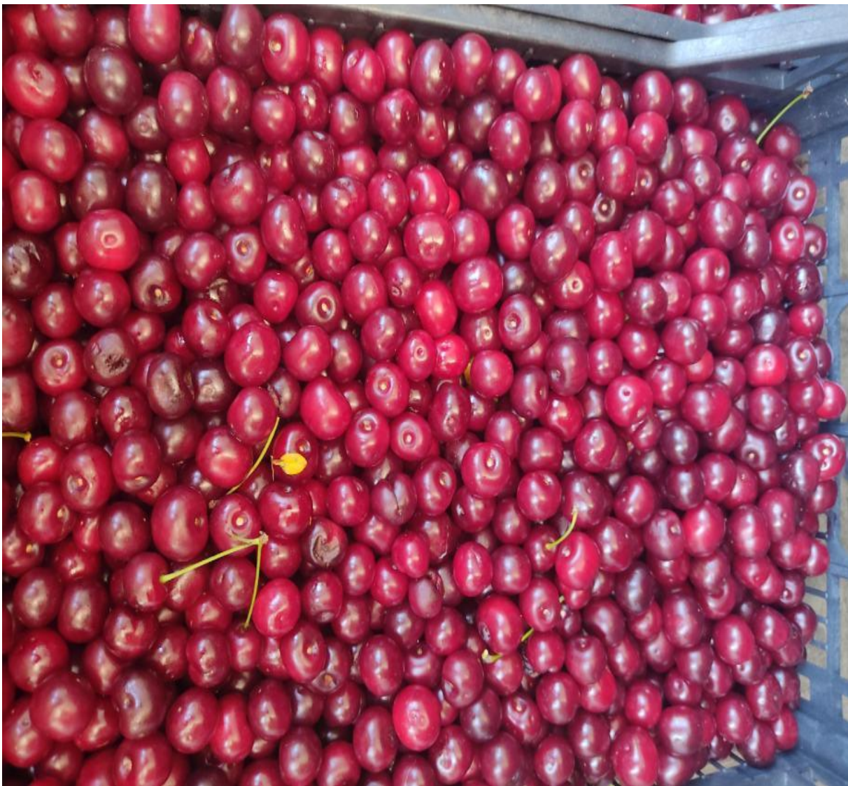
Slika 6. Svježa višnja

višanja izvozi se u svježem ili smrznutom stanju, dok se znatno manje izvozi kao polupreradevine (Slika 6.).