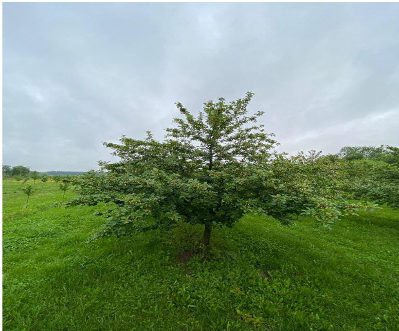
Slika 1. Stablo višnje

Višnja je drvo koje može doseći visinu do 6 metara i ima ravno stablo sa visećim granama (Hulina, 2011.) (Slika 1.).