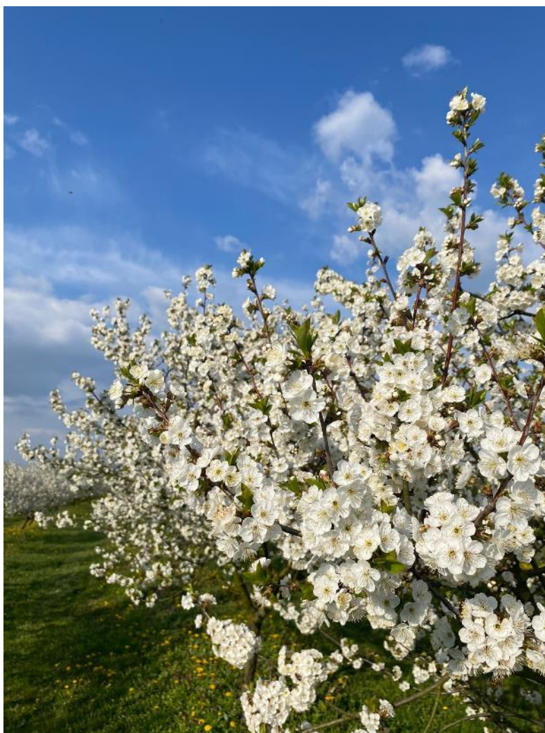
Slika 3. Cvijet višnje

Višnja razvija cvjetove koji su pravilni i dvospolni, što znači da se u istom cvijetu nalaze muški i ženski reproduktivni organi. Cvjetovi su bijeli i sastoje se od pet latica, koje se nalaze na dugim i tankim stapkama. Ovi cvjetovi grupiraju se u grozdove (gronja) (Hulina, 2011; Nikolić i Kovačić, 2008). Na dnu svakog cvijeta nalaze se ljuskice koje podsjećaju na listiće. Višnja cvjeta tijekom ožujka i travnja, što se poklapa s razdobljem listanja (Bačić i Sabo, 2007). Nektar koji cvijet proizvodi privlači pčele i druge insekte. Cvjetovi se obično otvaraju rano ujutro (Slika 3.) (Bučar, 2008.).