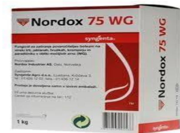
Slika 11. Fungicid Nordox 75 WG

Krajem drugog mjeseca potrebno je višnje zaštititi fungicidom kako bi se smanjile gljivične bolesti i infekcije. Točnije, na OPG-u Ciboci provedena je zaštita nasada sa sredstvom “Nordox 75 WG” (Slika 11.).