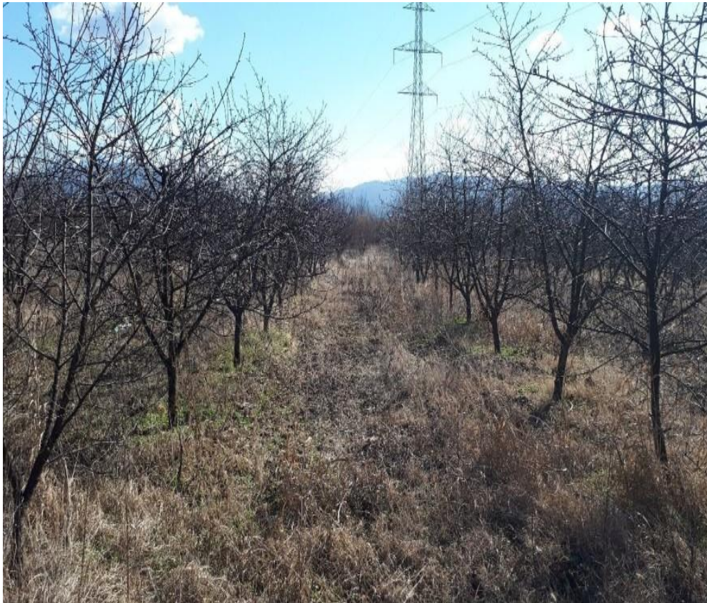
Slika 9. Nasad višanja