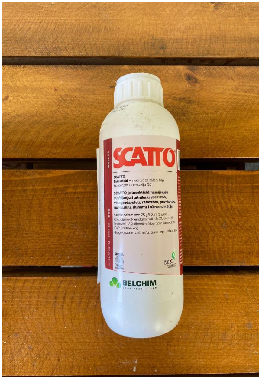
Slika 14. Sredstvo za zaštitu od moljca

Scatto je insekticid koji štiti biljke od napada moljca (Slika 14.). Koncentrat je za emulziju (EC). Primjenjuje se na višnjama u trenutku kada plodovi krenu poprimiti rumenu boju. Datumski bi to bilo početkom svibnja. Zaštita je provedena 8. svibnja. Primjenjuje se 500 g/ha.