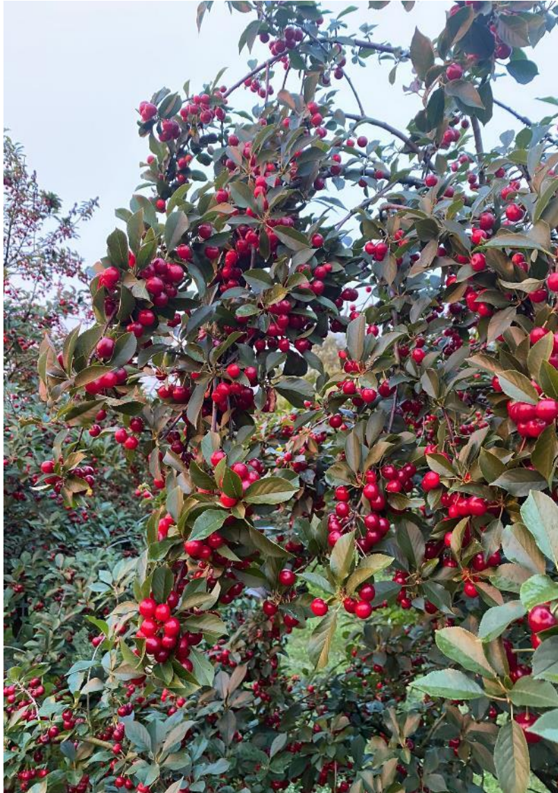
Slika 4. Plod višnje

Plod višnje je okrugla koštunica koja ima crveno-crnu boju, te je obilježena kiselkastim okusom (Hulina, 2011.). Vanjski sloj ploda, poznat kao sočni sloj, je sočan, dok je unutarnji sloj, endokarp, tvrd i sadrži jedno sjeme (Mägdefrau i Ehrendorfer, 1997.). Veličina plodova varira i ovisi o sorti; mogu biti manji ili veći (Cincović i sur., 1977.). Plod ima udubinu na bazi s peteljkom, koja se proteže od 25 do 40 mm (Slika 4.).