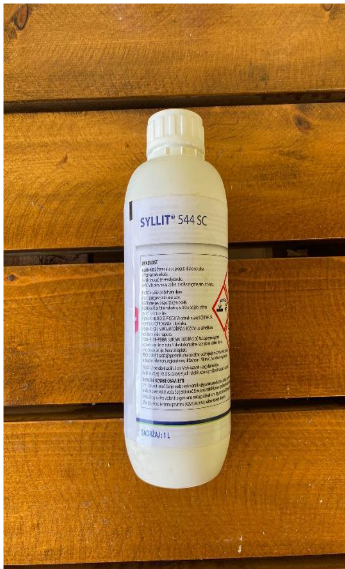
Slika 7. Syllit 544 SC sredstvo protiv biljnih bolesti

Sredstvo koje učinkovito suzbija biljne bolesti u voćarstvu je “Syllit 544 SC” (Slika 13.). Na OPG-u Ciboci je 4. svibnja nasad tertian upravo tim sredstvom. Sredstvo se primjenjuje u razdoblju kada su povoljni uvjeti za razvoj bolesti. Syllit sprječava ili značajno umanjuje mogućnost pojave kozičavosti te uvijanja i sušenja lista. Način pripreme je 1 l sredstva na 300 l vode. Također, potrebno je bilo ponoviti postupak 19. svibnja kako bi sredstvo imalo značajniji učinak.