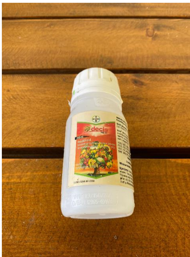
Slika 17. Sredstvo za zaštitu od trešnjine muhe

Decis je kontaktno-želučani insekticid koji služi za suzbijanje štetnika na brojnim kulturama (Slika 17.). U posljednje vrijeme, trešnjina muha je veliki problem kod koštićavog voća. Neuglednog je izgleda i teško je procijeniti imamo li je ili nemamo u višnjiku. Pomoću feromonskih klopki možemo ustanoviti imamo li trešnjinu muhu. Muha nije direktan štetnik na plodu, no jajašca iz kojih izlaze crvi su znatno veći problem. Većina otkuplivača odbija otkupiti višnju koja je “zaražena” crvima od trešnjine muhe. Stoga je vrlo važno voditi evidenciju i na temelju samo jedne muhe na feromonskim mamcima, obavezno provesti zaštitu kako bi suzbili razmnožavanje i pojavu trešnjine muhe u nasadu. Gledajući kalendarski, muha se pojavljuje u lipnju, stoga je zaštita na OPG-u Ciboci provedena 8. lipnja kada je muha prvi put primjećena. Postupak zaštite je ponovljen 12.6. zbog intenziviranog razvoja trešnjine muhe. Nakon druge primjene, značajno se smanjila pojava muhe.