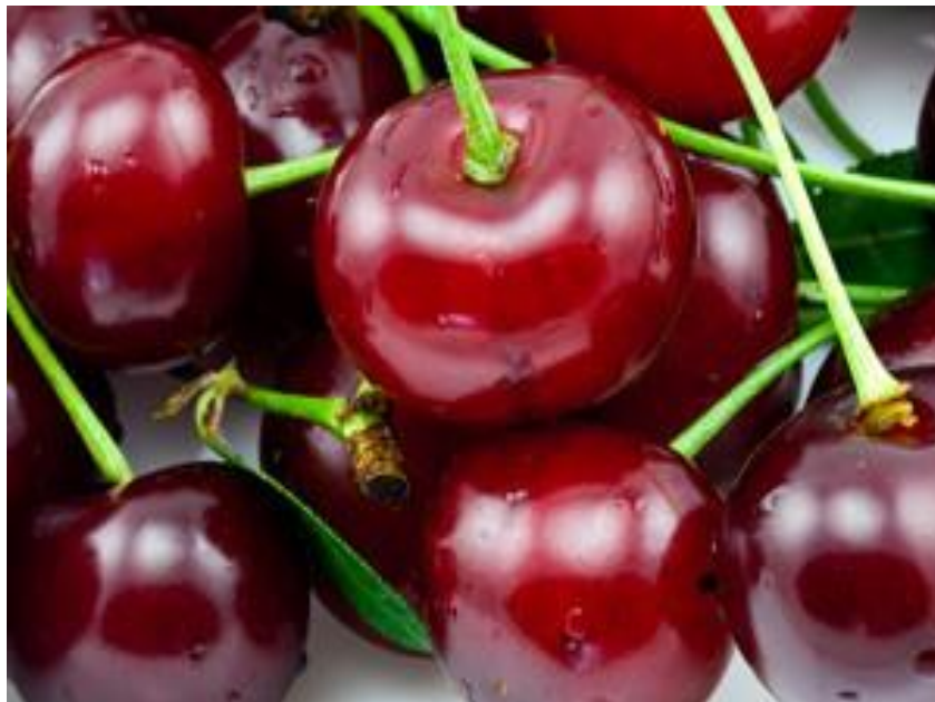
Slika 8. Maraska višnja

Maraska: Autohtona je hrvatska sorta koja se uzgaja u Dalmaciji, posebno na području od Zadra do Makarske, uključujući otoke Hvar i Brač. Sorta je srednje bujna i unutar nje postoje različiti tipovi rasta i genetske konstitucije (Slika 8.). Plodovi dozrijevaju oko 1. srpnja i ističu se jakim aromom. Plodovi su srednje krupni, okruglasti, s crvenom kožicom i tamnocrvenim, mekim, sočnim i slatkokiselkastim mesom. Ova sorta je posebno cijenjena u likerskoj industriji (Bralić, 2001.)