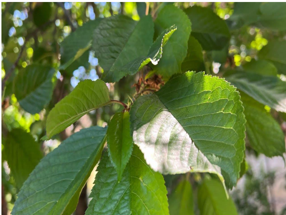
Slika 2. List višnje

List je vegetativni organ u kojem se odvijaju procesi fotosinteze, disanja i transpiracije. Oblik lišća višnje je lancetast ili eliptičan (Slika 2.). Vrh lista je zašiljen, dok je gornja površina sjajna. U usporedbi s trešnjom, listovi višnje su kožnati, a lisna peteljka obično nema žlijezde (Bačić i Sabo, 2007.). Duljina lisne peteljke varira između 1 i 3 cm (Dubravec i Dubravec, 1998.). Baza listne plojke je eliptičnog oblika i često sadrži jednu ili dvije žlijezde.