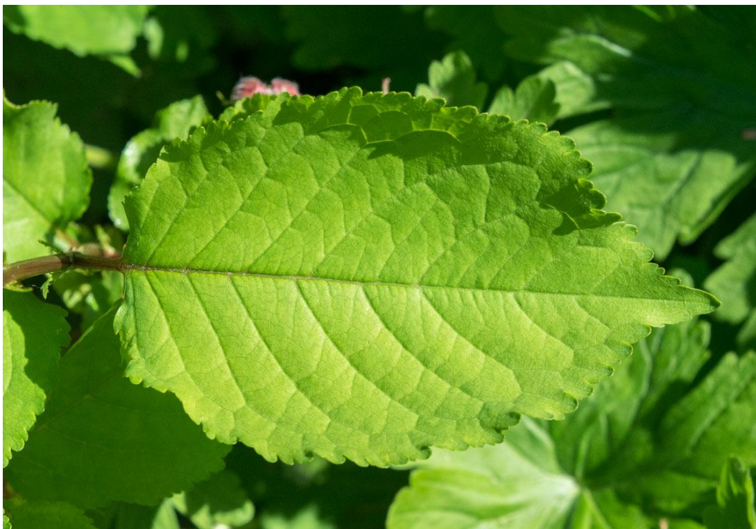
Slika 5. List višnje

Mlađa stabla se razvijaju jače i bujnije kod jačeg osvjetljenja, dok s druge strane, starija stabla ne reagiraju na dužinu i jačinu osvjetljenja. Utvrđena je pozitivna korelacija visoke rodnosti i dobroj osvjetljenosti cjelokupne krošnje. Zahvati kojima se osigurava dobra osvjetljenost krošnje su rezidba i izbor uzgojnog oblika te optimalnim razmakom sadnje. Zasjenjena stabla daju manji prirodu i slabiju kvalitetu plodova (Slika 5.).