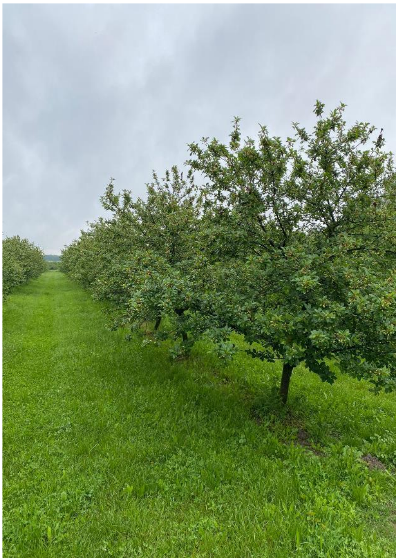
Slika 7. Oblačinska višnja

Oblačinska OS: Ova sorta višnje porijeklom je iz Hrvatske, točnije iz Slavonije. Izuzetno je pogodna za preradu, otporna na bolesti te se dobro prilagođava čak i lošim tlima. Karakterizira je slaba do srednje bujnost. Krošnja sorte je loptasta do širokopiramidalna i gusta (Slika 7.). Cvjeta srednje rano i samooplodna je. Plodovi koje donosi su sitni i imaju tamnocrvenu kožicu. Meso ploda je tamnocrveno, srednje čvrsto, slatkokiselu i aromatično. Sorta dozrijeva krajem lipnja.