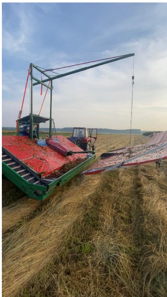
Slika 20. Traktorski berač osobne izrade