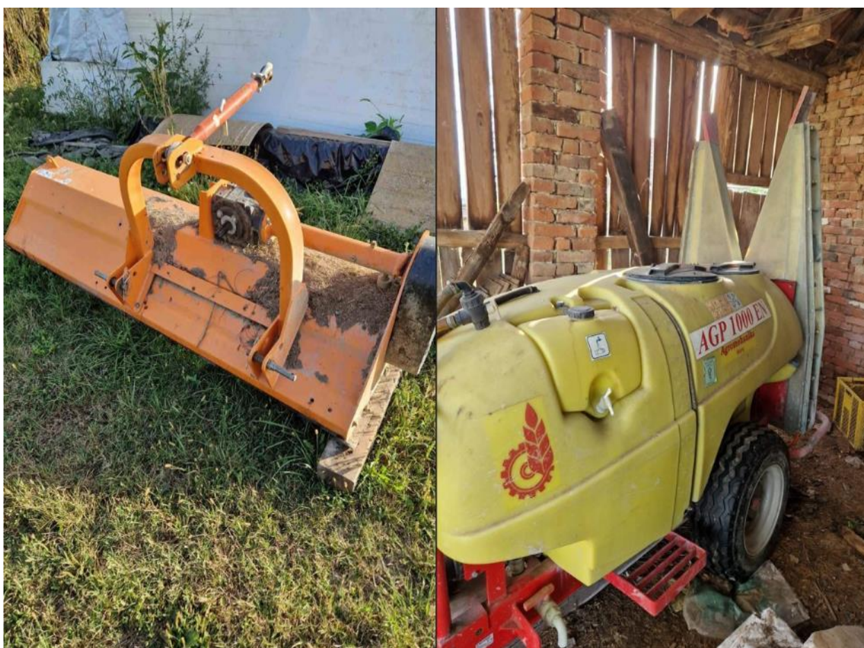
Slika 10. Mehanizacija potrebna za održavanje nasada višnje

OPG Ciboci nastao je 2010. godine i broji 3 člana. Na OPG-u uzgaja se isključivo višnja Oblačinska. Na površini od 3 ha posađeno je 2000 sadnica višanja. Ukupna vrijednost sadnica, obrade tla, analize i drugih čimbenika koji su bili nužni za ostvarenje OPG-a iznosila je približno 10 000 €. Nakon deset godina proizvodnja se proširila na dodatna 2 hektra i posađeno je dodatnih 1 000 sadnica iste višnje. Kroz godine, kupljena je mehanizacija koja je od velikog značaja u proizvodnji i održavanju nasada (Slika 10.). Danas, OPG ima svu potrebnu mehanizaciju i alate zahvaljujući teškom i upornom radu, poticajne financijske pomoći od države, te radu i zalaganju svih članova OPG-a.