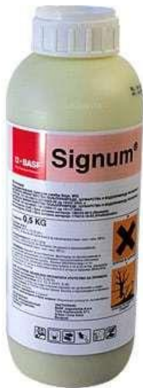
Slika 12. Signum, sredstvo za zaštitu od bolesti

Signum (Slika 12.) je sredstvo koje koristimo za suzbijanje bolesti. Koristimo ga kod koštičavog voća u koje spada i višnja. Vrlo česta i razorna bolest je monilija. Monilija zahvaća plod, cvijet i mlade izdanke iz biljke. Agresivno se širi i šteti biljci. Potrebno je preventivno zaštititi biljku kako bi se smanjio postotak zaraze monilijom. Prva zaštita nastupa sredinom ožujka (na OPG-u Ciboci 17.3.) te je tretman potrebno provesti više puta ako prvi put nije bilo značajnijih rezultata. Tako je druga zaštita istim sredstvom primjenjena 10. travnja. Način korištenja je kombinirati 0,75 l sredstva na 1 000 l vode.