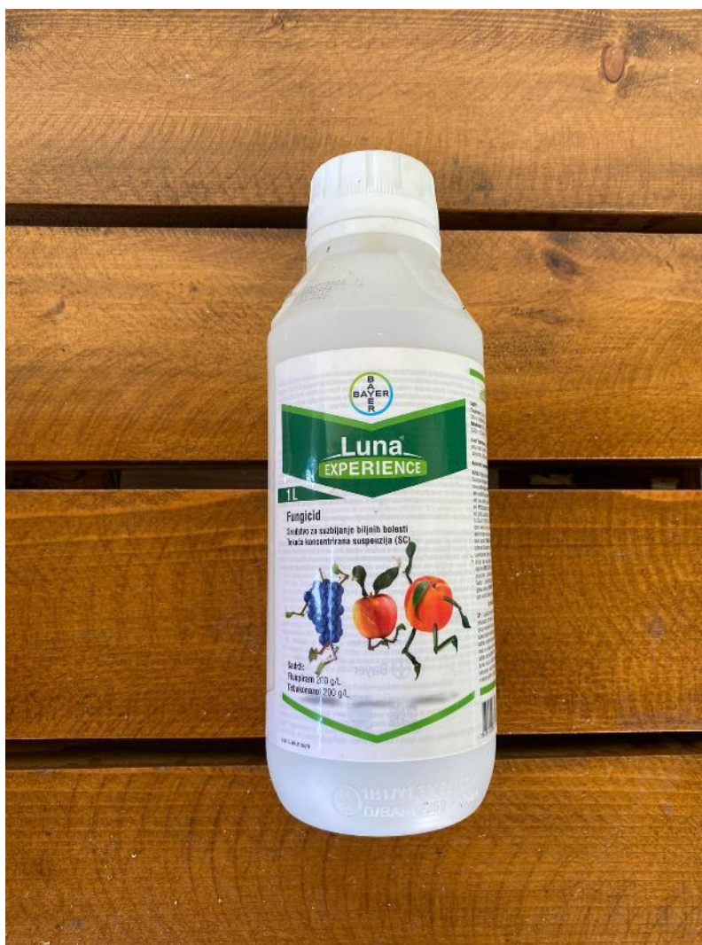
Slika 16. Luna experience, sredstvo za zaštitu bilja od monilije

Luna je novi kombinirani proizvod (fungicid) jedinstvenog načina djelovanja (Slika 16.). Suzbija biljne bolesti u voćarstvu, vinogradarstvu i drugim granama. Sastoji se od dvije aktivne tvari: fluopiram i tebukonazol. Visoko aktivno sredstvo koje sprječava nastajanje pepelnice, palež cvijeta kod višnje i brojne druge bolesti. Potrebno je primjeniti sredstvo u 0,2 l/ha po metro visine krošnje u 500 l vode. Za svaki metar visine krošnje, sredstvo se povećava za 0,2l. Datum provođenja zaštite ovim sredstvom je 31. svibnja te ponovljena zaštita 12.6. zbog intenzivnog porasta zaraze. Nakon primjenjena dva tretmana, bolest nije pokazivala znakove širenja.