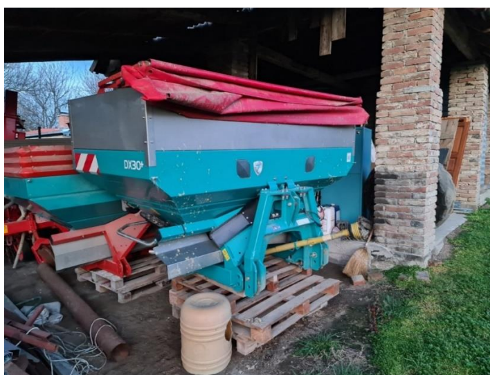
Slika 6. Rasipač SULK DPX 2500

Prema tablici 9. vidljivo je da se na rasipaču (slika 6.) ne provodi pregled kliznika za podešavanje i pregled stanja lopatice za apliciranje koji propisuje priručnik za upotrebu i održavanje SULKY DPX (2015.).