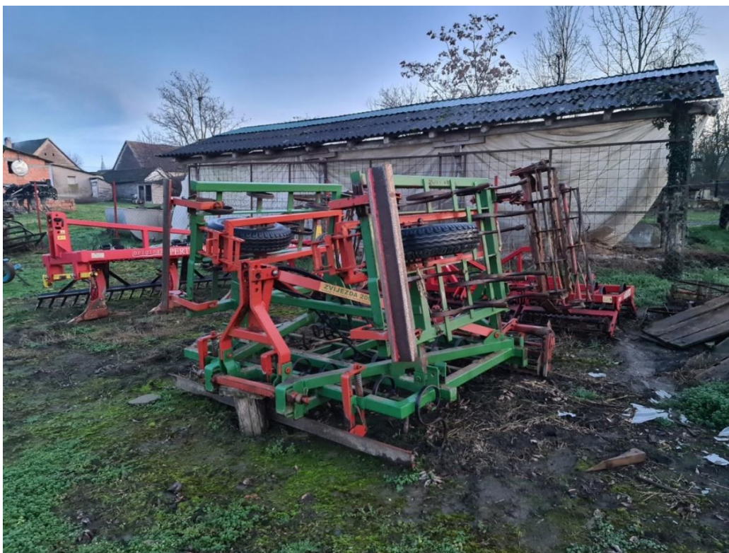
Slika 9. Sjetvospremal Zvijezda Našice

Prema Emert i sur. (1995.) u tablici 12. utvrđeno je da se sve mjere servisno-preventivnog održavanja sjetvospremača (slika 9.) provode na gospodarstvu.