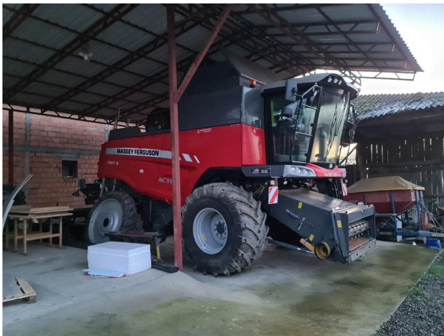
Slika 3. Massey Ferguson 7347 S

Usljed sezonskog radnog karaktera kombajna (Slika 3.) i neophodnosti njegovog besprijekornog rada održavanje kombajna se u potpunosti obavlja što je evidentno u tablici 5., izuzet provjere zazora motornih ventila prema priručniku za uporabu i održavanje Massey Ferguson (2015.).