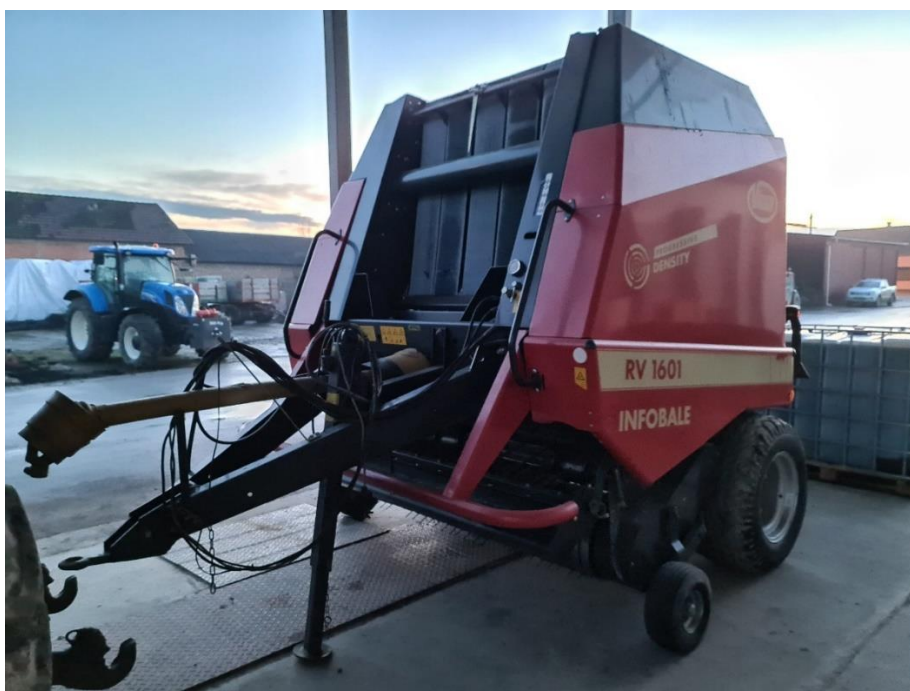
Slika 5. Presa vicon RV 1601

naputak za održavanje RV 1601, RV 1901 (2003.).