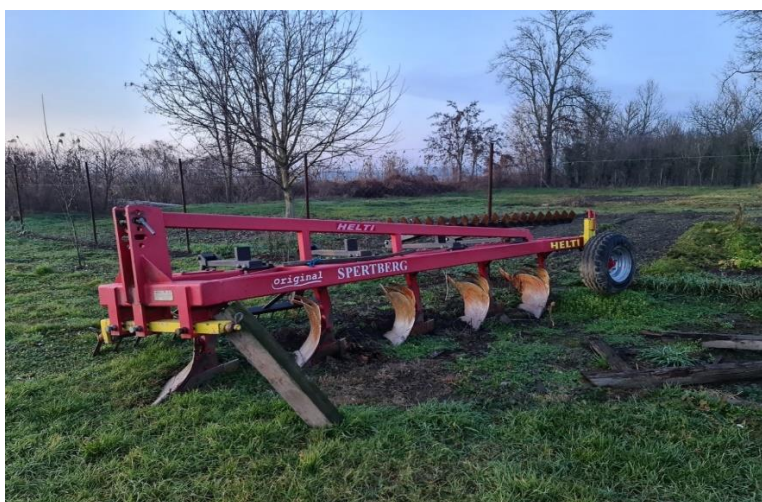
Slika 8. Plug Helti

Održavanje pluga (slika 8.) je prikazano u tablici 11. iz koje je evidentno da se veći dio mjera provodi, izuzev provjere hidrauličnih cilindara i crijeva, a koje navodi Emert i sur. (1995.).