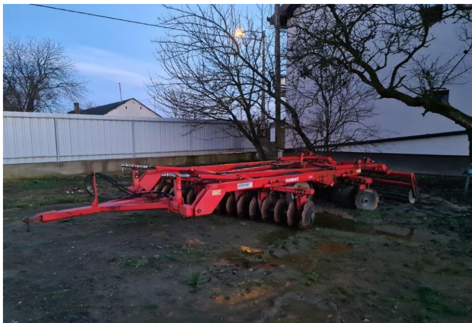
Slika 7. Tanjurača comet VVT 32

Tablica 10. prikazuje da se održavanje tanjurače (slika 7.) provodi u skladu sa tehničkim uputama za rukovanje i održavanje OLT-28, OLT-32 (2015.).