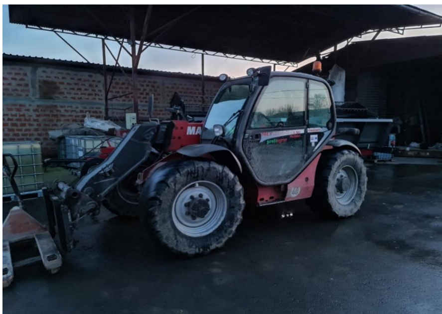
Slika 2. Manitou 634 ISU

Tablica 4. prikazuje da se obavljaju sve operacije servisno-preventivnog održavanja teleskopskog utovarivača (Slika 2.) prema priručniku za rad Manitou (2010.).