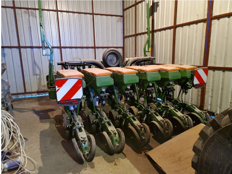
Slika 4. Sijačica Amazone Percea C4500