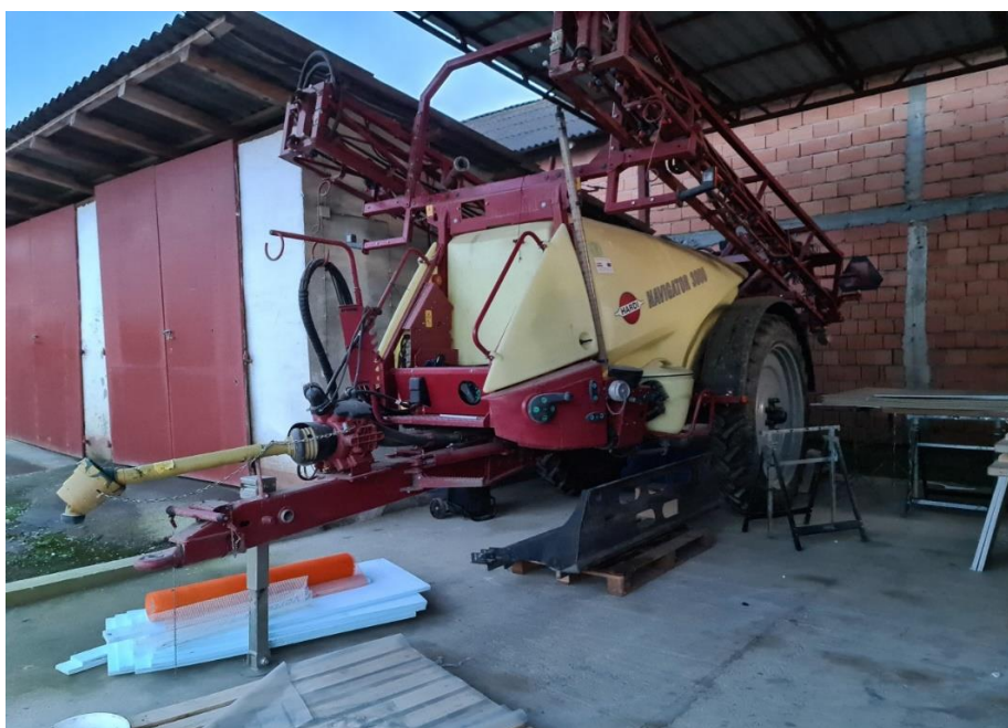
Slika 5. Prskalice Hardi navigator 3000

Iz tablice 8. vidljivo je da prilikom servisno-preventivnog održavanja prskalice (slika 5.) izostaje pregled ventila, provjera pročištača za jednostavno čišćenje i ciklonskog pročištača koji propisuje priručnik za održavanje Navigator 3000/4000/5000/6000 (2019.).