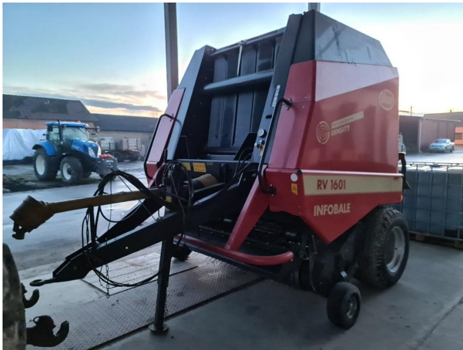
Slika 5. Presa vicon RV 1601

naputak za održavanje RV 1601, RV 1901 (2003.).