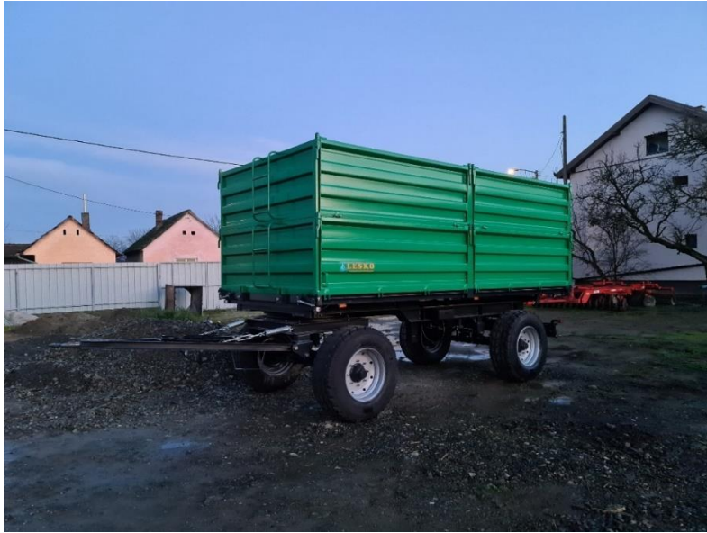
Slika 11. Prikolica Leško