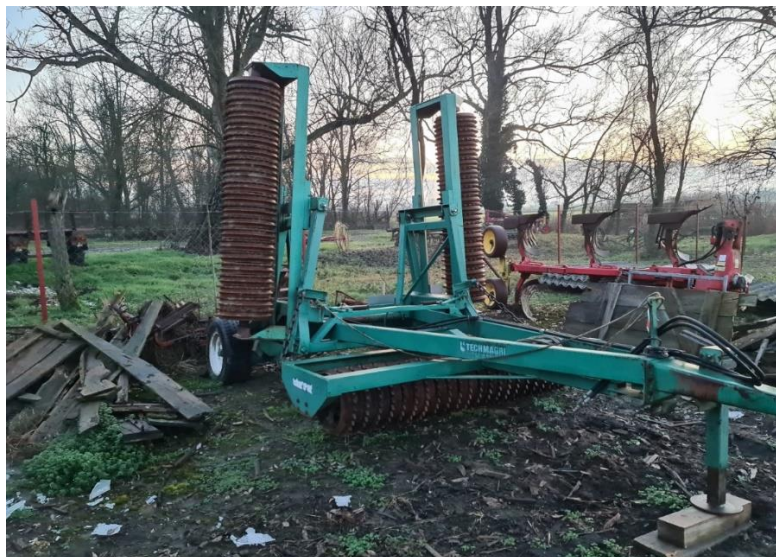
Slika 10. Valjak Cambridge TECHMAGRI

Valjci (slika 10.) su jednostavna oruđa i s time je jednostavnije održavanje. Nadalje, vidljivo je u tablici 13. da se servisno-preventivno održavanje provodi u skladu sa znanstvenom literaturom (Emert i sur., 1995.).