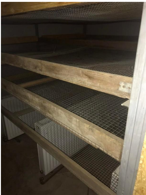
Slika 19. Sušara OPG-a

Prije sušare se skidaju peteljke s plodova, plodovi se usitnjavaju i melju. Na OPG-u „Ištvan Jozef“ sušenje se obavlja radijatorima na plin. Kapacitet sušare je 4000 kg svježe paprike. Na Slici 19. prikazana je unutrašnjost sušare na ovom gospodarstvu, a na Slici 20. osušena paprika.