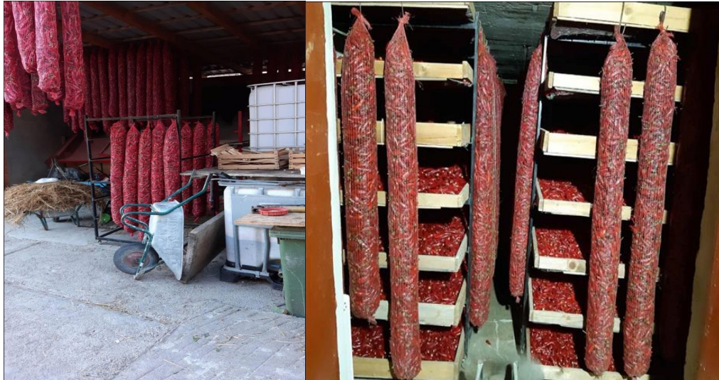
Slika 18. Začinska paprika na dozrijevanju

Prije sušare se skidaju peteljke s plodova, plodovi se usitnjavaju i melju. Na OPG-u „Ištvan Jozef“ sušenje se obavlja radijatorima na plin. Kapacitet sušare je 4000 kg svježe paprike. Na Slici 19. prikazana je unutrašnjost sušare na ovom gospodarstvu, a na Slici 20. osušena paprika.