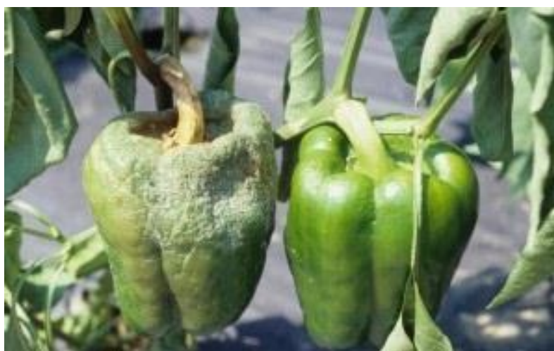
Slika 15. Plamenjača na plodu paprike

- Plamenjača je jedna od najznačajnijih i najopasnijih bolesti paprike (Slika 15.), ali i rajčice i krastavca. Uzročnik ( Phytophthora capsici ) je vrlo destruktivan i može smanjiti prinos od 40-100%. Do masovnih šteta dolazi ako se u gramu tla nađe više od 25 oospora ( https://www.agroklub.com ).