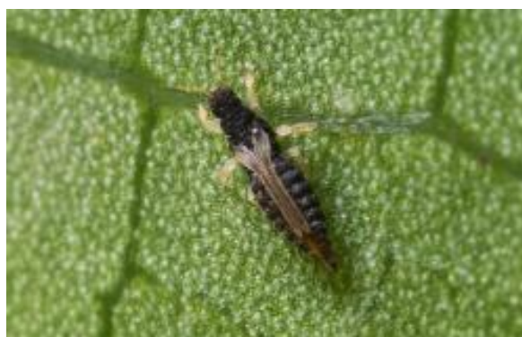
Slika 7. Cvjetni resičar ( Heliethrips haemorrhoidalis Bouche)