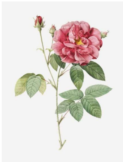
Slika 2. Rosa gallica

metara visine i ima dugu povijest uzgoja koja seže u 16. stoljeće. To je visok, trnovit grm koji potječe iz središnje Azije i poznat je po svojim velikim, punim, bijelim ili rozim cvjetovima. Cvjetovi su bogati eteričnim uljima koja im daju karakterističan miris. U tradicionalnoj medicini latices stolisne ruže koriste se za liječenje raznih bolesti, uključujući probavne smetnje, glavobolje i menstrualne bolove. Uzgoj Rosa centifolia radi njenog eteričnog ulja važna je industrija u mnogim zemljama, uključujući Bugarsku, Tursku i Maroko. Ružine latices beru se ručno, a zatim destiliraju parom kako bi se ekstrahiralo eterično ulje (Tiwari i Tewari, 2013.). Rosa gallica (Slika 2.) poznata i kao francuska ruža, listopadni je grm koji potječe iz Europe i zapadne Azije. Ima jak, slatkast miris i poznata je po svojim jarko obojenim cvjetovima. Grm može narasti do 1,5 metara visine, s trnovitim stabljikama je i tamnozelenim listovima. Biljka sadrži brojne korisne spojeve, uključujući tanine, flavonoide i eterična ulja. Rosa gallica također je odigrala značajnu ulogu u umjetnosti i književnosti. Ruža je prikazana u brojnim umjetničkim djelima, ali i u književnim djelima, poput drame "Romeo i Julija" Williama Shakespearea ( https://www.rhs.org.uk/plants/9672/Rosa-gallica/Details ).