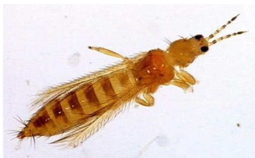
Slika 10. Kalifornijski trips ( Frankliniella occidentalis Perg.)