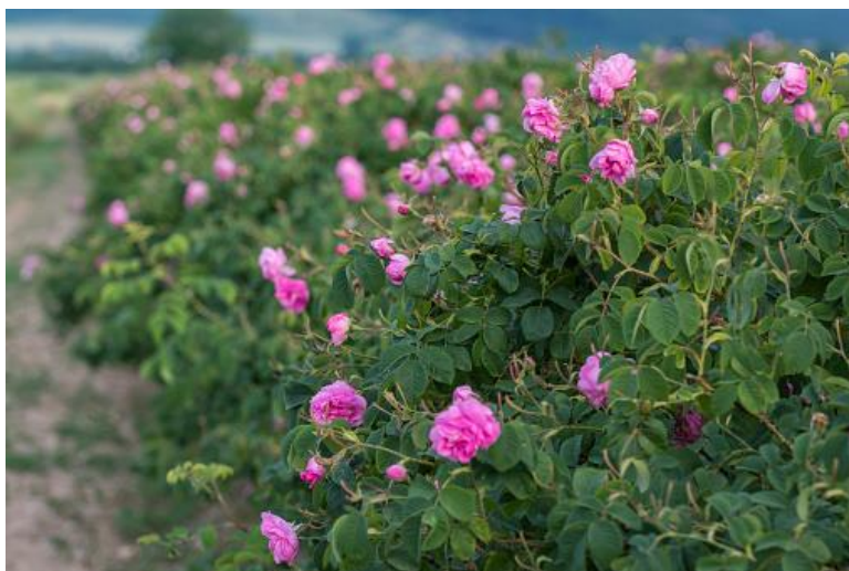
Slika 1. Rosa damascena

Rosa damascena , poznata i kao damaščanska ruža, možda je najpoznatija vrsta uljarice. To je višegodišnji grm koji potječe s Bliskog istoka, a naširoko se uzgaja u Bugarskoj, Turskoj i Iranu zbog vrlo cijenjenog eteričnog ulja (Hadian, 2014.). Uzgaja se tisućama godina zbog svoje ljepote, mirisa i ljekovitih svojstava. Cvjetovi su tipično ružičaste do svijetlocrvene boje, snažnog i slatkog mirisa koji je vrlo cijenjen u industriji parfema i kozmetike. Cvjetovi se obično beru rano ujutro, prije vrućine, a zatim se destiliraju za proizvodnju ružinog ulja koje se koristi u proizvodnji parfema, kozmetike i proizvoda za aromaterapiju. Latice ruže koriste se za izradu ružine vodice koja se koristi u kuhanju, kao tonik za kožu i u medicinske svrhe. Esencijalno ulje Rosa damascena (Slika 1.) bogato je antioksidansima i vitaminima, što ga čini izvrsnim sastojkom za proizvode protiv starenja i protuupalne proizvode, a također se koristi kao antiseptik, pomažući u zacjeljivanju rana i sprečavanju infekcija (Boskabady i sur., 2011.).