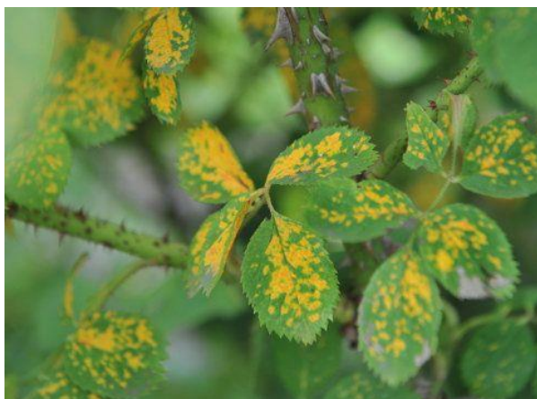
Slika 16. Hrđa ruža ( Phragmidium mucronatum (Pers.) Schlecht)

Uzrokuje simptome na lišću, zelenim mladim granama i čašičnim listićima. Tijekom ljeta, na naličju lišća pojavljuju se uredosorusi u ružičastoj ili crveno-narančastoj boji. Širenje uredospora događa se putem zračnih strujanja. U područjima s oštrijom klimom, gljiva prezimljava u obliku teleutosorusa koji su crne boje. Mjere zaštite protiv hrđe ruže uključuju skupljanje i uništavanje zaraženog lišća te temeljito orezivanje ruža prije pojave novih izboja. U staklenicima ili plastenicima važno je spriječiti kondenzaciju, a mogu se primijeniti i fungicidni pripravci. U Hrvatskoj, za suzbijanje hrđe koriste se pripravci koji sadrže bitertanol i propineba (Jurković i sur., 2010.).