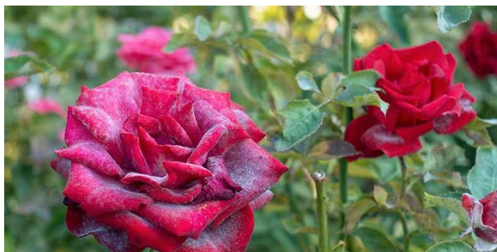
Slika 14. Pepelnica ruža ( Sphaerotheca pannosa (Wallr.) Lev. var. Rosae Woron)