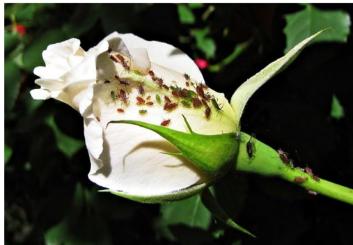
Slika 8. Ružina lisna uš ( Macrosiphon rosae L.)

Ružina lisna uš ( Macrosiphon rosae L.) je štetnik koji ima duljinu od 2,2 do 3,4 mm. Njezin zadak je svijetlozelen s tamnim skleritima na zglobovima. To je heteroekološka i holociklična vrsta koja prezimljava kao zimska jaja na različitim vrstama ruža. Štetnik napada cvjetne pupove, izbojke i mlado lišće te sisa sokove. To dovodi do deformacija pupova i njihovog zatvaranja, dok listovi postaju žuti. Tijekom hranjenja, luče izmet na kojem često nastaju gljivice, što dovodi do pojave čađavosti. Osim toga, ružina lisna uš može prenositi virusne bolesti. Suzbijanje se provodi zimskim prskanjem (Maceljski, 2002.).