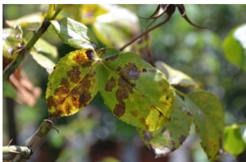
Slika 18. Marssonina Rosae (Lib.) Lind

Poznata kao zvjezdasta pjegavost, predstavlja jednu od najvažnijih bolesti ruža diljem svijeta, posebno pri uzgoju na otvorenom. Ova bolest inficira lišće, jednogodišnje izboje, cvjetove, lisne peteljke, čašične listiće i plodove ruže. Tipični simptomi na lišću su male tamne pjege koje se šire u obliku zvijezde, gotovo crne boje. Zaraženo lišće postaje žuto i otpada. Na jednogodišnjim izbojima, pjege su izbočene, nepravilnog oblika i purpurno-crvene boje, a tkivo unutar pega pukne. Izboji često predstavljaju izvor infekcije u sljedećoj vegetacijskoj sezoni. Za suzbijanje zvjezdaste pjegavosti ruža preporučuje se primjena kombiniranih agrotehničkih i kemijskih mjera. Ove mjere uključuju promjene u uzgojnoj praksi, kao i primjenu odgovarajućih fungicidnih pripravaka. Cilj je smanjiti širenje bolesti i očuvati zdravlje ruža (Jurković i sur., 2010.).