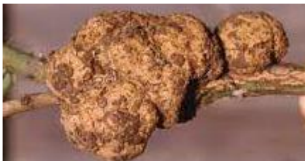
Slika 19. Agrobacterium tumefaciens (E. F. Smith & Towns) Conn

postaju tamniji i odrvenjavaju. Zaraza se prenosi putem ozljeda na biljci, a A. tumefaciens najaktivnije djeluje tijekom ljeta. Suzbijanje ove bolesti provodi se kroz dezinfekciju tla, orezivanje zaraženih dijelova biljke te uporabu čistog alata i opreme. Također, preporučuje se sadnja deklarirano zdravih sadnica kako bi se smanjio rizik infekcije (Jurković i sur., 2010.).