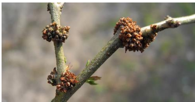
Slika 17. Bakterija Agrobacterium tumefaciens (E. F. Smith & Towns) Conn.