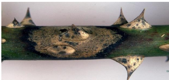
Slika 20. Coniothyrium wernsdorffiae

Poznat kao uzročnik paleži izbojka, započinje svoj razvoj na kori izbojka. Stvara male pjege žute ili crvene boje koje se s vremenom šire. Središnji dio pjege ima svjetliju boju i na njemu se formiraju crne točkice, poznate kao piknidije. Zaraženo tkivo jasno je odvojeno tamnijom zonom zdravog tkiva. Ako rak prstenasto obuhvati izbojak, sve iznad mjesta vene i propada. Infekcija se događa kroz ozljede nastale insekatima, rezanja, uklanjanja trnja ili listova. Skladišta za čuvanje ruža, zbog povoljnih temperatura i vlažnosti, pružaju pogodna okruženja za razvoj gljive. Smanjenje mogućnosti oštećenja izbojka ruže predstavlja temeljnu mjeru u suzbijanju ove bolesti (Jurković i sur., 2010.).