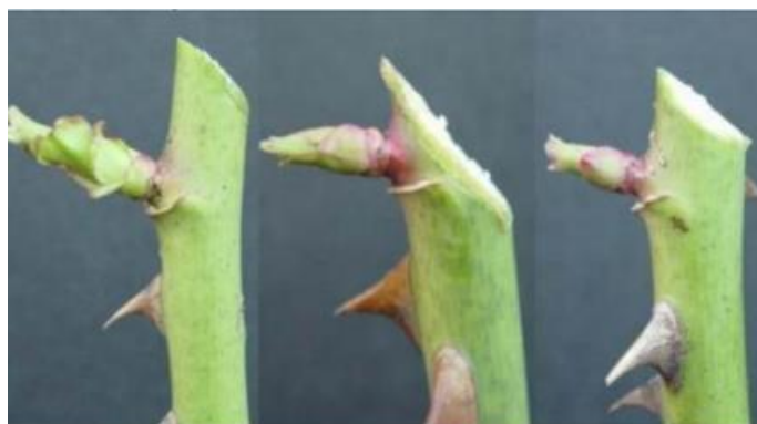
Slika 4. Obrezivanje ruža previsoko, prenisko, ispravno