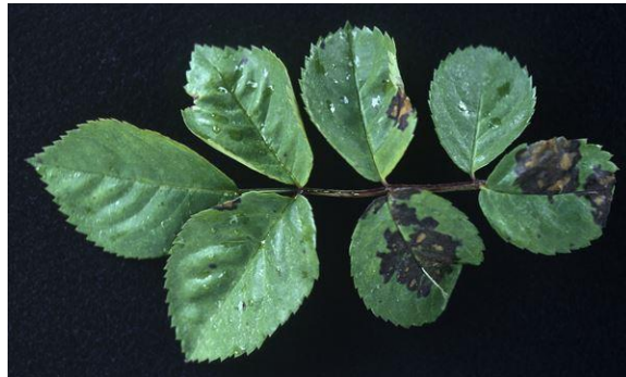
Slika 13. Plemenjača ( Peronospora sparsa Berk.)

s minimalnim sličnostima, kako bi se izbjegla detekcija plagijata prilikom provjere originalnosti (Jurković i sur., 2010.)