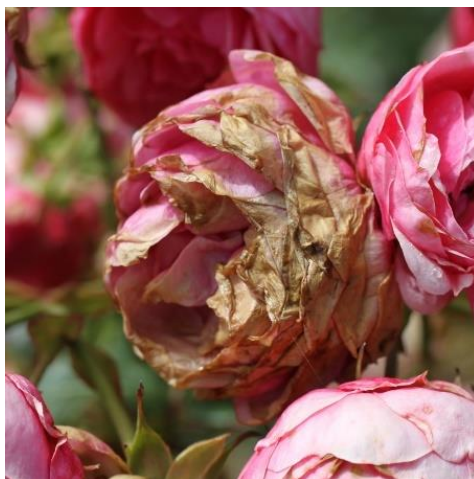
Slika 15. Siva plijesan ( Botrytis cinerea Pers ex Fr.)

Fakultativni parazit koji može napasti različite uzgojene biljke i biljke u divljini. Ovaj parazit može uzrokovati bolest na svim dijelovima biljke, a simptomi variraju ovisno o domaćinu i zaraženom organu. Mogu se javiti u obliku pjega na lišću, laticama i braktejama, ili kao rane na stabljikama. Simptomi su obilne, sive i pahuljaste prevlake koje se lako prepoznaju na zaraženim biljkama. Ove prevlake se razvijaju u uvjetima visoke zračne vlage. Infekcija se obično događa kroz prirodne otvore ili rane na biljkama. Suzbijanje sive plijesni provodi se kroz fitosanitarne mjere, kontrolu okolišnih uvjeta, agrotehničke mjere i primjenu fungicidnih pripravaka. Preporučuje se uništavanje zaraženih biljaka ili dijelova biljaka (Jurković i sur., 2010.).