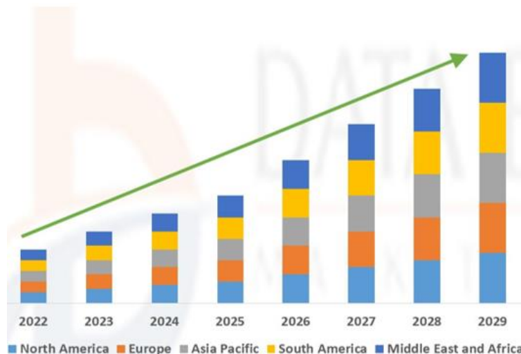
Slika 23. Očekivan rast proizvodnje eteričnog ulja ruže

Data bridge ( https://www.databridgemarketresearch.com/reports/global-rose-oil-market ) daje prognozu do 2029. godine. Slika 23. pokazuje očekivan rast proizvodnje eteričnog ulja ruže.