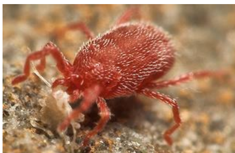
Slika 9. Voćni crveni pauk ( Panonychus ulmi Koch)