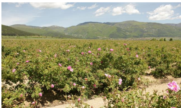
Slika 5. Dolina ruža u Bugarskoj