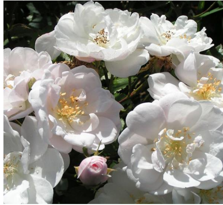
Slika 3. Rosa moschata

i često se koristi kao osnovna nota u parfemima. Osim u parfumeriji, također se koristi u tradicionalnoj medicini zbog svojih terapijskih svojstava. Biljka se koristi za liječenje raznih bolesti, kao što su probavni poremećaji, iritacije kože i respiratorne infekcije (Tisserand i Young, 2014.).