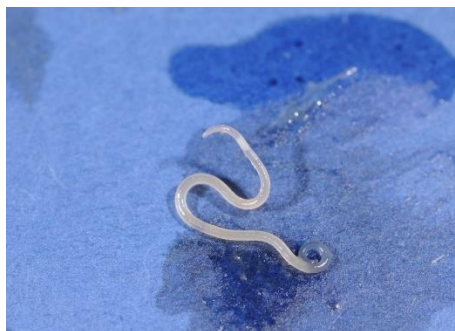
Slika 11. Valjkasti crv ( Meloidogyne )

Valjkasti crv ( Meloidogyne ) je vrsta nematode koja napada korijenov sustav biljaka, što rezultira stvaranjem zadebljanja na korijenovim dlačicama. Ova deformacija korijena dovodi do poremećaja u vodoopskrbi i unosu hranjivih tvari, što rezultira simptomima nedostatka hranjiva i venenja biljaka. Kako bi se suzbio ovaj štetnik, zaražene biljke treba ukloniti i uništiti, a zemljište treba dezinficirati. Za kontrolu valjkastog crva mogu se koristiti i nematocidi, tvari koje djeluju protiv nematoda (Maceljski, 2002.).