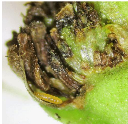
Slika 12. Mušice kalemarice ( Resseliella / Clinodiplosis / oculiperda Rgbs.)

sušenje. Početne faze ličinki su bijele, ali kasnije dobivaju narančasto-crvenu boju. Razvojni ciklus traje između 4 i 6 tjedana. Ponekad se ličinke mogu dublje zakopati u drvo, što rezultira sušenjem grana. Tijekom zime, prezimljavaju u obliku kukuljica u tlu. Mjere zaštite od mušice kalemarice uključuju sprječavanje pojave oštećenja na kori biljaka. Nakon okuliranja ili obrezivanja, preporučuje se omatanje i premazivanje voćarskim voskom. Dodatno, nakon okulacije, moguće je primijeniti kontaktni insekticid na okuliranim područjima kako bi se suzbio štetnik (Maceljski, 2002.).