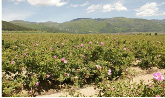
Slika 5. Dolina ruža u Bugarskoj