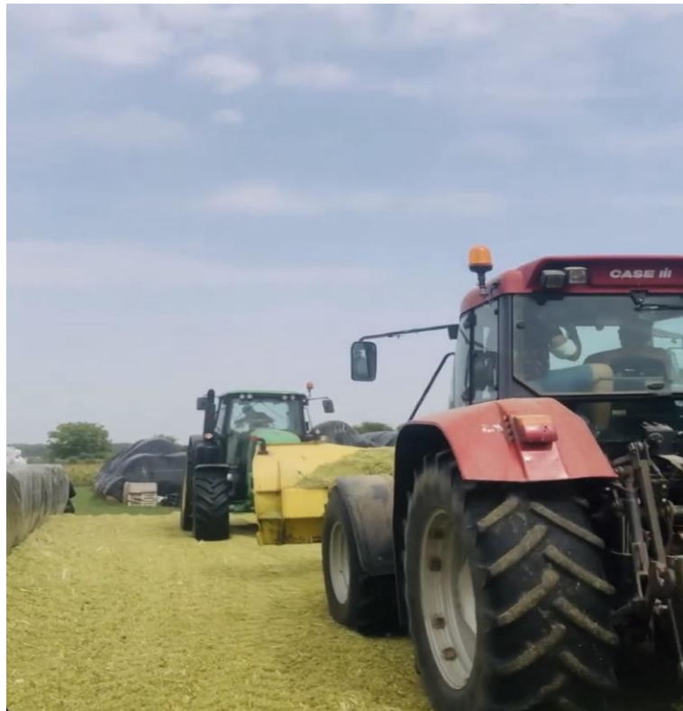
Slika 5. Gaženje silaže na istraživanom obrtu