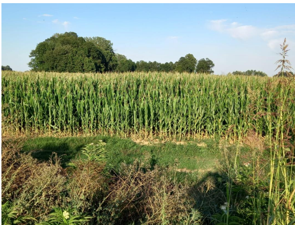
Slika 2. Oranica u posjedu istraživanog obrta

Oranice su smještene u selu, na ravnom terenu i na dubokom tlu (Slika 2.). Oranice su poljoprivredne površine koje se koriste za obradu i uzgoj raznih biljnih kultura kao što su žitarice, leguminoze, voće i povrće. Ulaganje u obradivo zemljište temelj je za proizvodnju hrane i sirovina koje su ključne za prehrambene potrebe ljudi i životinja.