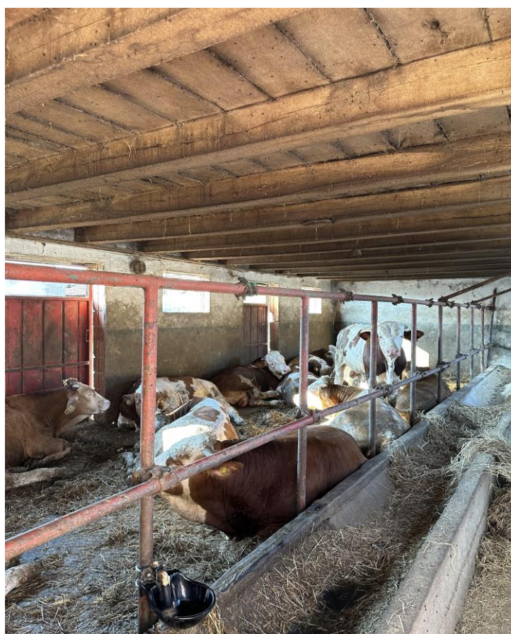
Slika 3. Štala za junad na istraživanom obrtu