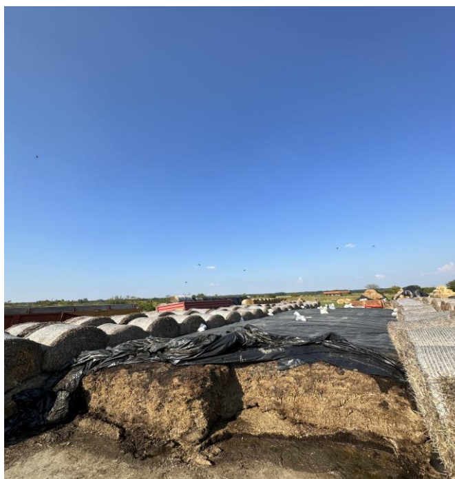
Slika 4. Skladištenje silaže nadzemne mase kukuruza na istraživanom obrtu

Silaža je fermentacijom konzervirana krma biljnog porijekla, poput kukuruza, trave ili sijena koja se koristi kao krmivo za stoku. U vodoravnim silosima silaža se slaže u slojeve, a zatim zbija kako bi se spriječilo kvarenje i oksidacija. Ovi silosi obično imaju veliki kapacitet i omogućuju jednostavan pristup silaži tijekom hranjenja stoke. Prednosti horizontalnih silažnih silosa su manji gubici hranjivih tvari i niži troškovi izgradnje. Pravilno upravljanje silažom također je važno kako bi se osigurala visoka kvaliteta krme i odgovarajuća hranidba životinja. Silaža je ukusno krmivo koje ima mogućnost duljeg čuvanja. Proces siliranja obuhvaća faze početne oksidacije, zatim octeno vrenje, mliječno-kiselo vrenje, smirivanje procesa vrenja te naknadno maslačno vrenje. Za dobru sabijenost silaže potreban je pravilan nagib gaženja direktno uz zid silosa.