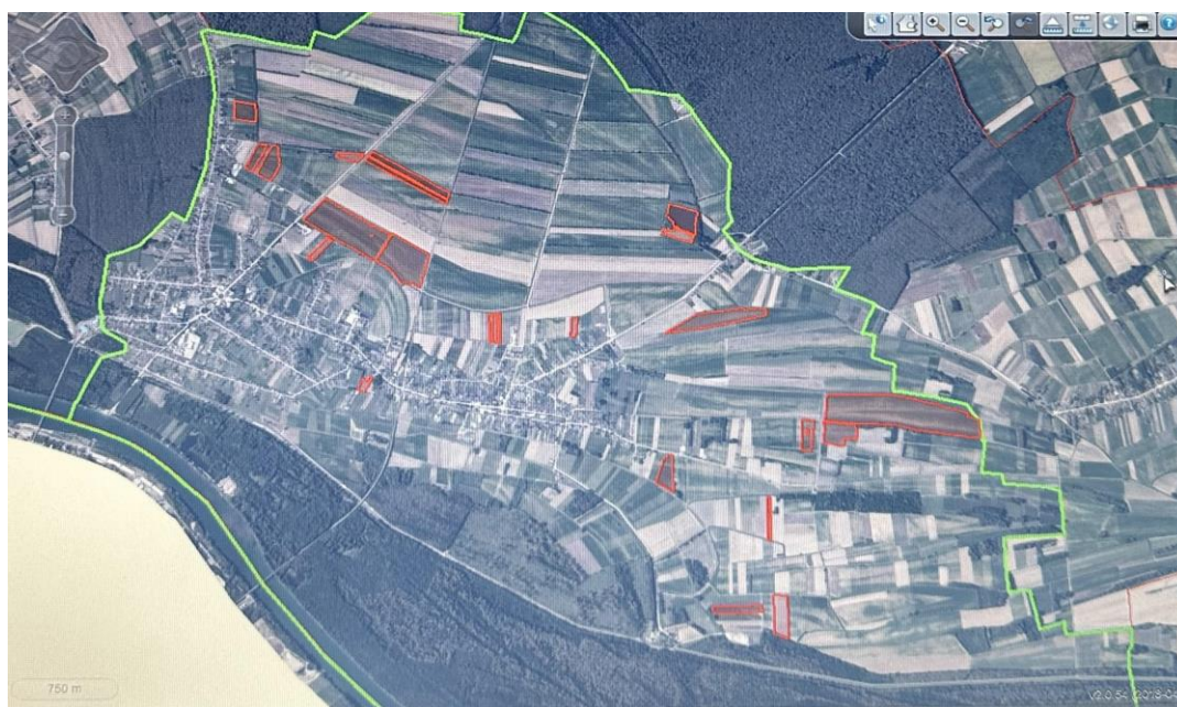
Slika 1. Pregled zemljišnih resursa istraživanog obrta

Sve proizvodne površine su u kategoriji oranice. Prosječna veličina oraničnih jedinica je 3.7096 ha, s prosječnom udaljenošću 2.88 km od ekonomskog dvorišta ( Tablica 2.).