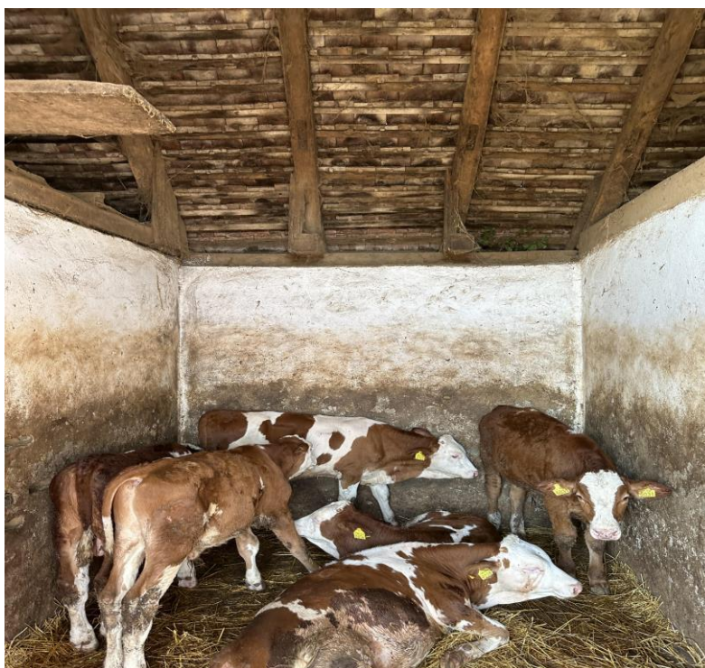
Slika 8. Telad na istraživanom obrtu

2022. godine u tov je ušlo 193 teladi, u dva navrata. Telad su bila križanci pasmina za proizvodnju mesa i mlijeka (Slika 8.). Prosječna tjelesna masa teleta na ulazu u tov je bila oko 98 kg/grlu, a starost 1-2 mjeseca. Po ulasku u tov telad se počinje privikavati na silažu. Prvih dana je obrok sastavljen od kvalitetnog sijena, smjese koncentrata i prekrupe kukuruza, a postupno se uvodi sve veći udio silaže, odnosno silaža se dodaje kada telad dosegne tjelesnu masu od 200 kilograma.