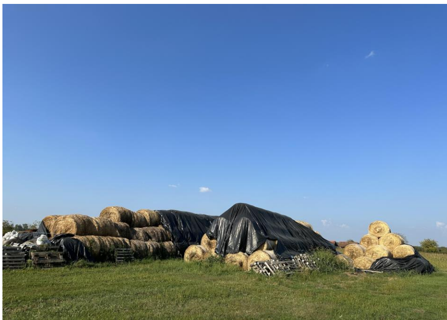
Slika 6. Skladištenje sijena na istraživanom obrtu