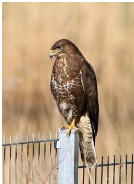
Slika 1. Obični škanjac ( Buteo buteo ).