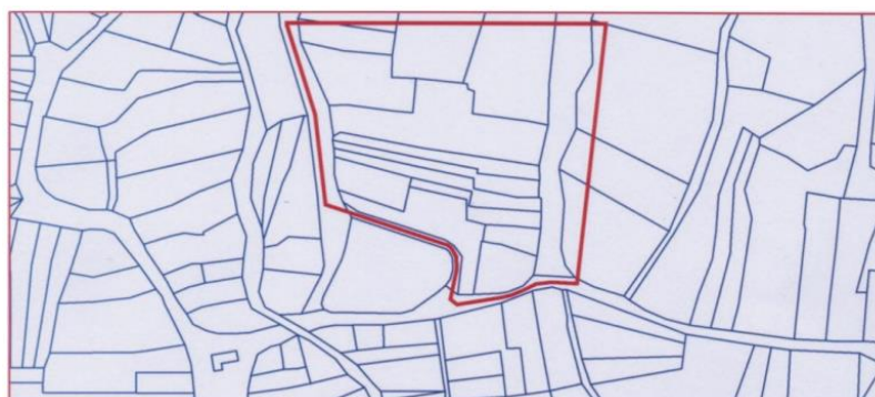
Slika 2 Primjer izgleda poljoprivrednog zemljišta nakon komasacije Izvor: „Značenje primjene komasacije u prošlosti i sadašnjosti uz vrednovanje nekoliko specifičnih lokacija u Požeško-slavonskoj županiji“: http://hrcak.srce.hr/97378 (08.06.2023.)