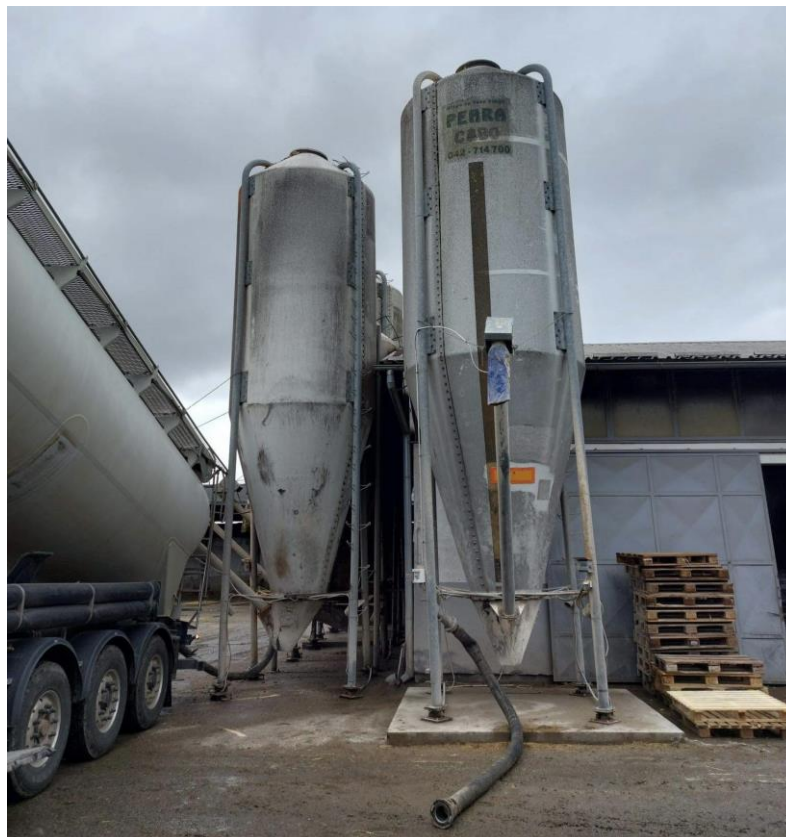
Slika 12. Farma Niza d.o.o ima u vlasništvu 6 silosa za svoje potrebe

Baza svih obroka u proizvodnji je na kukuruznoj silaži, silaži klipa, sjenaži ljulja ili lucerne, gotovim krmnim smjesama koje imaju 60% soje i 32% repice i suncokreta, mljevenom ječmu i premixima.