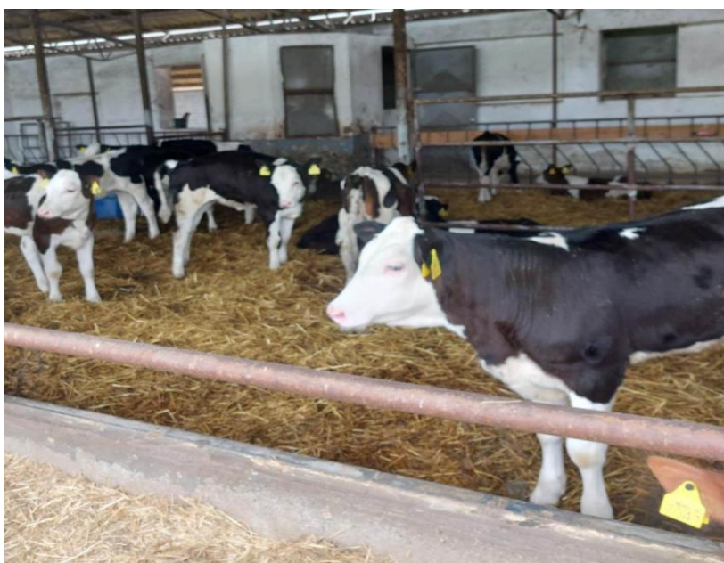
Slika 9. Boravak goveda između 70 i 100 dana starosti

Nakon navedenih 60 dana kao što je spomenuto, teladi se svakim napajanjem umanjuje po pola litre zamjenice dok se skroz ne ukine. Telad tada ulazi u prijelazno razdoblje na hranidbu sa starterom i suhim TMR-om (Total mixed ration). Sa 3 mjeseca starosti telad počinje konzumirati i "grower", a ukida se starter. Na takvoj ishrani telad je do 5 mjeseci starosti, a nakon toga prelazi na gotovi TMR u kojem počinje konzumirati i silažu.