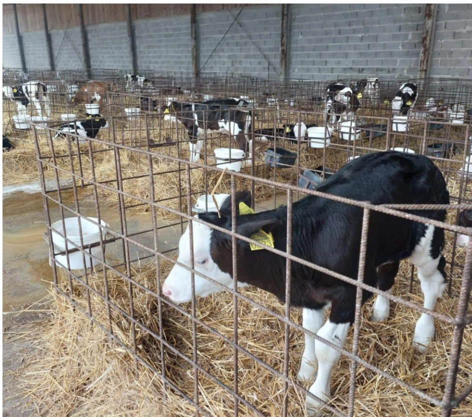
Slika 7. Telad provodi 7 do 10 dana u kavezima

Prva uzgojna faza je faza teljenja. Počinje teljenjem, telad mora primiti majčin kolostrum. Kolostrum je izuzetno važan jer životinje ne primaju antitijela preko posteljice. Kvaliteta kolostruma mjeri se količinom imunoglobulina po litri. Ako tele u početnim satima ne dobije kvalitetan i dovoljno kvantitativan kolostrum postoji velika vjerojatnost da tele neće razviti dovoljan i kvalitetan imunitet. Shodno tome, tele će biti podložno raznim bolestima i parazitima, te je naposljetku izgledno da će doći do uginuća.