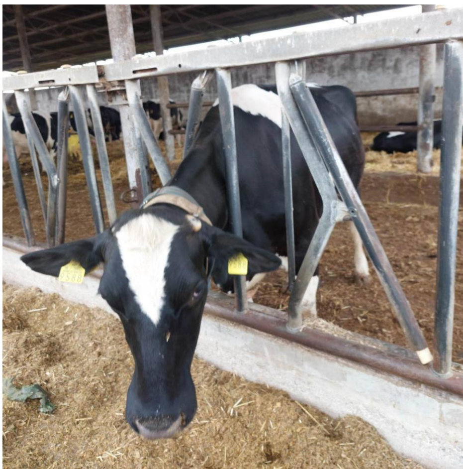
Slika 10. Junica na farmi Niza d.o.o

Telad sa 6 mjeseci starosti prelazi u junicu. Spada pod kategoriju junica sve dok se ne oteli. Cilj uzgoja junica je proizvodnja primjereno razvijenih, zdravih i reprodukcijsko sposobnih ženskih jedinki koje se mogu učinkovito uključiti u proizvodni ciklus. Uzgoj junica za remont na mliječnim farmama čini od 15 do 20% troškova te je vrlo važan za ukupni menadžment mlijećnih farmi. Ukoliko se uzgajaju junice za proizvodnju mlijeka, uzgoj ženskih grla započinje u dobi sa šest mjeseci te završava u dobi od dva mjeseca prije telenja, kada prvotelku treba početi privikavati na režim hranidbe koja podržava intezivan razvoj teleta (zadnja dva mjeseca graviditeta), završnu pripremu vimena te pripremu početka sekrecije mlijeka ( Ivanković i Mijić, 2020.).