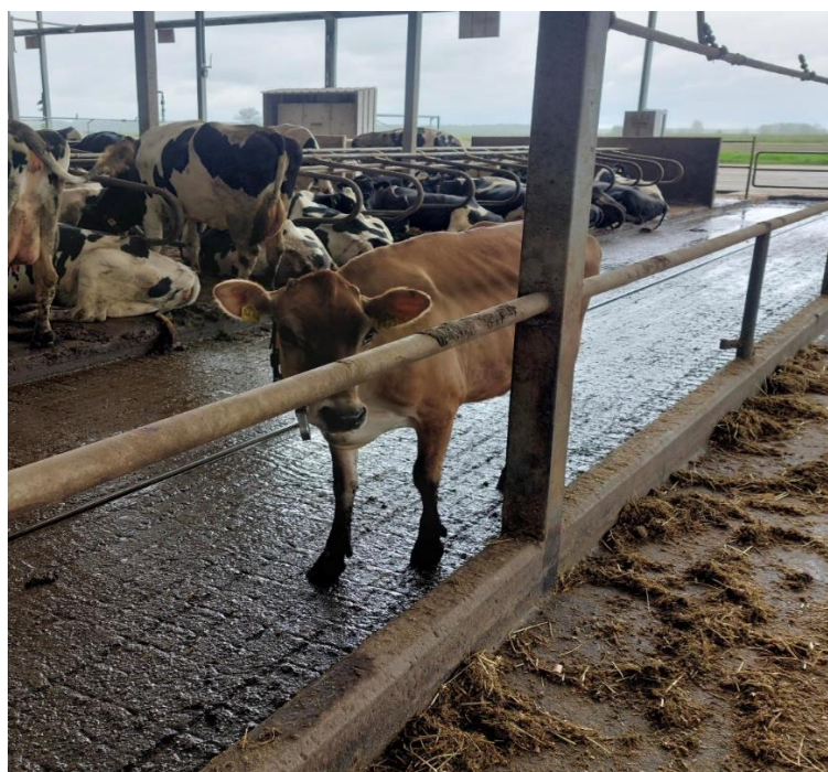
Slika 2. Jersey govedo na farmi Niza d.o.o

Boja dlake je jednobožno – žućkasta, smeđe do smeđecrvena. Glava je fina, s visoko položenim nozdrvama i velikim očima. Gubica je obrasla s vijencem svijetlih dlaka. Vrat je dug i tanak. Visina grebena krava je između 115 i 125 cm, širina prsa 31% visine grebena, a dubina prsa 53% visine grebena i dužina trupa 114-118% visine grebena. Leđna linija je ravna. Slabine su široke i jake. Vime je izuzetno dobro razvijeno (Vujčić, 1990.).