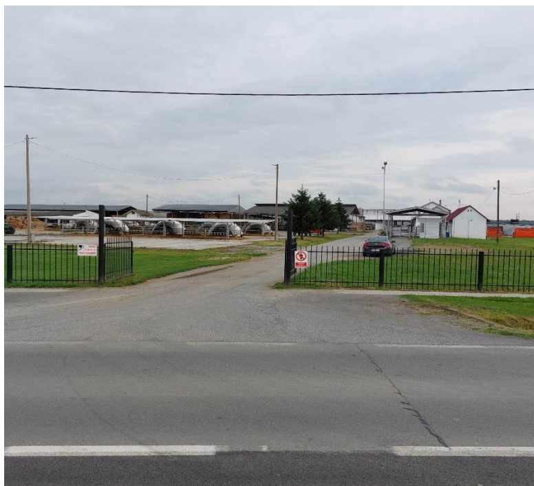
Slika 3. Službeni ulaz farme Niza d.o.o

Akumulacijom grla na novoizgrađeni kompleks dodalo se 450 steonih junica iz Danske kako bi trenutni ukupni broj grla iznosio 1360.