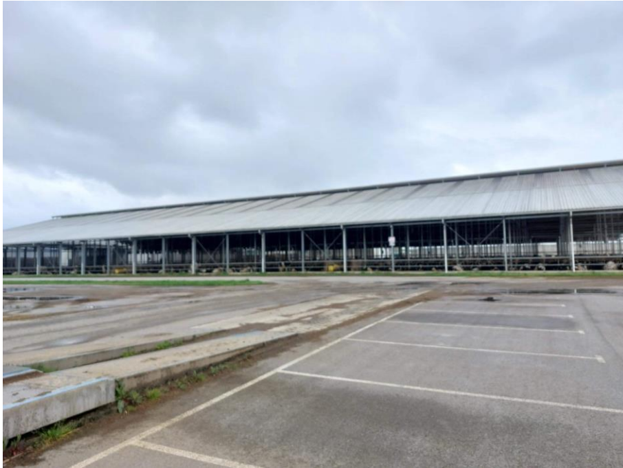
Slika 5. Vanjski dio novoizgrađene farme Niza d.o.o