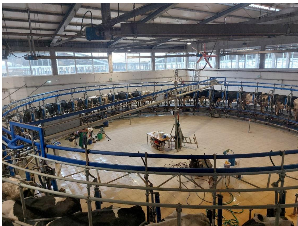
Slika 13. Rotolaktor izmuzište na farmi Niza d.o.o

Rotolaktor je izveden od strane proizvođača DeLaval. Konkretno, radi se o najvećem unutrašnjem modelu sa kapacitetom od 40 mjesta.