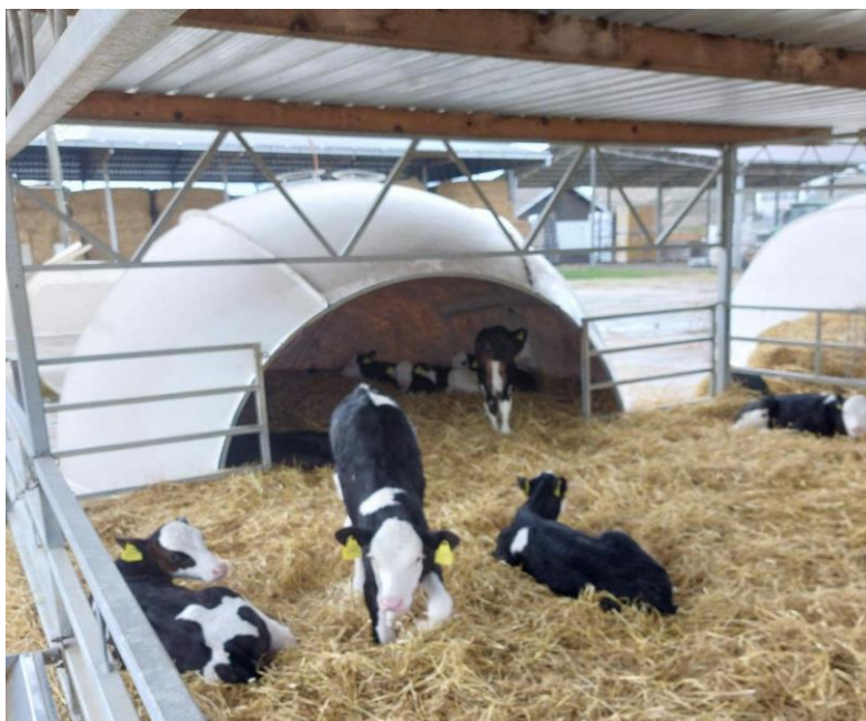
Slika 8. Grupni iglu na farmi Niza d.o.o