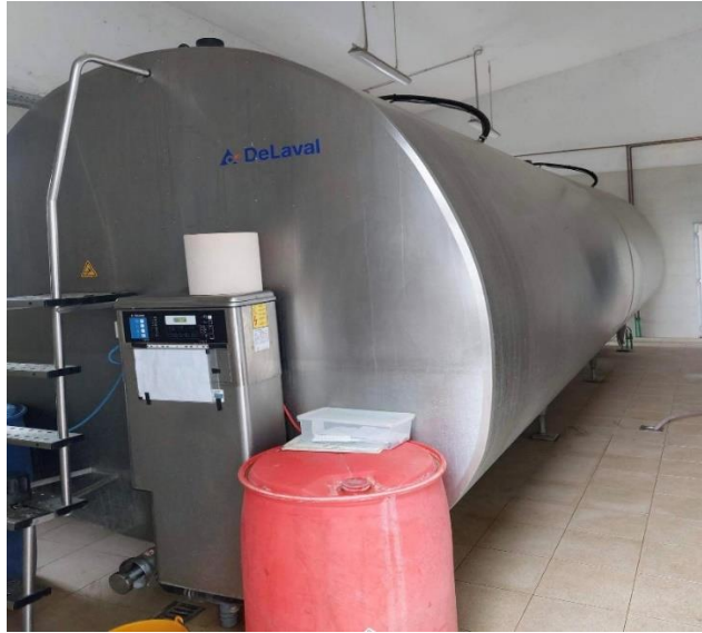
Slika 15. Laktofriz kapaciteta 32000 litara