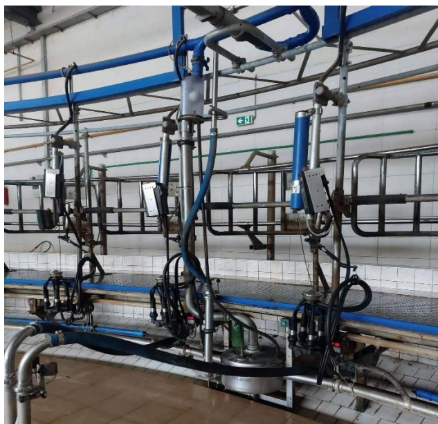
Slika 14. Muzne jedinice

satne frekvencije, muze se 185 krava na sat, što predstavlja optimalan broj u odnosu na kapacitet. Mogućnost je da brojka iznosi i do 210 krava na sat, ali za to uvjeti trebaju biti gotovo idealni. Jedan krug od ulaska krave pa do izlaska traje otprilike 12 do 13 minuta kada je kapacitet maksimalno popunjen. Cilj je da se u krugu od 12 do 13 minuta krava pomuze. Muzne jedinice su automatski namještene da padaju sa vimena kada razina mlijeka u vimenu iznosi 300 grama. U rotoru rade 3 ženska radnika. Dvije radnice su na početnom, ulaznom dijelu rotolaktora, a jedna je na izlazu. Prva osoba je zadužena da stavlja "prediping" (Oxy Foam od EcoLaba). Sredstvu treba 45 sekundi da djeluje, te svojim djelovanjem stimulira kravu da pusti mlijeko. Druga osoba briše vime i ispušta prve mlazove na crnu podlogu kako bi se provjerila mogućnost mastitisa i je li mlijeko ispravno. Nakon toga, ako je sve u redu, stavlja se muzne jedinice. U slučaju neispravnog mlijeka krava se muze na kantu i to mlijeko se naposljetku baca i ne završava u laktofrizu.