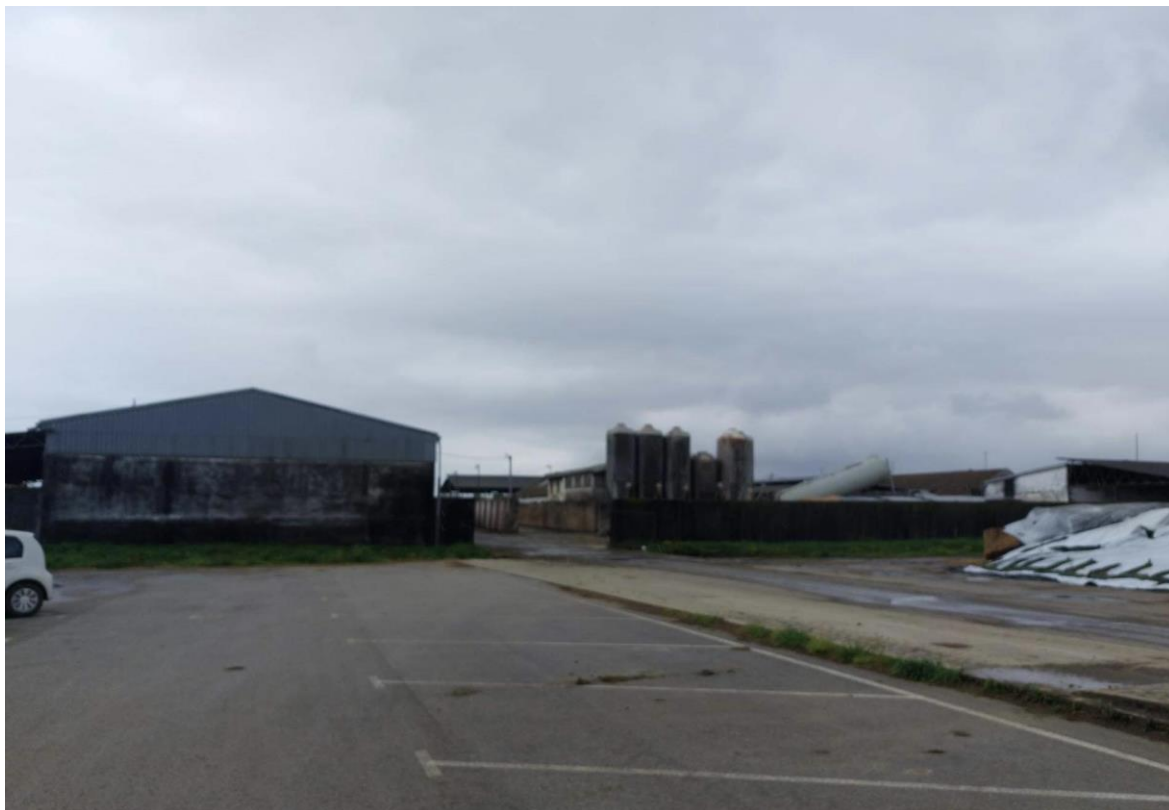
Slika 4. Stari dio farme Niza d.o.o

Stari dio farme prilikom adaptacije 2020. godine adaptiran je i transformiran u sektor za uzgoj teladi, kao i za krava koje se ne muzu. Služi za goveda koja se nalaze u fazi suhostaja. Također, služi za svježe krave te krave koje su iz različitih razloga na terapiji. Odnosi se na terapije kao što su enteritis, pneumonija i mastitis.