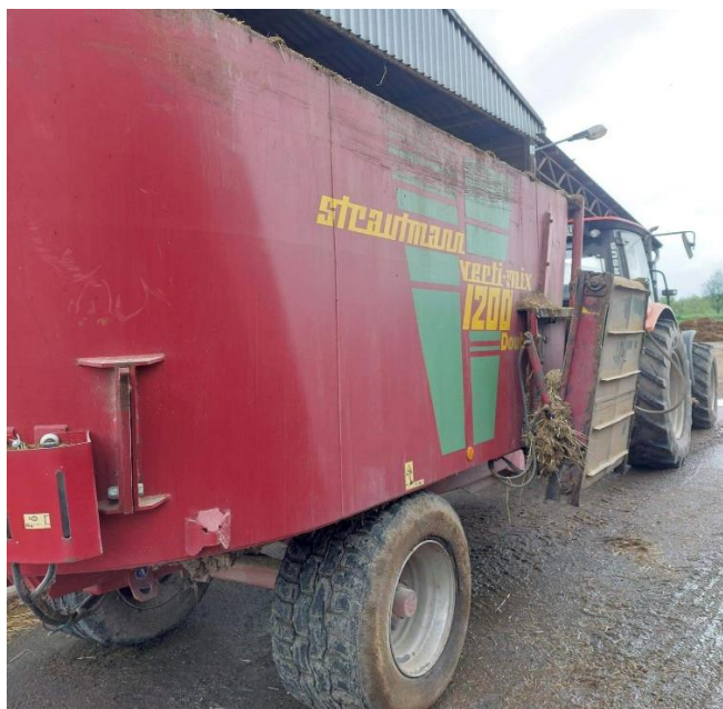
Slika 11. Strautmann Vert-mix 1200

Telad na farmi Niza d.o.o hrani se zamjenicom i starterom po volji, što je ranije objašnjeno u prethodnom poglavlju. Takva hranidba traje 60 dana. Nakon toga slijedi hranidba 15 dana sa suhim TMR-om koji sami prave na farmi i sastoji se od sijena, smjese i princip aplikacije je po volji. U fazi odbića prelazi se samo na starter i suhi TMR. Sa 3 mjeseca starosti počinju konzumirati i grower. Grower je smjesa koja se posebno pravi za telad, a sastoji se od: šrota (kukuruz ili ječam), smjesa i naposljetku premiksa. Sva hrana se samostalno priprema.