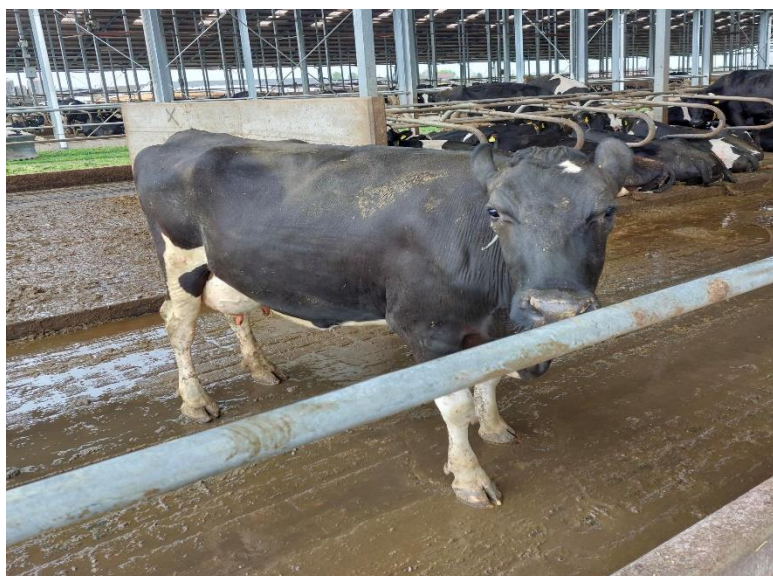
Slika 1. Holstein-frizijsko govedo na farmi Niza d.o.o

Rizične strane intenzivnog korištenja Holsteina su: kratak proizvodni vijek, češća metabolička oboljenja, oboljenja lokomotornog sustava, poteškoće s plodnošću, te relativno niži sadržaj suhe tvari u mlijeku. Odstupanje od idealnih uvjeta dovodi do različitih oboljenja, neplodnosti i preranog izlučenja. Prosječna godišnja proizvodnja mlijeka kreće se od 8.000 do 10.000 kg mlijeka uz prosječan sadržaj mliječne masti od 4,02% i mliječnih proteina od 3,33%. Proizvodnja Holstein krava u Hrvatskoj u 2019. godini u standardnoj (305 dnevnoj) laktaciji iznosila je 8.251 kg uz prosječan sadržaj mliječne masti od 4.1% i mliječnih proteina 3,4%, te interval teljenja od 445 dana (Ivanković i Mijić, 2020.).