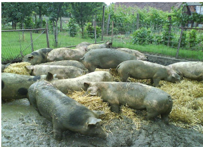
Slika 1. Tov poluotvorenog tipa na OPG-u Mađarević

U neposrednoj blizini se nalazi i objekt tzv. farma tovljenika koji ima i utovarnu rampu preko za transport tovljenika do klaonice. Farma je prenamijenjena za uzgoj za vlastite potrebe, na način da tovljenici borave u takozvanom tovu poluotvorenog tipa što je vidljivo na Slici 1. koja prikazuje tov poluotvorenog tipa na OPG Mađarević.