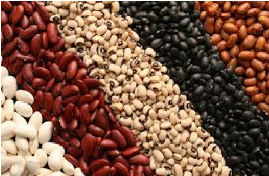
Slika 2. Grah zrnaš