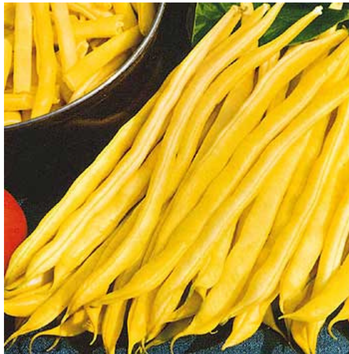
Slika 1. Grah mahunar

S obzirom na visinu stabljike graha, dodatno ga dijelimo na visoki i niski.