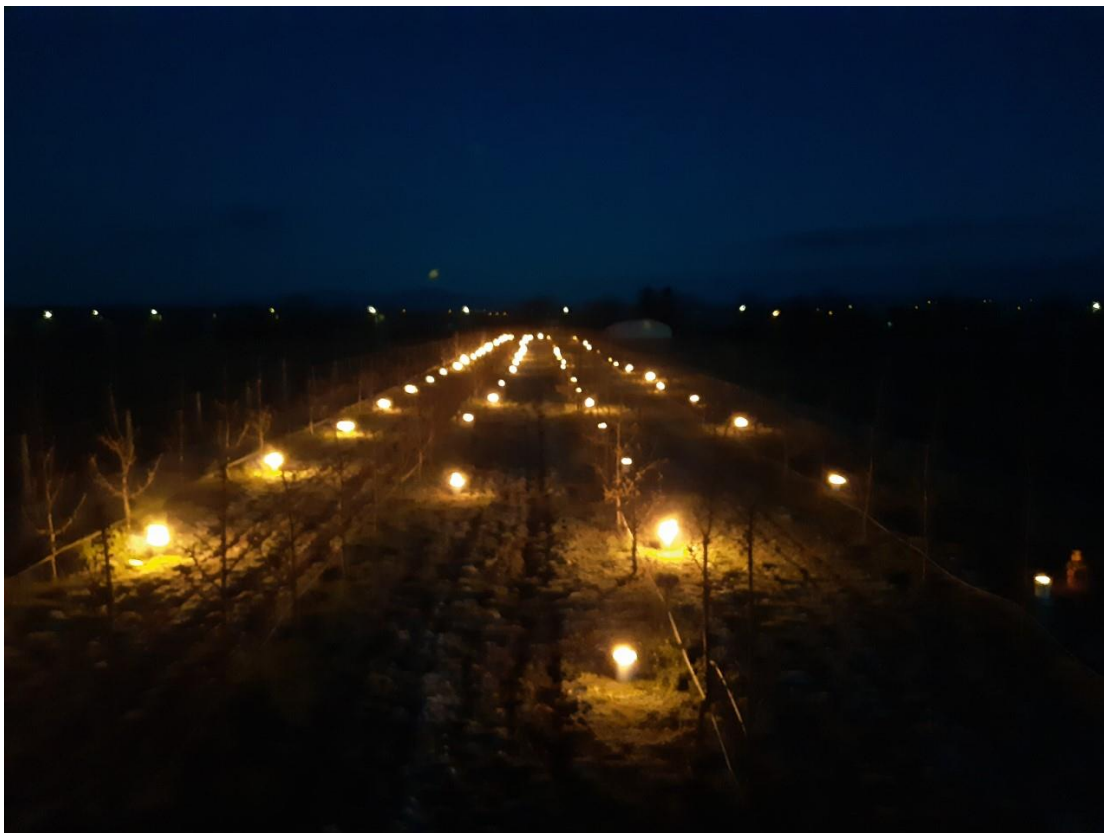
Slika 4 -Stop gel svijeće u nasadu trešanja