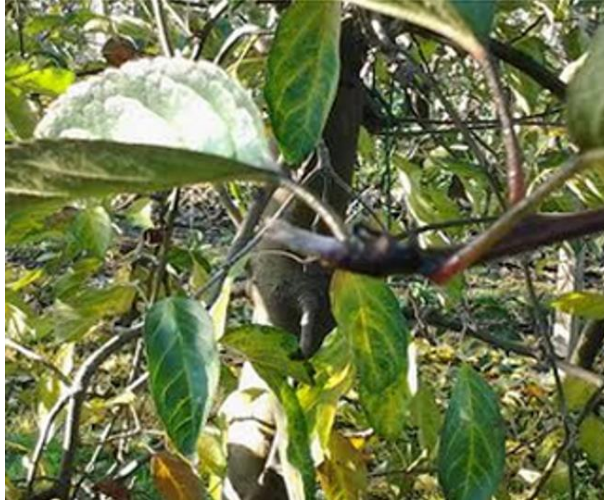
Slika 3. Vršni cvjetni pup jabuke Idared u retro vegetaciji