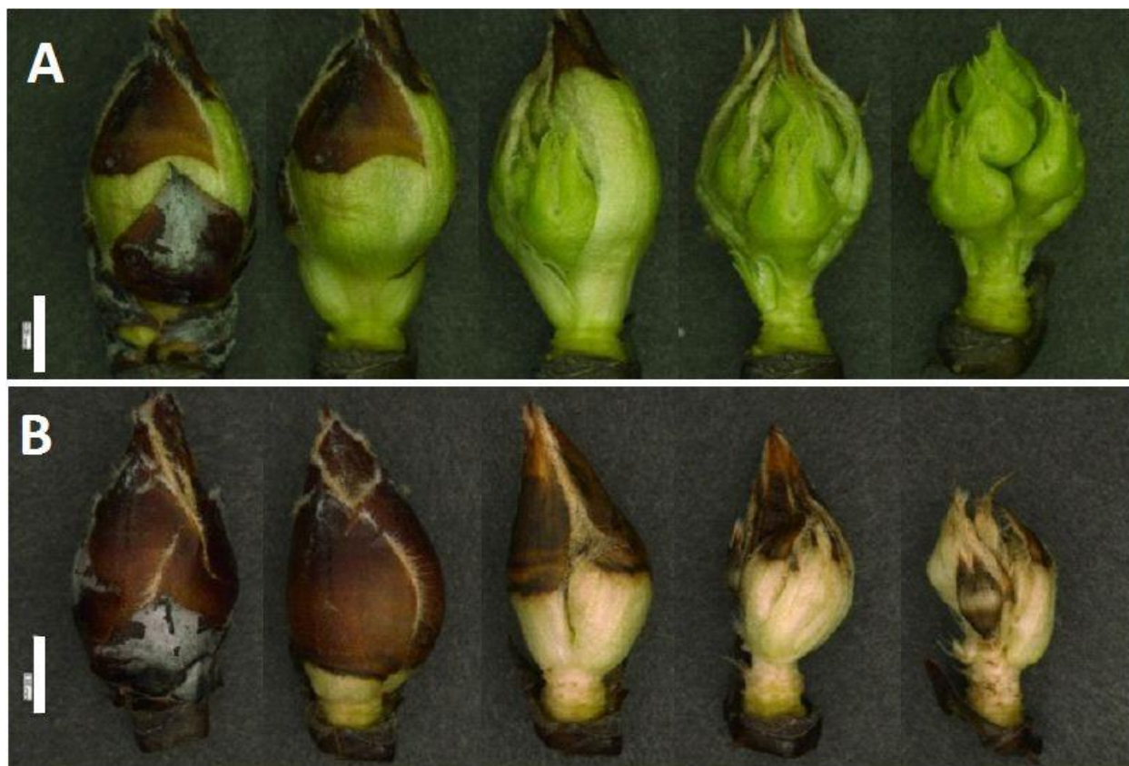
Slika 2. - Fotografije dobivene digitalnim mikroskopiranjem cvjetnih pupova uzorkovanih u veljači na kruškama uzgojenim u prirodnim uvjetima (A) i pod umjetnim uvjetima blage zime (B). S lijeva na desno: normalni pupoljak; nakon uklanjanja 4, 8, svih 12 ljuski i unutarnjih ljuski. (Izvor: Yamamoto, 2010. https://www.intechopen.com/chapters/39171 )

Hawerroth i sur. (2013.) naglašavaju kako je temperatura glavni klimatski čimbenik povezan s mirovanjem jabuka ( Malus domestica Borkh.). Neadekvatna izloženost jabuka potrebnoj sumi hladnih jedinica uzrokuje probleme s kretanjem pupova, što rezultira smanjenjem prinosa. Oni su proveli pokus izlaganja različitim sumama hladnih jedinica na sortama jabuka 'Castel Gala' i 'Royal Gala', cijepljenih na podlogu M7. Bile su izložene temperaturama od 5, 10 i 15 °C u različitim sumama, a nakon izvođenja tretmana biljke su držane u stakleniku na 25 °C. Sorte su različito reagirale na utjecaj sume temperatura tijekom zimskog razdoblja.