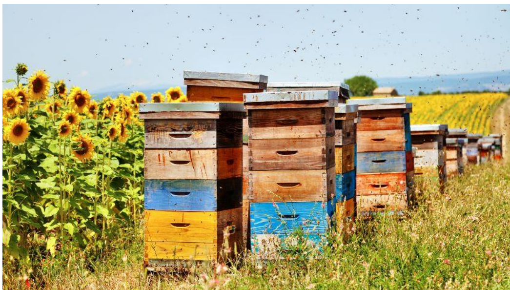
Slika 5. Pčele na ispaši suncokreta

sadržavati od 20000-40000 peludnih zrnaca. Maksimalna kvaliteta nektara cvijeta prisutna je dopodne (9:30h-11:30h). Oplodnja i prinos suncokreta su povećani 30% - 40% ukoliko je prisutno oprašivanje pomoću pčela (Laktić i Šekulja, 2008.). Suncokret je maksimalno iskorištena uljarica, moguće je iskoristiti sve njezine dijelove. Koristi se za proizvodnju jestivog ulja, a u stočarstvu je izvor sačme za stočnu hranu i brašno.