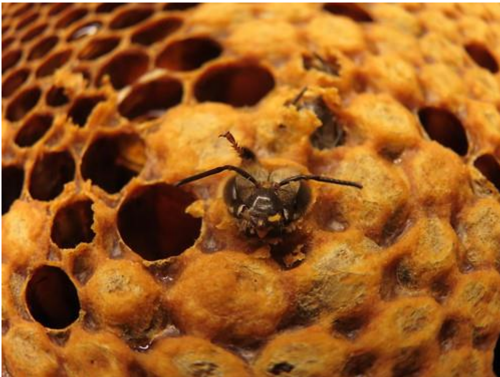
Slika 3. Izlazak pčele iz stanice

Partenogeneza je pojava kod spolnog razmnožavanja, jajna stanica se oplodi spermijem te nastane zigota iz koje se diobama i razvojem razvije nova jedinka. Kod pčela se javlja nepotpuna partenogeneza jer nastaju samo trutovi iz neoplođenih jajnih stanica. Parenje se odvija u proljetnim i ljetnim mjesecima. Matica snese oplođena jajašca u radiličko saće iz kojeg se razvijaju pčele radilice. Četvrtog dana razvije se ličinka koja se prva tri dana hrani matičnom mliječi, desetog dana pčele pokriju ličinke poroznim voštanim poklopcima unutar kojeg se odvija razvoj preko stadija kukuljice u odraslog kukca. Dvadeset i prvog dana razvoj je potpun te mlade pčele izlaze iz stanica tako što progrizu poklopce saća (Laktić i Šekulja, 2008.). Medonosne pčele su zadružni kukci, zajednica se sastoji od matice, radilica i trutova. Matica leže svakodnevno do 2000 jajašaca ujedno je i najveća pčela u zajednici. Radilice imaju najkraći životni vijek, zadužene su za čišćenje, brigu o leglu, građi saća, proizvodnji meda i skupljanju hrane. Trutovi su jedini muški članovi pčelinje zajednice, veći su i deblji od radilica. Njihova osnovna uloga je sparivanje s maticom.