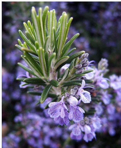
Slika 12. Ružmarin

Ružmarin cvate skoro cijele godine te svojim plavim cvjetovima pruža obilnu nektarnu pašu. Pronalazimo ga najviše na poluotoku Pelješcu i drugim otocima. Mediteranski zimzeleni grm daje kvalitetan med s prepoznatljivim mirisom i okusom (Relić, 2015.).