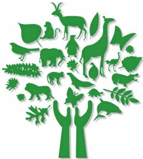
Slika 15. Bioraznolikost

Sažeto, bioraznolikost nam pruža čistu vodu i zrak, plodnije tlo uz oprašivanje usjeva. Ima veliku ulogu u smanjenju utjecaja klimatskih promjena i prirodnih nepogoda. U četvrtome poglavlju je spomenuto da su glavni razlozi gubitka bioraznolikosti: prenamjena zemljišta, izravno iskorištavanje, klimatske promjene, onečišćenje i invazivne strane vrste.