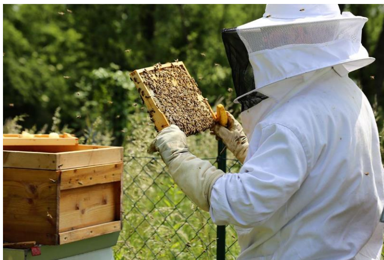
Slika 18. Pčelarstvo

Kada se govori o ekološkom pčelarstvu svi predmeti moraju biti od prirodnih materijala. Prilikom bojanja košnica i ostalih dijelova potrebno je koristiti ekološku boju. Ekološki vosak mora biti materijal od kojega je izrađena satna osnova, ne smije sadržavati žicu i čavlice, ukoliko ih ima trebaju biti izrađeni od inoksa. Najmanja udaljenost od ekološkog i samoniklog bilja, mora biti unutar 3 kilometara od pčelinje zajednice kako bi pčele imale dovoljan pristup nektaru i peludi. Ukoliko postoji proizvodnja koja bi mogla predstavljati onečišćenje okoliša, udaljenost mora biti dovoljno velika. Upotreba antibiotika je zabranjena pri liječenju bolesti pčela. Liječenje, uništavanje nametnika vrši se organskim kiselinama kao što su: oksalna, mliječna, mravlja te pripravcima prihvaćenim u ekološkoj proizvodnji.