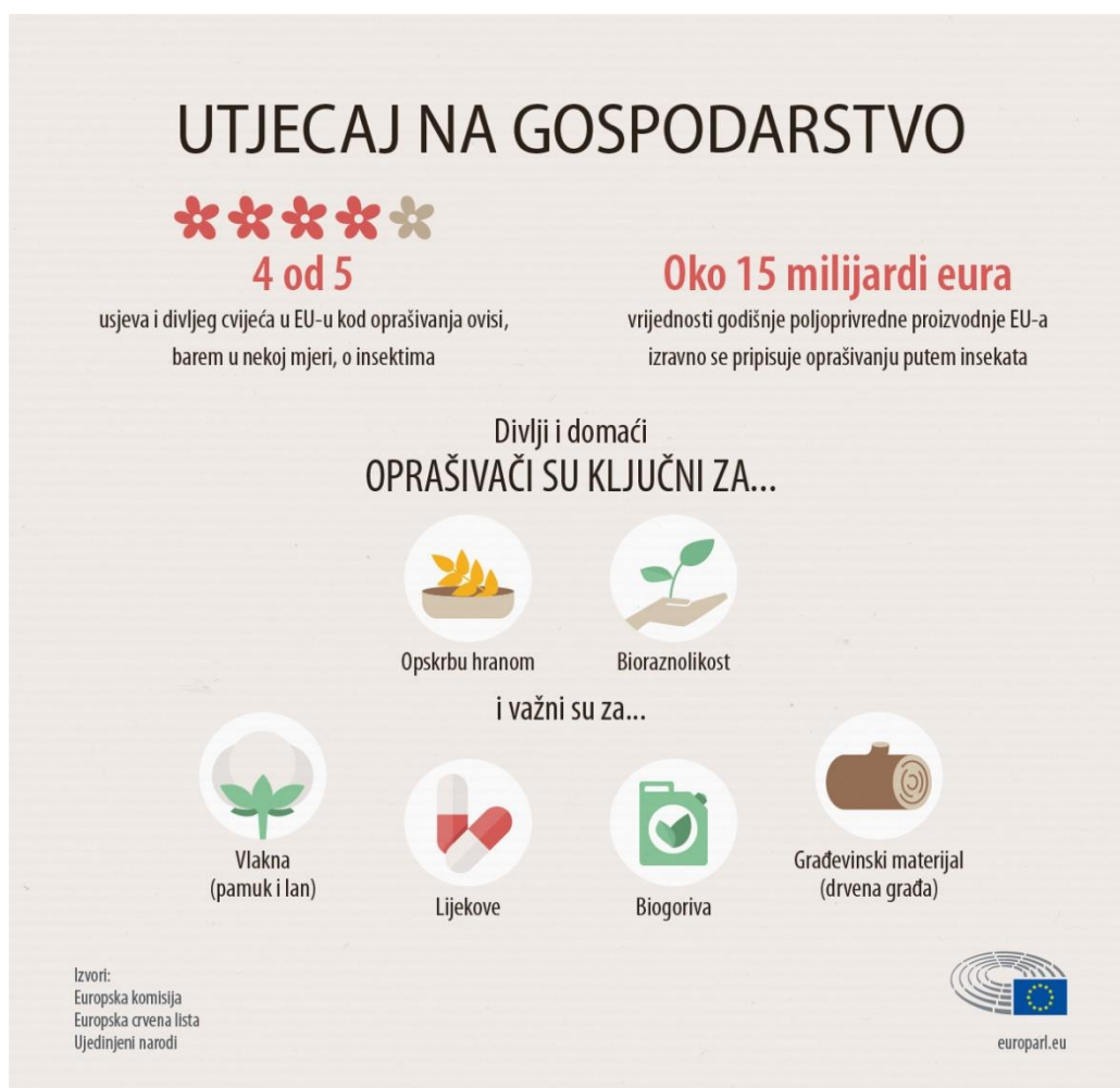
Slika 14. Utjecaj oprašivača na gospodarstvo

nepoštivanja upotreba pesticida i razdoblja tretiranja, ali i same količine pesticida kao zaštite bilja. Na oprašivače utječu pesticidi i drugi zagađivači, insekticidi i fungicidi izravno, a herbicidi neizravno. Neuravnoteženom primjenom kemikalija dolazi do gubitaka pčelinjih zajednica. Smanjen broj pčela u poljoprivrednom sektoru doveo je do smanjene proizvodnje hrane, što predstavlja veliki problem i u drugim sektorima. Veliku ulogu ima i prenamjena zemljišta u poljoprivredne svrhe, kojima dolazi do smanjena prirodnih staništa. Aktivna obrada zemlje vodi ka homogenim površinama zbog kojih nestaju raznolike homogene flore. Smanjuju se i mjesta za gniježđenje i zalihe hrane. Strane invazivne vrste poput žutonogog stršljena i parazitne bolesti izrazito su opasne za pčele. Ekološka poljoprivreda je jedini prihvatljivi oblik poljoprivrede koji ne šteti i ne ubija pčele.