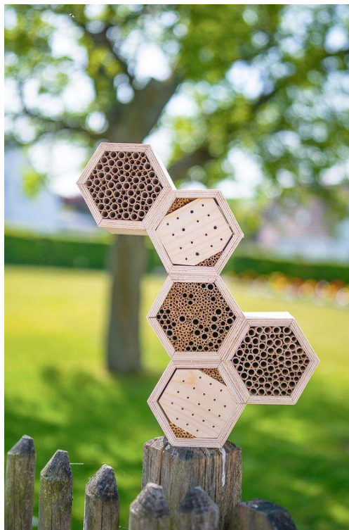
Slika 17. „Hotel“ za pčele

„Hotel“ za pčele pružio bi mjesto gdje se pčele mogu gnijezditi, sakriti od vremenskih neprilika. Pčelin hotel trebao bi biti građen od prirodnih neobrađenih materijala, kako ne bi imao negativan utjecaj na sam život pčele. Trebao bi biti postavljen najmanje metar od tla s rupama različite veličine kako bi privukao oprašivače. Vrlo je vjerojatno da će ih nastaniti solitarne pčele koje ne žive u zajednicama, ali također imaju veliki značaj u oprašivanju.