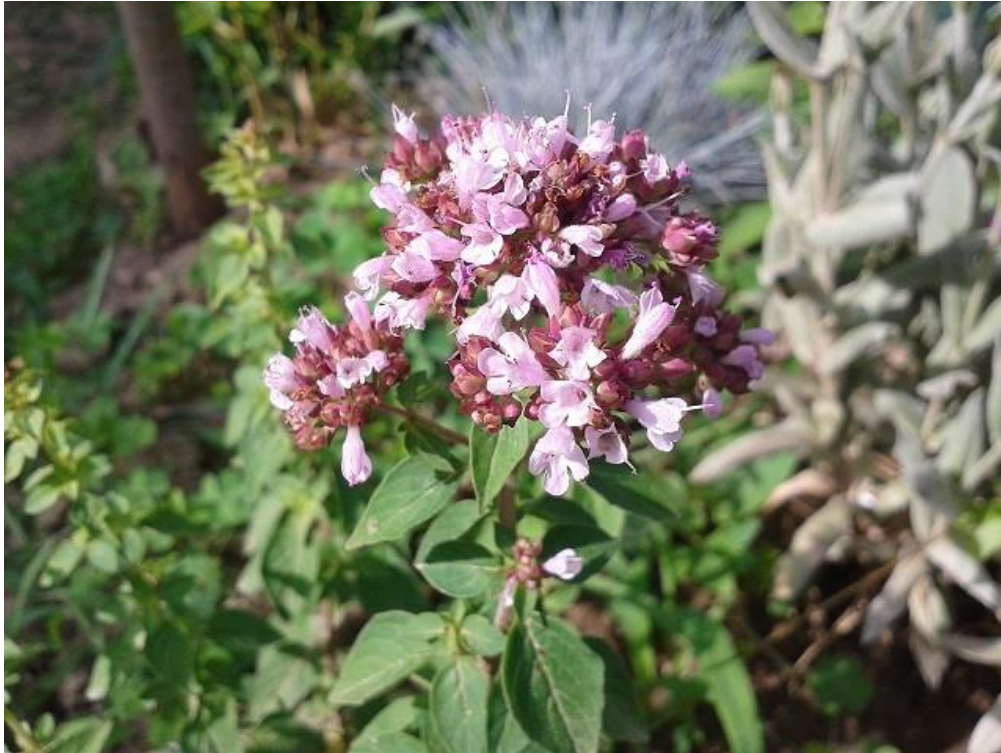
Slika 11. Metvica