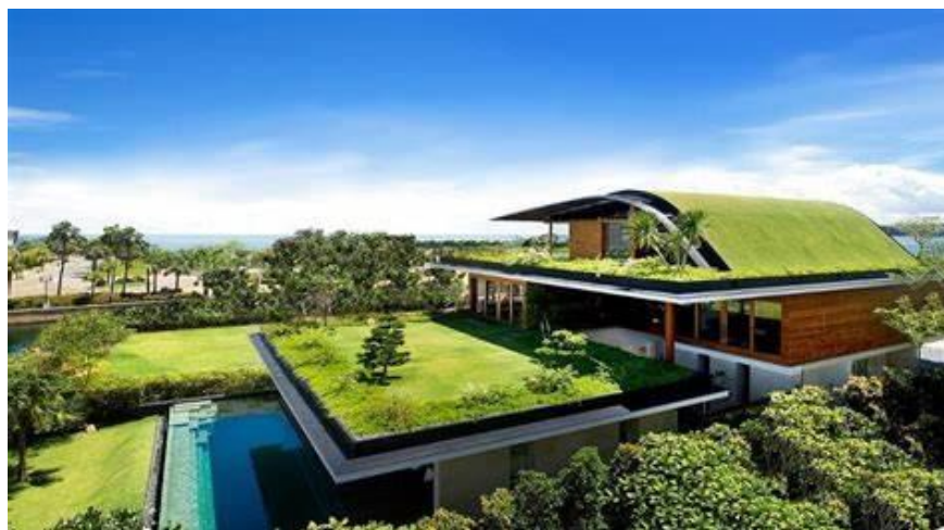
Slika 16. Zeleni krov