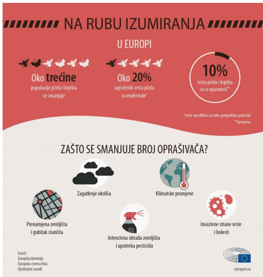
Slika 13. Zašto se smanjuje broj oprašivača?

Sve devijacije u vremenskih prilikama, uključujući i znatne vremenske ekstreme usko su povezane uz klimatske promjene na koje utječe i sam čovjek. Te vremenske neprilike sprječavaju pčele u obavljanju osnovne zadaće oprašivanja bilja.