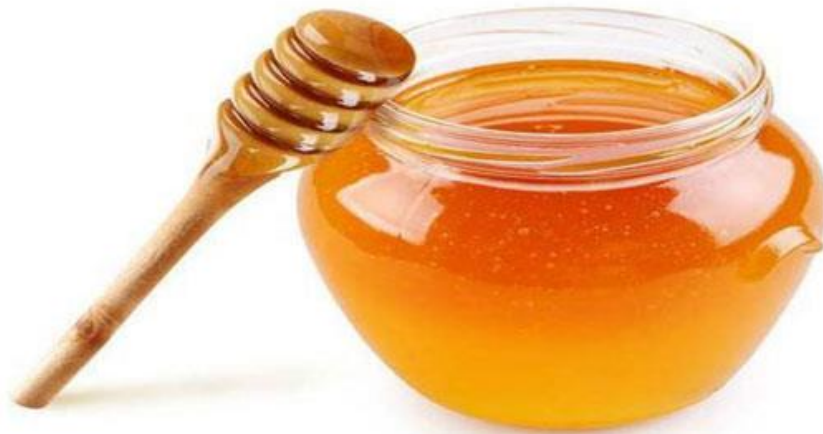
Slika 7. Med

Med uljane repice je svijetlo jantarne boje, približno bijeloj. Ugodne je arome i izraženog okusa. Koristi se za bolesti krvožilnog sustava, normalizira crijevnu mikrofloru te također ima antiseptičko i antibakterijsko djelovanje.