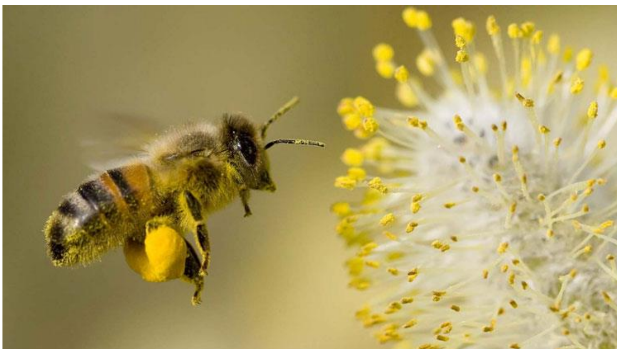
Slika 4. Prijenos peludi

Oprašivanje podrazumijeva prenošenje zrelog peluda s prašnika na njušku tučka. Oplodnju će izvršiti ono peludno zrnce koje je vitalnije. Prijenos peludi u prirodi događa se uz pomoć: insekata (entomofilija), vjetra (anemofilija), vode (hidrofilija), životinja (zooidofilija) te ptica (ornitofilija). U prirodi 80 % biljaka je entomofilno, a to znači da su biljke koje moraju oprašiti insekti i na taj način opstanak velikog broja biljaka ovisi o pčelama i ostalim oprašivačima. Osim za oprašivanje pelud je pčelama važna za vlastiti rast, prehranu legla, formiranje masnog tijela za zimu, sekreciju voska i proizvodnju pčelinjeg otrova (Laktić i Šekulja, 2008.).