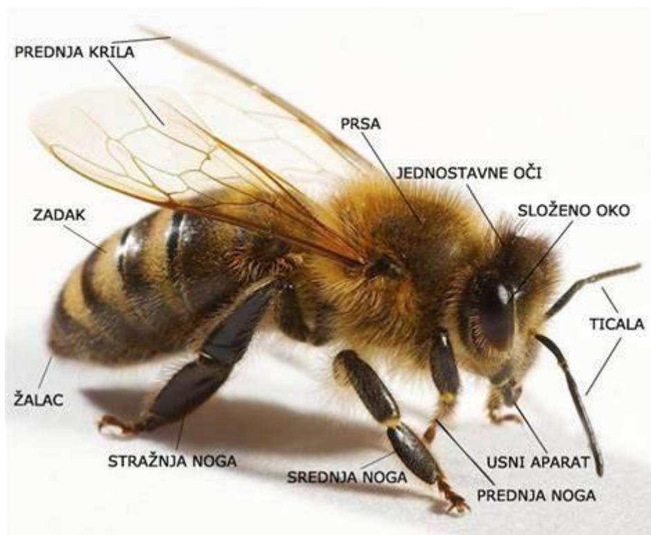
Slika 2. Građa pčele

Glava pčele potpuno je odvojena od ostatka tijela, spojena s grudima tankom hitinskom ovojnicom koja joj daje brzinu i pokretljivost prilikom skupljanja nektara i izgradnja saća. Dva para krila te tri para nogu člankovite građe smještana su na grudima. Pri opterećenju pčela može letjeti brzinom od 15 do 30 km/h, pčela bez opterećenja postiže brzinu leta i do 65 km/h. Glavni dio probavnog i živčanog sustava, krvožilnog sustava, dišnog sustava, spolni organi te sustav za izlučivanje štetnih tvari iz organizma nalaze se u zatku. Pčelinji vid građen je od dvije vrste očiju, od tri jednostavna oka s po jednom lećom koja daje samo obavijest o smjeru i intenzitetu svjetla i još dva složena oka koja su građena od 4000-5000 omatida čije se optičke osi ne fokusiraju samo u jednoj točki. Pčela ima vrlo malo mrtvih kutova jer je vidno polje pčele gotovo 360°. Ticala koja su člankovite građe imaju na površini okrugle rupice ispod kojih su smještene osjetilne stanice njuha, pomoću kojih se mogu orijentirati na male udaljenosti. Žalčani aparat građen je od velike i male otrovne žlijezde, triju listića, futrole sa žljebićem te srpolikog žalca s nazubljenim vrhom (Laktić i Šekulja, 2008.).