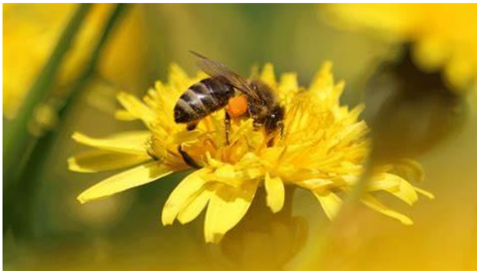
Slika 10. Maslačak

Šuplja stabljika maslačka je visine oko 20 centimetara na čijem vrhu se nalazi cvijet. Maslačak ima cvijet u obliku glavice koji je građen od 100 do 200 jezičastih cvijetića karakteristične jarko žute boje. Pripada najrasprostranjenijim višegodišnjim biljkama. Cvijeta od ožujka do listopada, a kada je nepogodno vrijeme cvjetovi štite nektar i pelud tako što se zatvaraju. Izrazito je važan u pčelarstvu zbog ranog cvata, te značajne količine peludi koju pčele mogu prikupiti čak i kada biljka ne luči nektar (Relić, 2015.).