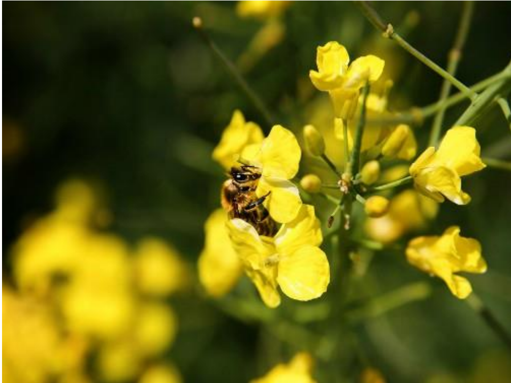
Slika 6. Pčela na cvijetu uljane repice