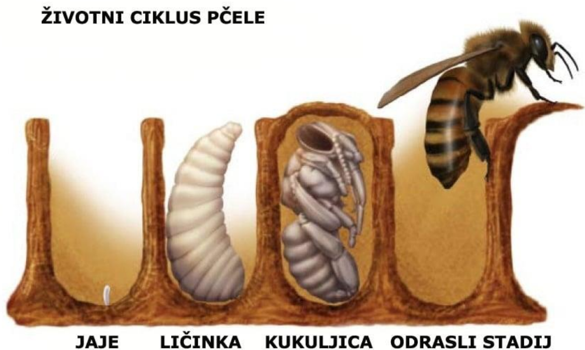
Slika 1. Životni ciklus medonosne pčele

Navedeni stadiji obuhvaćaju embrionalni i postembrionalni razvoj medonosne pčele.