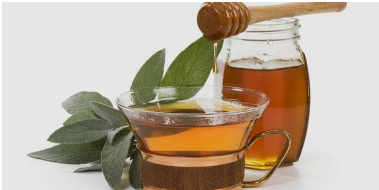
Slika 9. Kaduljin med

Uz izrazitu ljekovitost kadulja je i vrlo medonosna biljka, koja raste pretežno u Dalmaciji i Hercegovini. Njezin oblik se formira iz korijena s više stabljika do 60 centimetara visine. Cvijet je ljubičaste boje, a cvate u svibnju i lipnju, stoga spada u glavnu pčelinju pašu. Tijekom cvjetanja ukupan unos može dosegnuti i do 50 kilograma meda. Med ugodnog okusa i mirisa te značajne kvalitete vrlo je tražen na tržištu (Relić, 2015.).