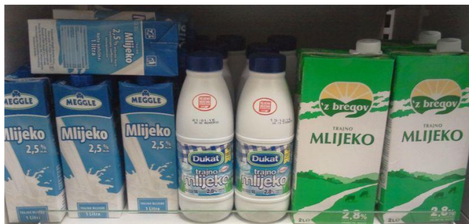
Slika 10. Ambalaža

Mlijeko je proizvod podložan kvarenju, pa je nužno da bude zaštićeno određenom ambalažom i pakiranjem. Transportna ambalaža štiti mlijeko od utjecaja nečistoća, mikroorganizama, svjetlosti i topline, odnosno čuva kakvoću mlijeka. Osim zaštitne potrebno je istaknuti i promotivnu funkciju pakiranja.