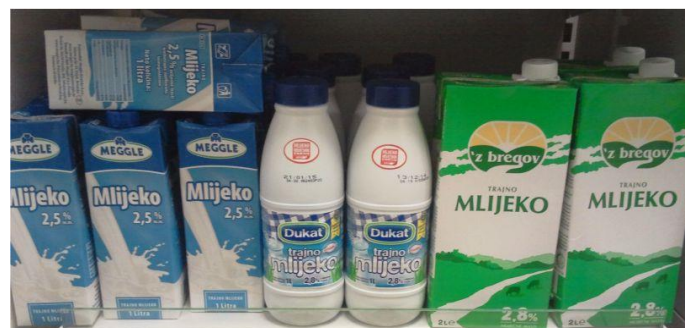
Slika 10. Ambalaža

Mlijeko je proizvod podložan kvarenju, pa je nužno da bude zaštićeno određenom ambalažom i pakiranjem. Transportna ambalaža štiti mlijeko od utjecaja nečistoća, mikroorganizama, svjetlosti i topline, odnosno čuva kakvoću mlijeka. Osim zaštitne potrebno je istaknuti i promotivnu funkciju pakiranja.