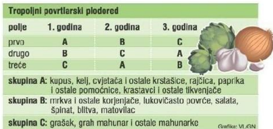
Slika 4. Povrtlarski plodored