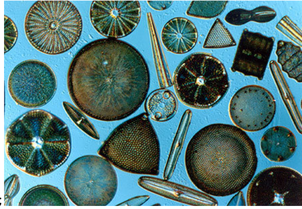
Slika 5. Različite vrste dijatoma