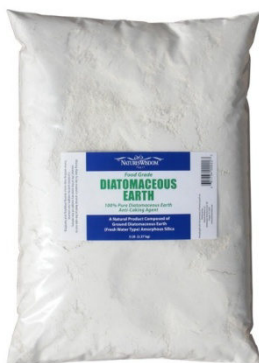
Slika 6. Komercijalni pripravak na osnovi dijatomejske zemlje