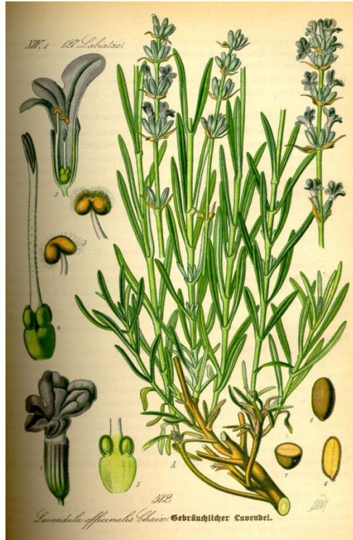
Slika 2. Nadzemni dio lavande