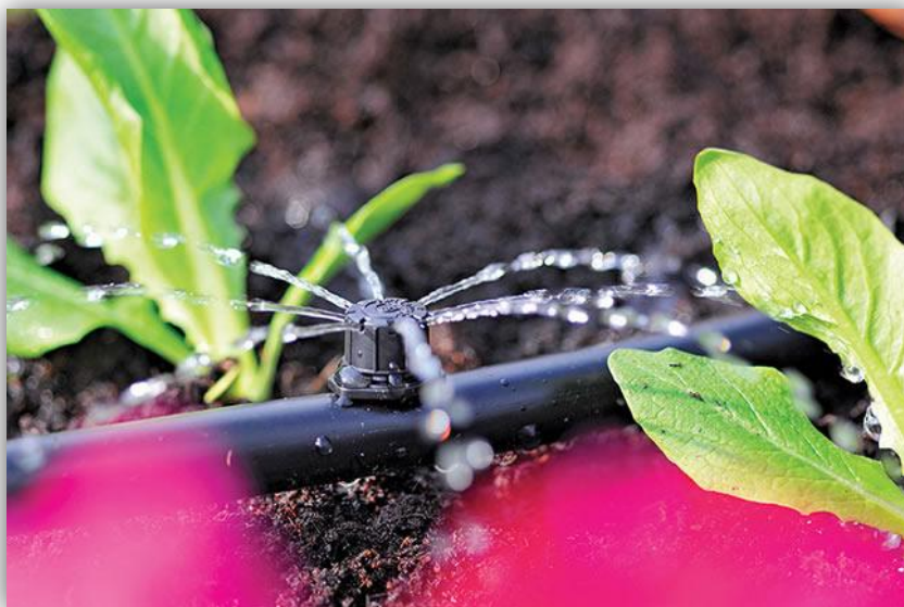
Slika 6. – Jedna od mnogo vrsta kapljača (minirasprskivač)

ovisno o gustoći sklopa. Kod povrća, cvijeća i voćnih sadnica oni su mnogo gušće postavljeni, a u trajnim nasadima voća rjeđe. Mogu se ugrađivati kao sastavni dio lateralne cijevi – onda su to "linijski" kapljači ili sa strane cijevi takozvani "bočni" kapljači.