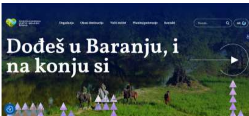
Slika 14. Početna stranica TZ Osječko-baranjske županije

Konj, kao poveznica tradicijskog i suvremenog načina života, zauzeo je značajnu ulogu u ruralnom turizmu kao turističkom proizvodu. Na području Osječko-baranjske županije se povećava broj udruga i obiteljskih gospodarstava koji turistima nude različite programe povezane s konjičkim turizmom. Očuvan i raznolik krajobraz te prirodne i kulturne znamenitosti uz prepoznatljivu gastronomiju, preduvjet su za razvoj raznih specijalnih vrsta turizma, od kojih se izdvaja konjički turizam.