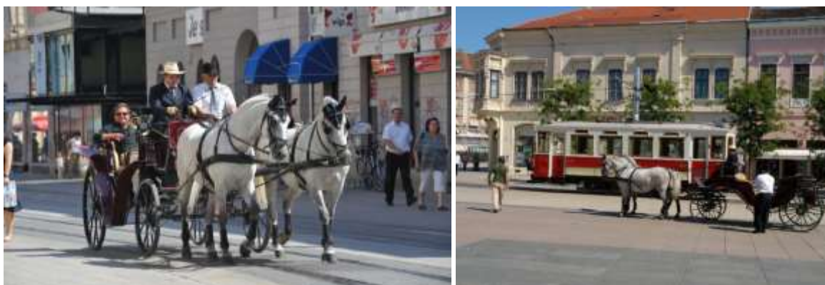
Slika 2. Fijaker na ulicama Osijeka

Rekreacijsko jahanje se provodi i putem edukacijskih kampova.