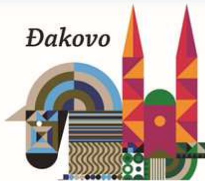
Slika 12. Promotivni logo Đakova s grafički stiliziranim prikazom lipicanca i katedrale, simbola Đakova