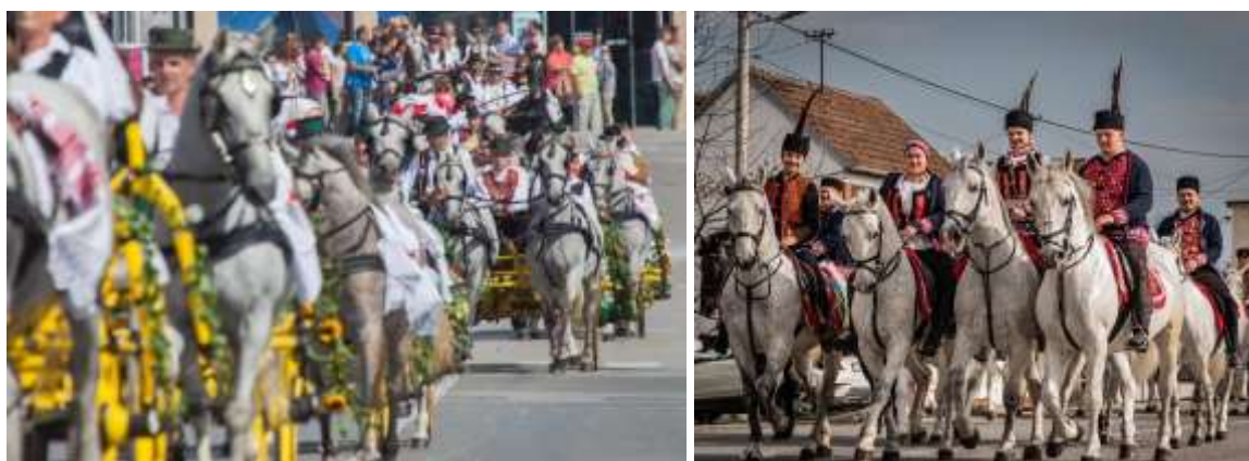
Slika 8. Lipicanci na svečanom mimohodu Vinkovačkih jeseni, lijevo i na pokladnom jahanju, desno

Manifestacija „Vinkovačke jeseni“ održava se svake godine sredinom rujna od 1966. godine u Vinkovcima, a okuplja folklorne skupine i pjevače i plesače iz cijele Hrvatske. U sklopu manifestacije čija je osnovna misija državna smotra izvornog hrvatskog folklor održavaju se razni edukativni i zabavni sadržaji poput „Maratona lađi“ na Bosutu. Neizostavni dio svečane povorke koja prolazi Vinkovcima zadnji dan manifestacije čine i konjske zaprege i jahači odjeveni u tradicijsko ruho čime se promovira tradicijska uloga konja u Slavoniji.