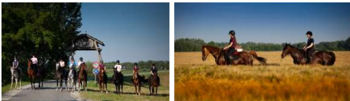
Slika 13. Terenska jahanja kao najljepši jahaći izlet na konjima

Od 2018. godine KK „Hercules“ je punopravna članica Hrvatskog konjičkog saveza, što im je omogućilo organiziranje polaganja jahaćih dozvola i natjecateljskih licenci svake godine, te sudjelovanje na natjecanjima na državnoj razini. Uz školu jahanja, terapijsko i sportsko jahanje, Klub provodi program turistički atraktivnog rekreacijskog jahanja tijekom cijele godine u vidu vikend tura za početnike kao i terensko i daljinsko jahanje uz vodiča i vožnje kočijom uz jedinog licenciranog vodiča u Osječko-baranjskoj županiji. Jahači obilaze staze na području Vardarca i Kopačkog rita, za koje Klub ima odobrenje Javne ustanove Park prirode Kopački rit (za kretanje po području Parka) kao i suglasnost tvrtke „Hrvatske šume“ d.o.o. za kretanje područjima šumskog gospodarenja.