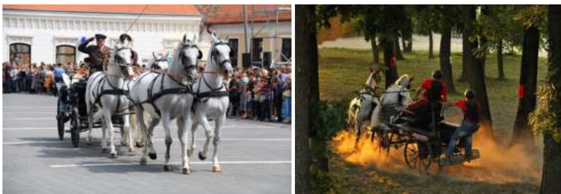
Slika 4. Lipicanci Državne ergele Đakovo u svečanom mimohodu Đakovačkih vezova (lijevo), te na utakmici u vožnji dvoprega (desno)

„Đakovački vezovi“ su najpoznatija folklorna manifestacija u Republici Hrvatskoj, a održavaju se od 1967. godine. Završna ceremonija manifestacije predstavlja svečani mimohod sudionika koji se održava prve nedjelje u srpnju. U svečanom mimohodu se predstavljaju kulturno–umjetnička društva te svečano uređene zaprege s posadom u narodnim nošnjama i jahačima koje predvode četveropreg i jahači Državne ergele u Đakovu. Uz programe koji predstavljaju tradicijsku kulturu, za vrijeme trajanja Đakovačkih vezova na hipodromu Državne ergele Đakovo se održavaju natjecanja „Nagrada Ergele Đakovo“ za jednoprege i dvoprege.