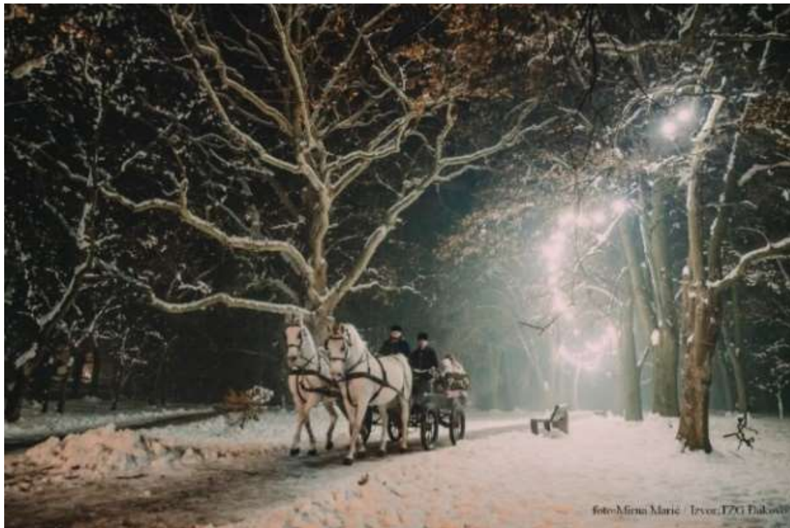
Slika 11. Vožnja fijakerom tijekom Adventa

U Pastuharni u Đakovu su smješteni pastusi za dresurno jahanje te vožnju jednoprega, dvoprega i četveroprega. Korabi i sur. (2017., 2019.) navode da kulturno-folklorne manifestacije imaju osnovnu djelatnost, a to je očuvanje genetskoga potencijala lipicanske pasmine i korištenje vrhunskih grla u zaprežnome i dresurnom sportu. Konjičke predstave održavaju se tijekom cijele godine, a tematske predstave odnose se na Božićni bal lipicanaca, Đakovačke vezove, Uskrs na Ergeli Đakovo, Dane otvorenih vrata i Manifestaciju Sv. Huberta, kao i na vožnje kočijama i zapregama te razne ponude i programi za djecu (Deže i sur., 2019.). Posebna ponuda je najam konja i fijakera za vjenčanja pod nazivom „U zajednički život fijakerom i lipincima“. Ergelu godišnje u prosjeku posjeti oko 20 000 turista kojima se u pastuharni pruža mogućnost obilaska štala, jahaonice, vanjskoga hipodroma, šetalice za konje, terena za dresurno jahanje, te mogu vidjeti fijakere za sportsku zaprežnu vožnju. Vrijeme trajanja obilaska traje između trideset i četrdeset i pet minuta. Programi su prilagođeni djeci vrtićkog uzrasta, obiteljima s djecom, učenicima osnovnih i srednjih škola, umirovljenicima te stručnim ekskurzijama.