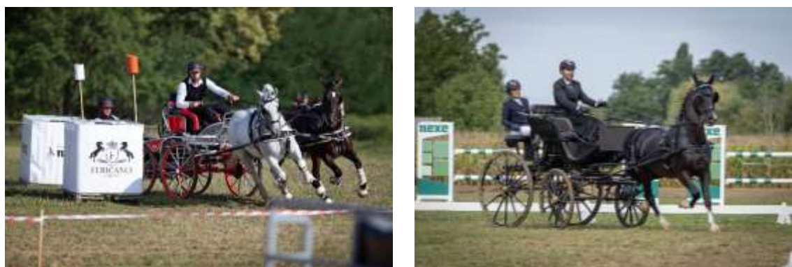
Slika 10. Međunarodno natjecanje u vožnji jednoprega, dvoprega i četveroprega u organizaciji Konjičkog kluba NEXE, Feričanci

Konjički klub NEXE je u Feričancima 2023. godine drugi puta organizirao trodnevni turnir CAN - A, međunarodno natjecanje u vožnji jednoprega, dvoprega i četveroprega te završnicu Otvorenog seniorskog i juniorskog prvenstva Republike Hrvatske u vožnji jednoprega i dvoprega. Cilj kluba je složiti jedan dobar tim koji će se baviti natjecanjima te popularizirati Feričance i ovu vrstu sporta. Budućnost ergele je u reprodukcijском dijelu. Na feričanačkoj ergeli se uzgajaju konji KWPN pasmine (nizozemski kraljevski toplokrvni konj) uvezeni iz Nizozemske, Belgije i Njemačke.