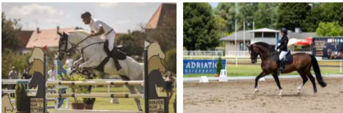
Slika 9. Preponsko natjecanje u Konjičkom klubu Osijek (lijevo) i natjecanje u dresurnom jahanju (desno)

U Državnoj ergeli Đakovo se održavaju konjička natjecanja: