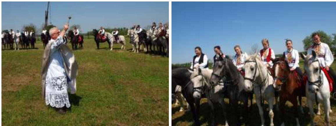
Slika 3. Koška, „Posvetio sam o Đurđevu konje“

Na dan sv. Juraja, 23. travnja, odnosno, kako se i danas u Koški kaže, „na Đurđevo“, sve do kraja sedamdesetih godina prošloga stoljeća se održavao blagoslov konja iz toga dijela Slavonije. Konji su se blagoslovili radi zaštite od nedaća: bolesti, ujeda otrovnih životinja, ozljeda, te radi osiguravanja njihove snage i plodnosti. Revitalizaciju blagoslova konja o Đurđevu u Koški i organizaciju manifestacije „Posvetio sam o Đurđevu konje“ inicirala je Konjogojska udruga Koška 2010. godine. Članovi Udruge su uredili zapuštenu livadu u blizini mjesne crkve i na njoj su izgradili kapelicu s kipom Svetog Đurađa. Nakon blagoslova koji župnik udijeli konjima i njihovim vlasnicima, konjanici i zaprege kapelu obilaze tri puta. Ministarstvo kulture i medija je 2017. godine upisalo običaj u Registar nematerijalne baštine Republike Hrvatske (Vrbanić i sur., 2017.).