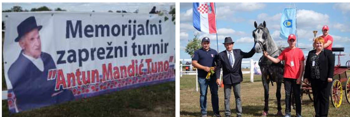
Slika 6. Memorijalni zaprežni turnir „Antun Mandić Tuno“

Konjička manifestacija se održava u spomen staromu i istaknutom konjogojcu Antunu Mandiću Tuni, te se u njegovu čast održava turnir u vožnji dvoprega i jednoprega u Čepinu. Uz stol ukrašen peharima stoji i stolica s ležerno postavljenom Tuninom šokačkom rekljom (štrikanac bundur) i obaveznim šokačkim šeširom.