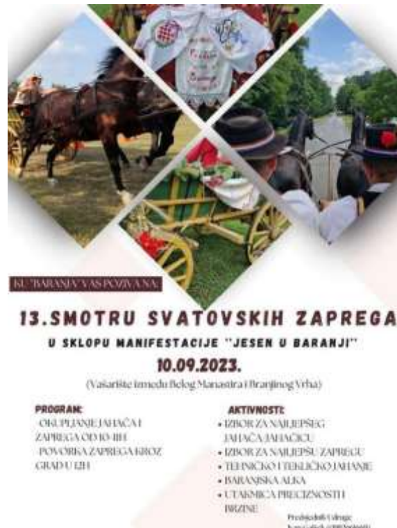
Slika 5. Plakat za 13. Smotru svatovskih zaprega u sklopu manifestacije „Jesen u Baranji“, 2023., TZ Baranja

„Jesen u Baranji“ je kulturno–folklorna manifestacija koja je svake jeseni organizirana u Belom Manastiru. Održavanje manifestacije je započelo 2003. godine, a održava se početkom rujna. Cilj manifestacije je promovirati kulturnu baštinu i bogatu turističku ponudu Baranje. U sklopu ove manifestacije Konjogojska udruga ”Baranja” iz Branjinog Vrha u suradnji s Turističkom zajednicom Baranje i Gradom Belim Manastrom organizira smotru svatovskih zaprega. Manifestacija se održava na vašarištu između Belog Manastira i Branjinog Vrha. Povorka zaprega i jahača prolazi ulicama Belog Manastira, a zatim se održava izbor najljepšeg jahača i jahačice te najljepše zaprege. Natjecateljski dio manifestacije uključuje tehničko i tekličko jahanje, Baranjsku alku te utakmicu preciznosti i brzine.