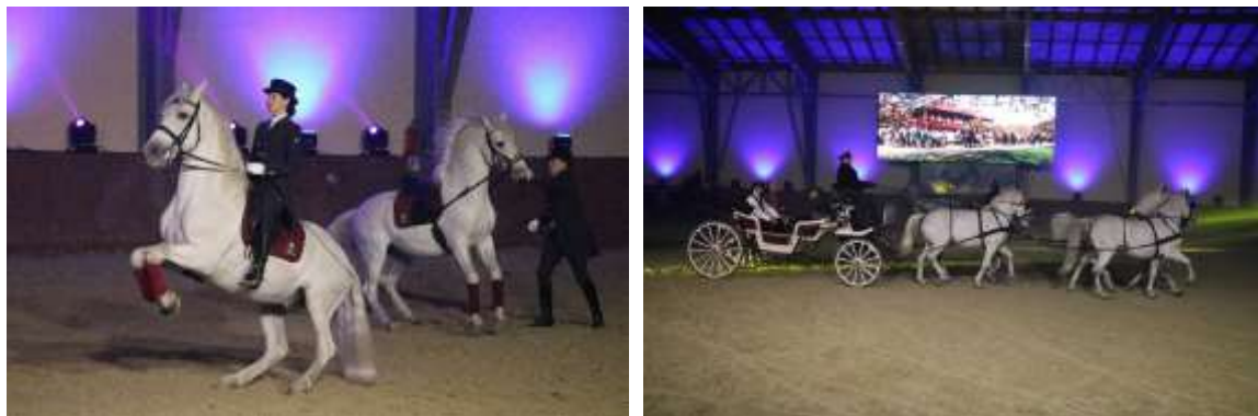
Slika 7. Božićni bal lipicanaca na Državnoj ergeli Đakovo

„Božićni bal lipicanaca“ je glazbeno-scenska predstava s konjima, jahačima, vozačima i statistima koju u prosincu organizira Državna ergela Đakovo u zatvorenoj jahaonici ergele u Đakovu. Predstava bajkovite tematike se održava u vrijeme Adventa te iz godine u godinu, radi svoje atraktivnosti, privlači sve više gostiju iz Hrvatske, ali i susjednih zemalja. Zahtjevne točke predstave se vježbaju godinama jer su potrebni potpuna kontrola i povjerenje između jahača i konja jer se konja stavlja u neprirodno, svjetlosno i glasno okruženje. Scenografkinja „Božićnog bala lipicanaca“ je Zvezdana Klarić, predsjednica udruge „Nobiles de Croatia“.