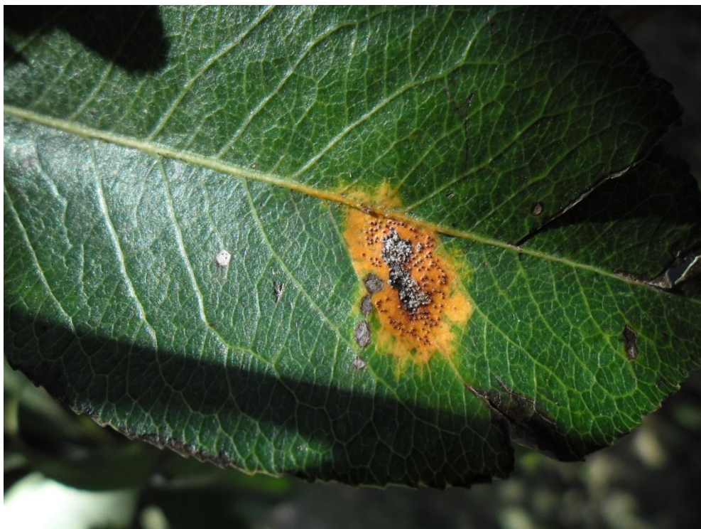
Slika 8d. Kruškin pikac na listu kruške