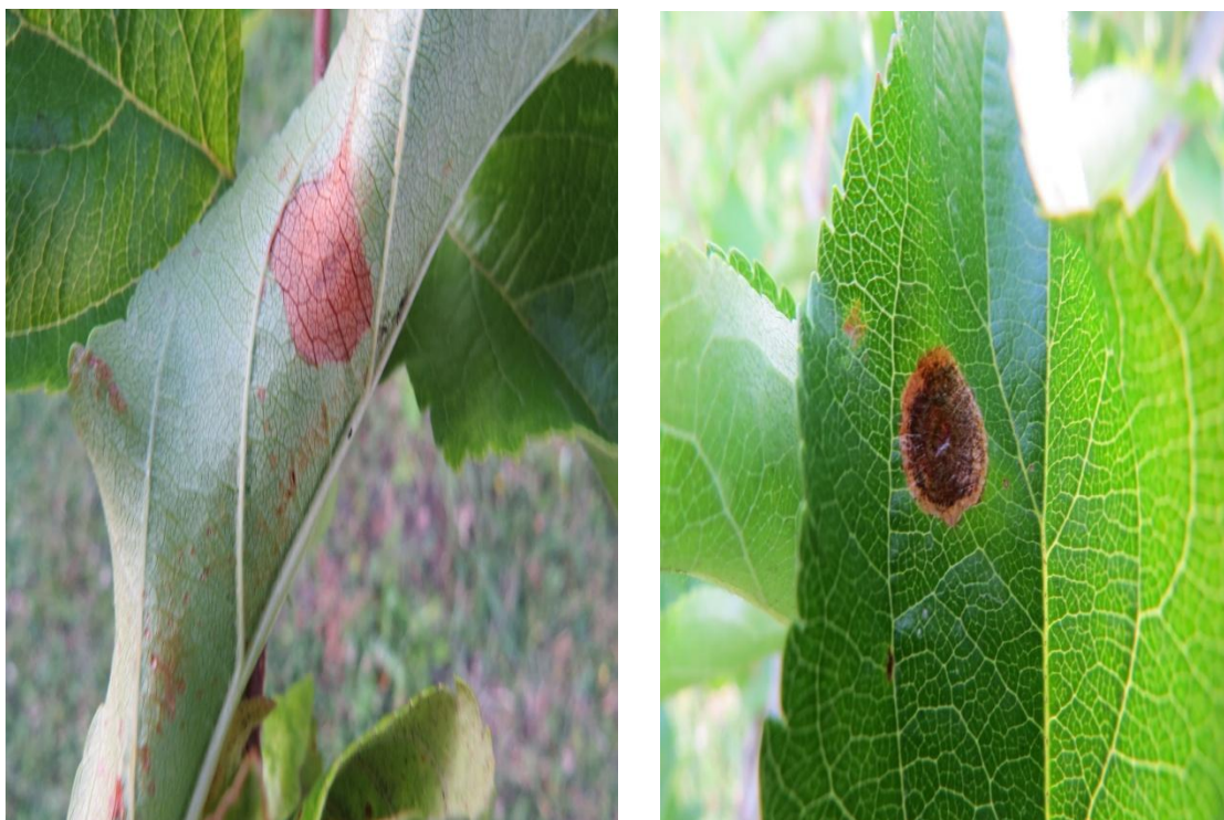
Slika 5b. Štete na licu i naličju lista od lisnih minera