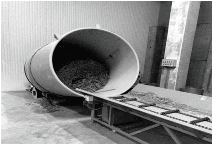
Slika 2. Uređaj za usitnjavanje sojine slame Figure 2 Device for shredding soybean straw