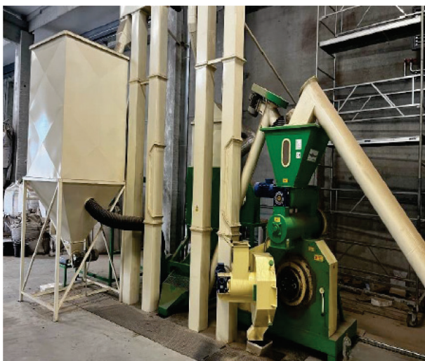
Slika 5. Preša i spremnik za agropelete

Nakon završetka kondicioniranja slama se doprema u prešu (Slika 5.) iz koje izlaze agropeleti u spremnik. Kako je ranije navedeno, zbog trenja između agropeleta dolazi do njihovog zagrijavanja te se agropeleti dopremaju u spremnik za hlađenje. Nakon što se agropeleti ohlade, mogu se pakirati ili odmah koristiti kao ogrjevni materijal. Trenutno proizvode agropelete samo za vlastite potrebe, a budući da nemaju dovoljnu količinu bala sojine slame, iste otkupljuju od OPG-a Saša Jeličić.