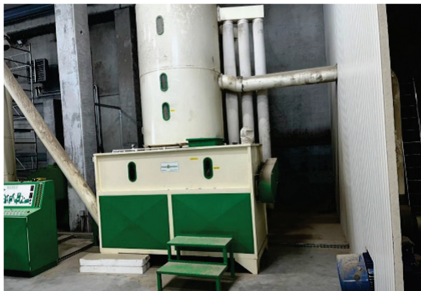
Slika 3. Mlin sa sitom Figure 3 Mill with sieve