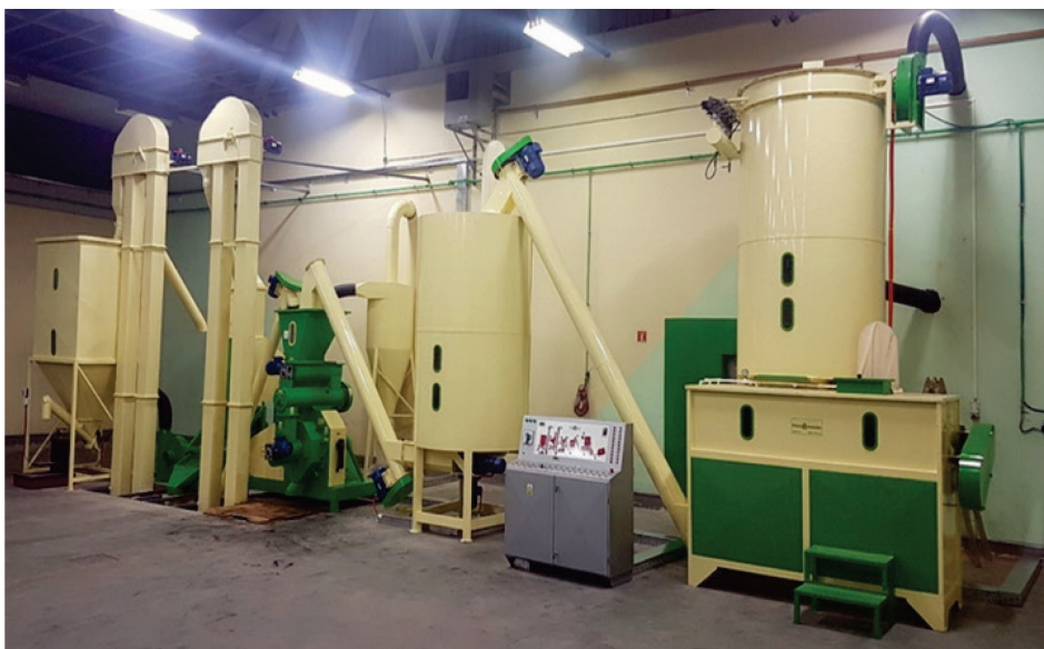
Slika 1. Postrojenje za proizvodnju agropeleta Figure 1 Facility for agro pellet production

odvija se u nekoliko faza: sušenje, sjeckanje, zbijanje, hlađenje, pakiranje i skladištenje (Debeljak, 2018.). Osušena slama u balama postavlja se u uređaj za usitnjavanje (sjekač), koji je prikazan na slici 2. Slama se usitnjava s tri noža do dužine od 5 do 6 cm. Noževi su raspoređeni na način da se dobiju kvalitetni i jednoliki oblici. Slama se nakon sječenja odvodi do mlina (Slika 3.) uz pomoć zračne struje. Mlin se sastoji od više izmjenjivih sita, a prilikom proizvodnje agropeleta na ovom gospodarstvu koriste sito promjera 7 mm. Kako bi se pojačala kalorijska vrijednost agropeleta, u mlin se dodaje lomljeno zrno kukuruza i ostaci nakon sušenja zrna. Ako je slama presušena, u mlin se dodaje oko pola litre vode kako bi se poboljšalo mljevenje i miješanje. Iz mlina, uz pomoć pužnog transportera, sojina slama i dodaci transportiraju se u kondicioner (Slika 4.a) uz koji se nalazi upravljačka ploča (Slika 4. b). Za uspješan proces potrebno je nekoliko puta ponoviti postupak mljevenja kako bi se dobila dovoljna količina potrebnog materijala za proizvodnju agropeleta.