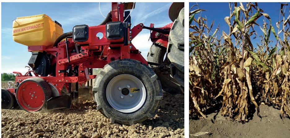
Slika 1. Sijačica MaterMacc Twin Row-2 (lijevo) i hibrid kukuruza KWS Smaragd (desno)

540 min -1 , tj. pri 4 200 min -1 vratila ventilatora. Na ovaj način s popunjenom sjetvenom pločom ostvaren je podtlak od 4,661 kPa na otvoru sjetvene ploče. Kod sijačice MaterMacc Twin Row-2 pri korištenju 540 min -1 PVT-a, kod popunjene sjetvene ploče n=12 , ostvaren je podtlak od 4,713 kPa. Poljska istraživanja tj. sjetva hibrida obavljena je kroz pet vegetacijskih godina (od 2016. do 2020. god.) na dva pokušališta, Jakšić i Lužani.