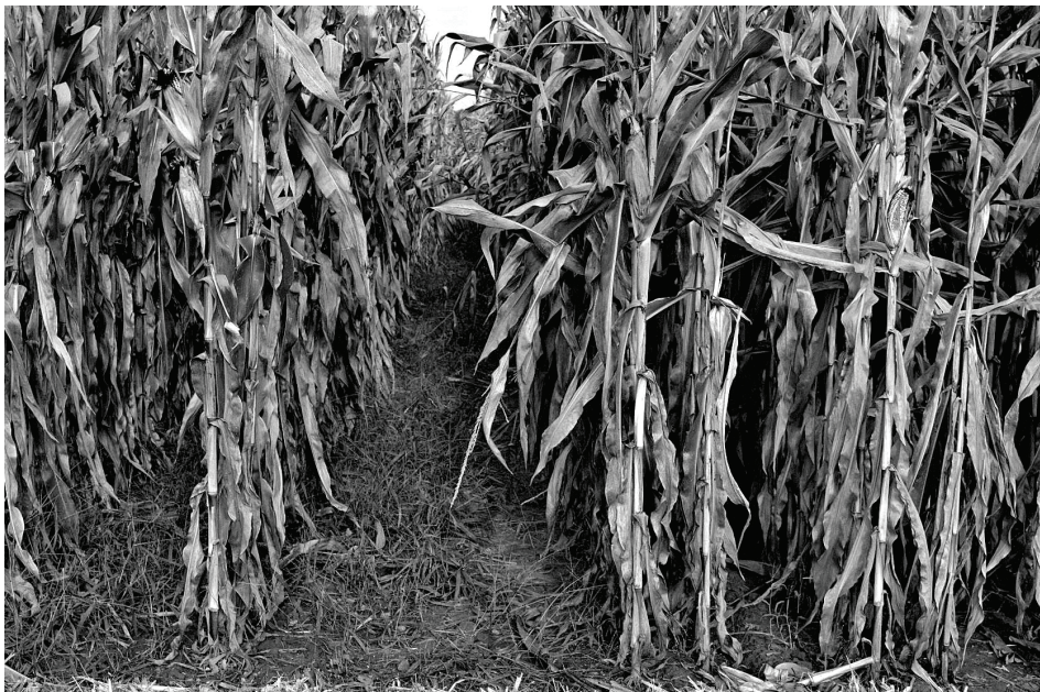
Slika 1. Standardna sjetve i sjetva u udvojene redove hibrida P0023 Figure 1 Standard sowing and sowing in twin rows of hybrid P0023