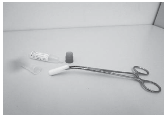
Slika 1. Uzimanje uzorka sline pomoću tampon vate (a) i oprema (b) (Salivette Cortisol, code blue) Picture 1 Sample collection with a buffer pad (s) and equipment (b) (Salivette Cortisol, code blue)