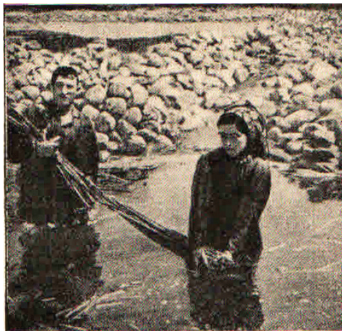
Slika 1. Močenje stabljike konoplje (Mendekić, 1946.)

Picture 1 Wet processing of hemp stem (Mendekić, 1946)