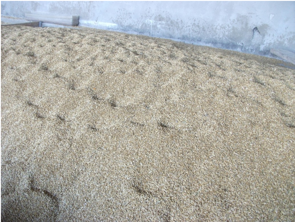
Slika 13. Uskladišteni ozimi ječam na istraživanom OPG-u