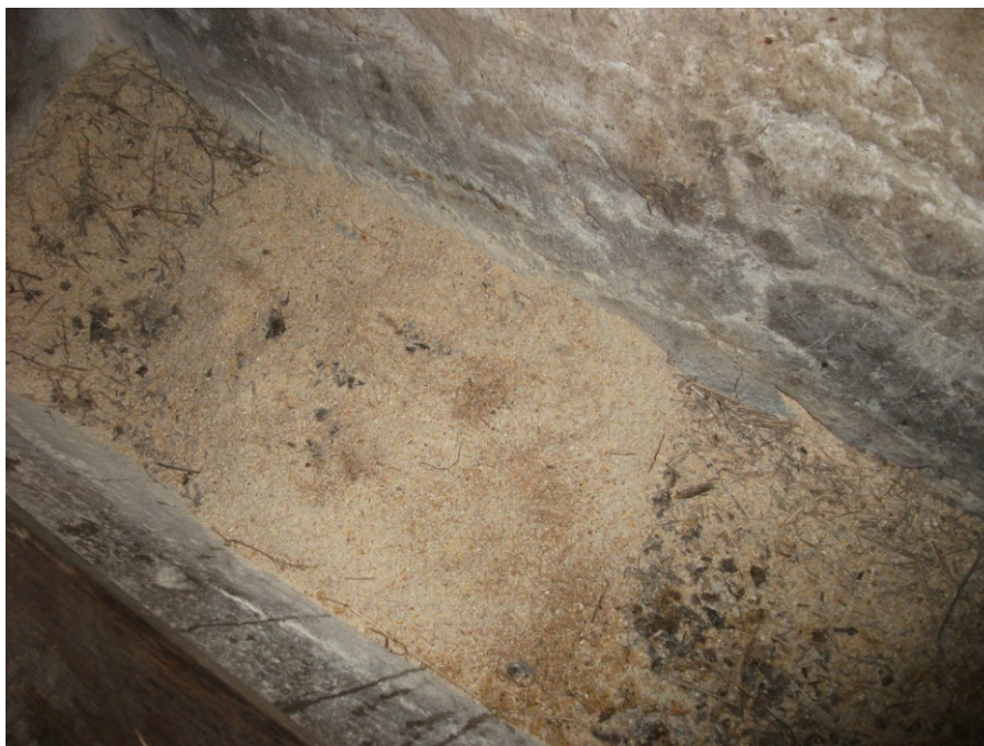
Slika 21. Prikaz ponuđene silaže i samljevenog kukuruza, tritikalea, ječma i koncentrata u valovu