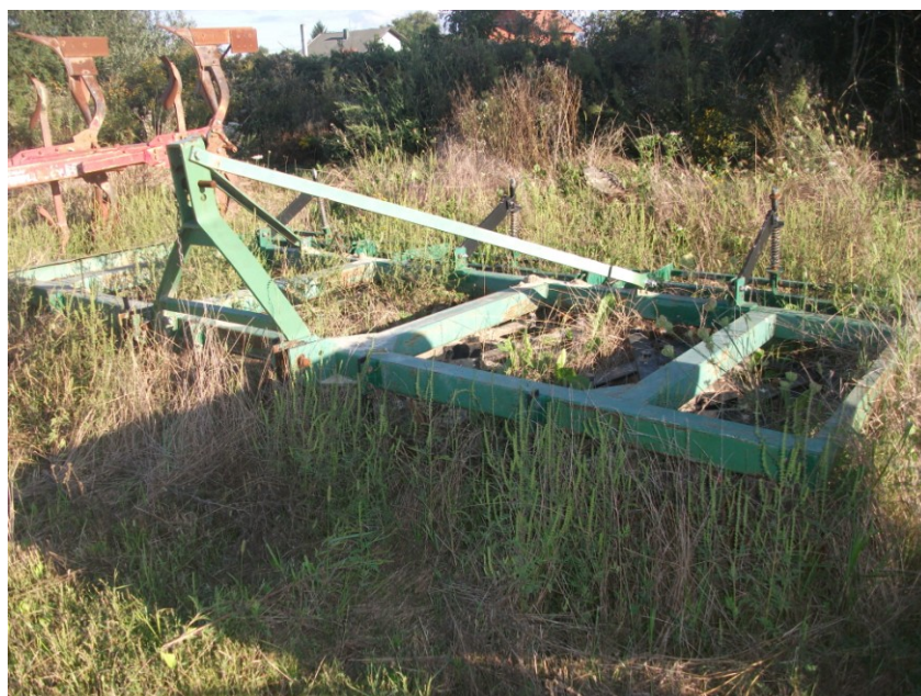
Slika 7. Oruđe za predsjetvenu pripremu tla : teška drljača na istraživanom OPG-u