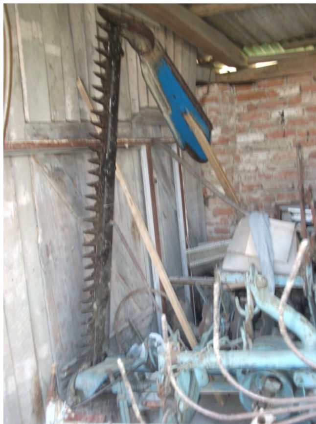
Slika 9. Kosilica za košnju trave na istraživanom OPG-u