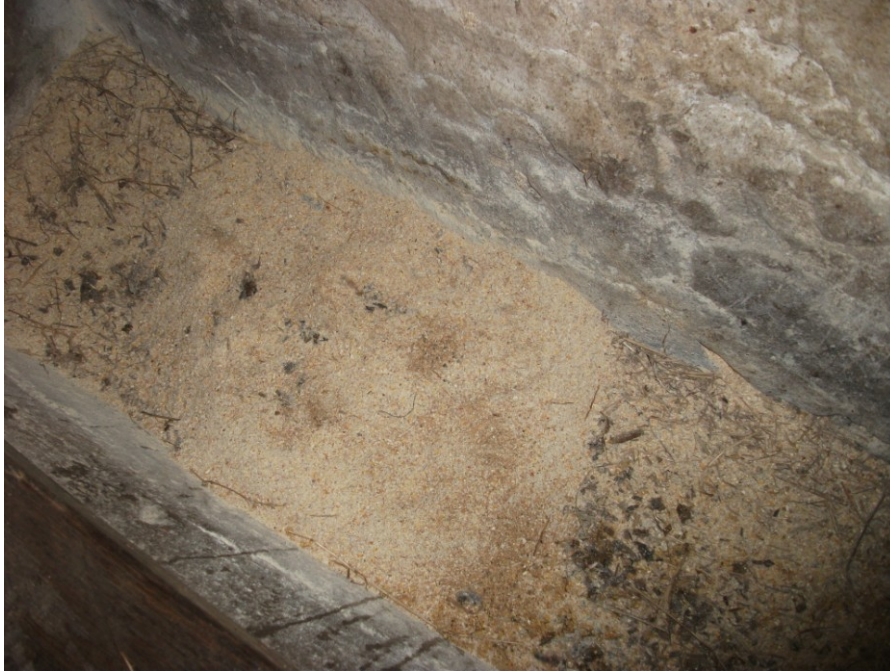
Slika 21. Prikaz ponuđene silaže i samljevenog kukuruza, tritikalea, ječma i koncentrata u valovu