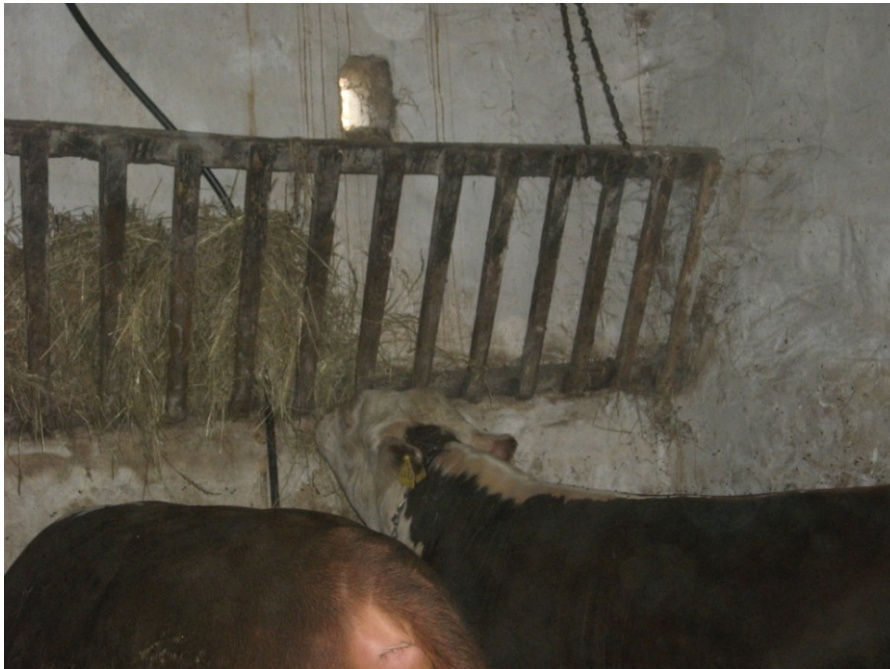
Slika 22. Prikaz hranidbe sjenom u jaslama