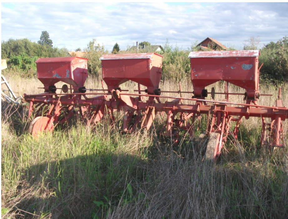
Slika 8. Međuredni kultivator za kukuruz na istraživanom OPG-u