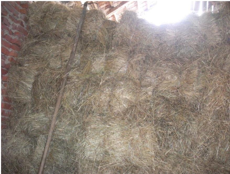
Slika 16. Livadno sijeno na istraživanom OPG-u