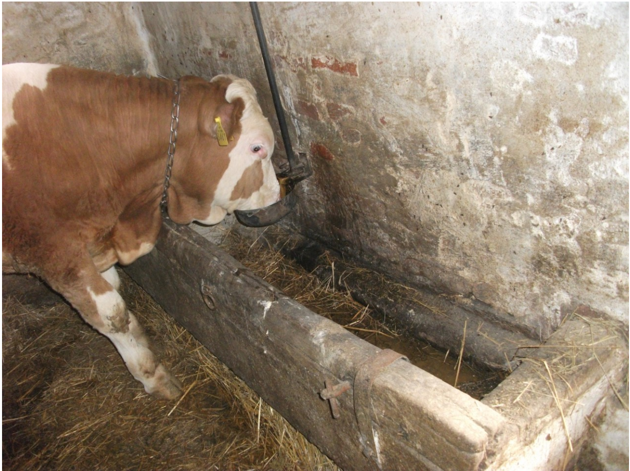
Slika 18. Prikaz pojilica i hranilica za junad na istraživanom OPG-u