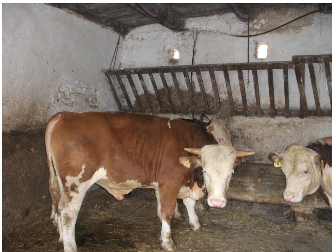
Slika 19. Junad