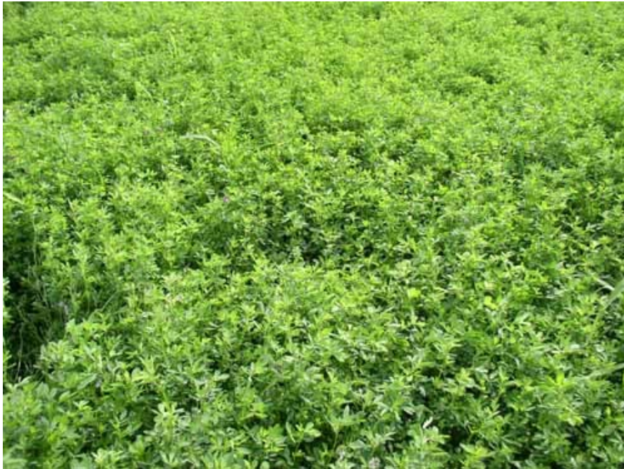
Slika 14. Usjev lucerne na istraživanom OPG-u