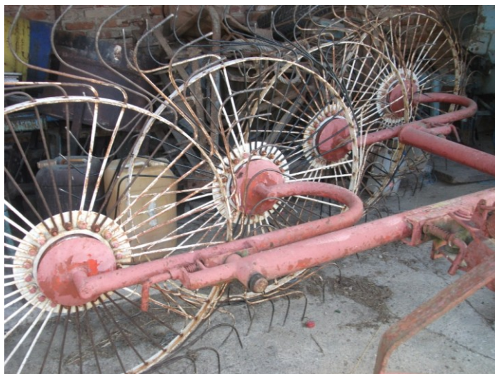
Slika 10. Grablje za travu na istraživanom OPG-u