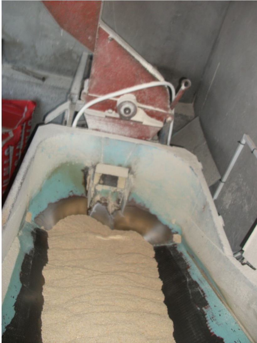
Slika 20. Prikaz mljevenja i miješanja hrane za junad na istraživanom OPG-u

Hranidba goveda na istraživanom OPG-u, glede ukupnog dnevnog sastava obroka, bila je pretežito ujednačena tijekom 2014.g., bez obzira na vegetacijsko razdoblje ljeto/zima. Dnevni obroci su uključivali silažu, pripremljeni obrok sa žitaricama i koncentratima te na kraju obrok sa sijenom kako je prikazano na slikama 20., 21. i 22.