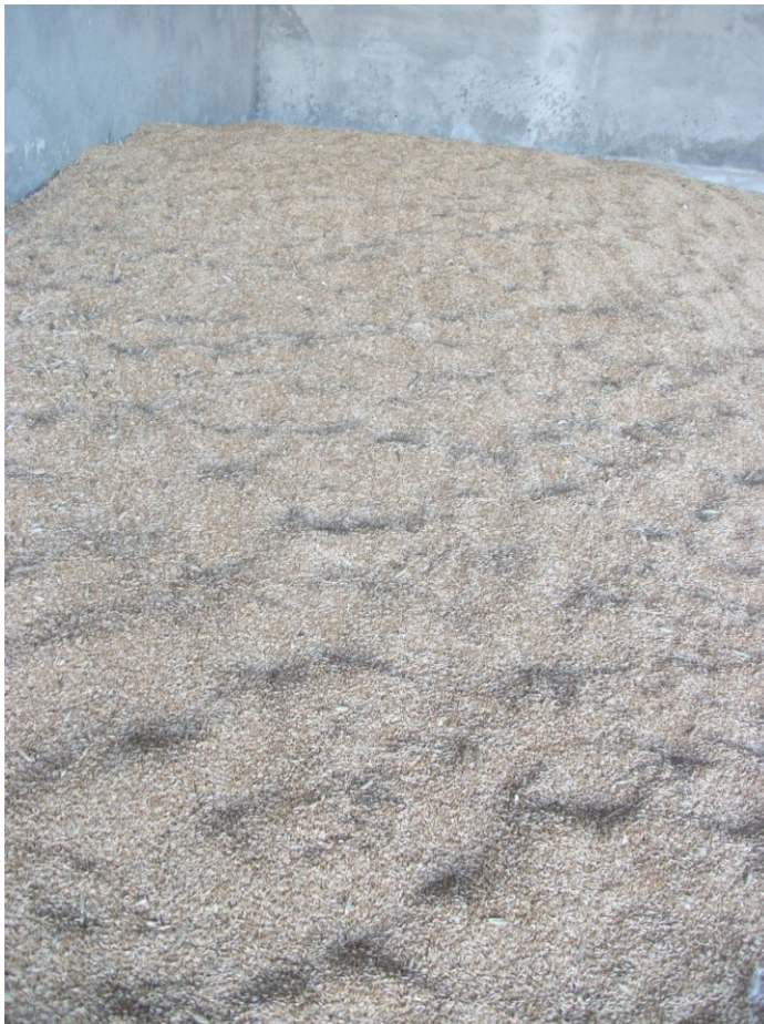
Slika 12. Uskladišteni tritikale na istraživanom OPG-u