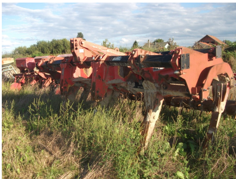
Slika 5. Oruđe za obradu tla : podrivač sa 7 radnih tijela na istraživanom OPG-u