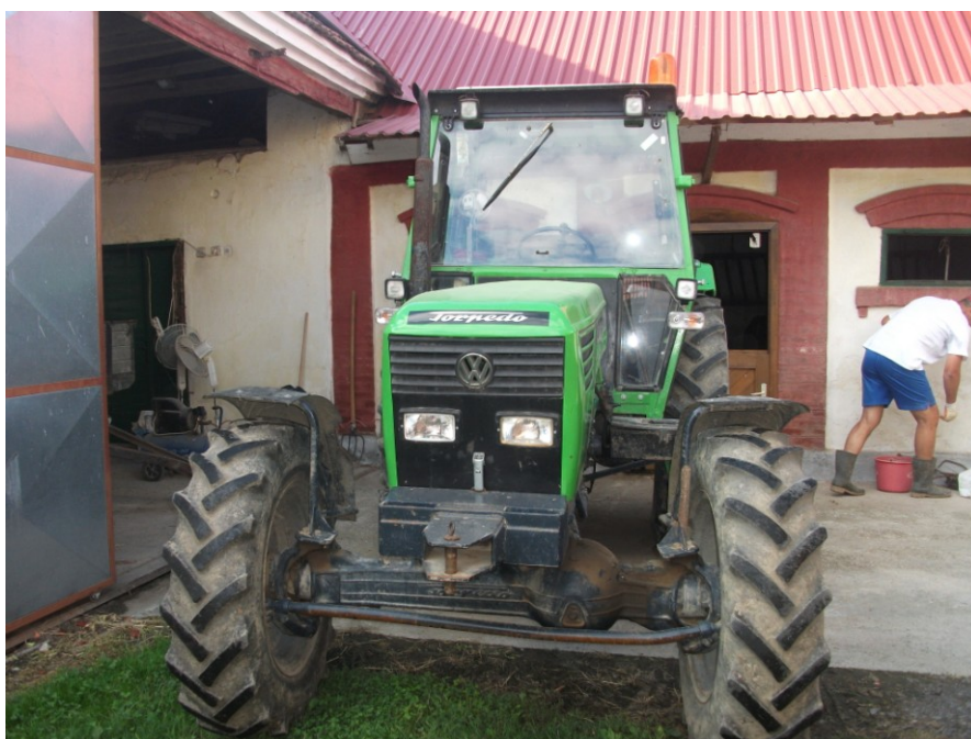
Slika 4. Traktor Torpedo 90° na istraživanom OPG-u