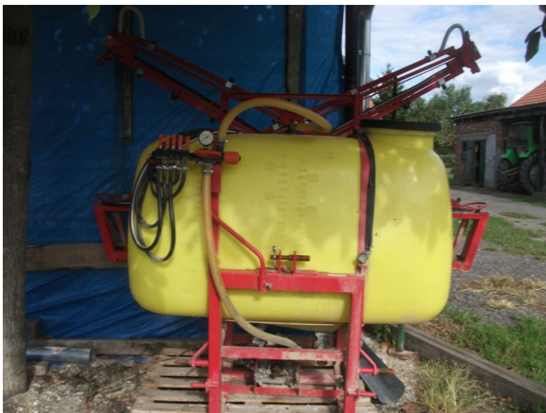
Slika 6. Priključak za zaštitu bilja na istraživanom OPG-u