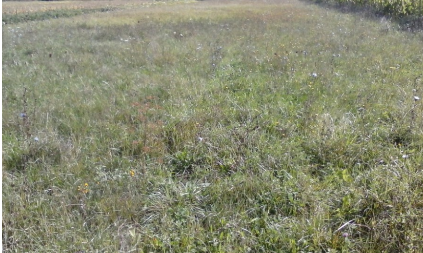
Slika 15. Prirodna livada na istraživanom OPG-u