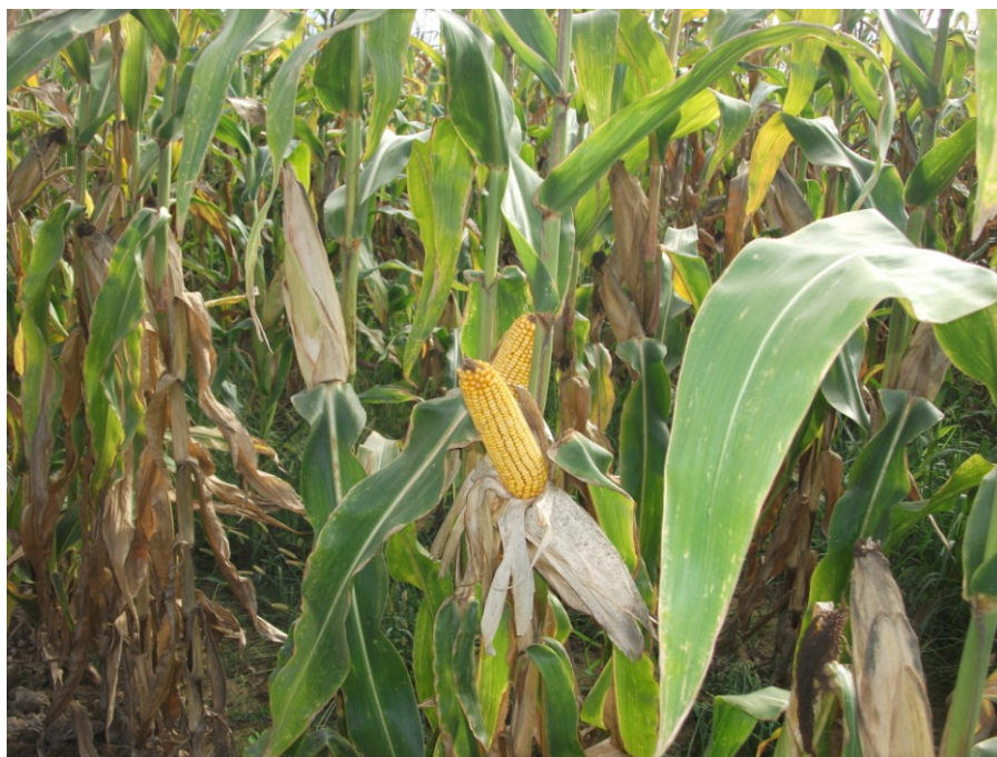
Slika 11. Usjev kukuruza na istraživanom OPG-u