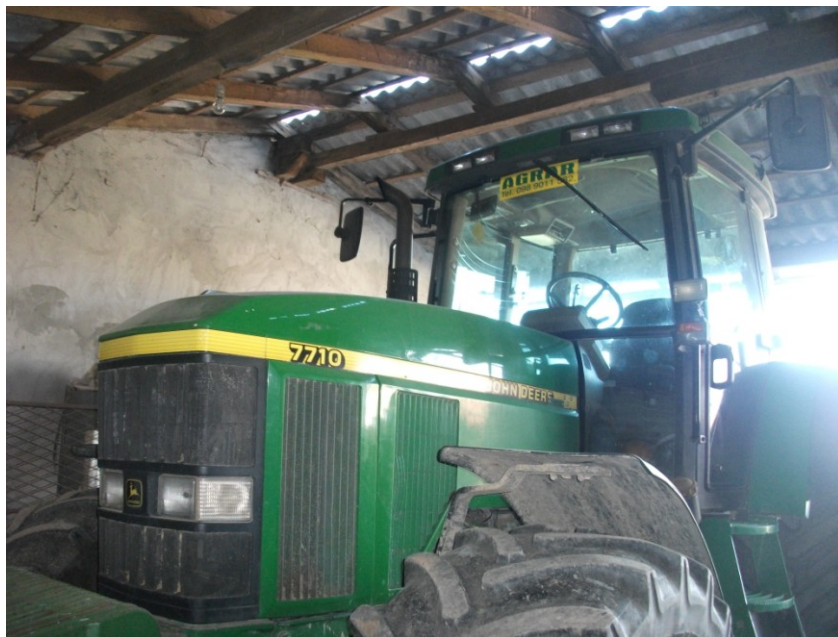
Slika 3. Traktor Johan deer 7710 na istraživanom OPG-u