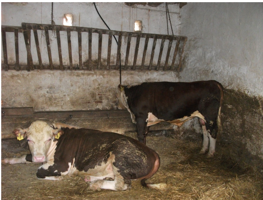
Slika 17. Prikaz držanja junadi na vezu na dubokoj stelji na istraživanom OPG-u

OPG Ljiljana Čunko junad uzgaja na tradicionalan način, životinje su na vezu, na dubokoj stelji, s hranilicama i pojilicama za vodu ispred njih, a pretežno se bazira na uzgoju simentalске pasmine ili njihovih mješanaca, ovisno o ponudi teladi pri kupnji.