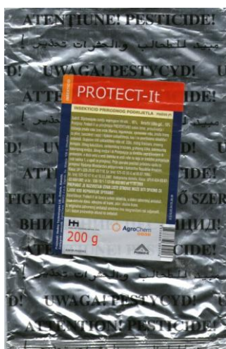
Slika 4. Komercijalno dozvoljen pripravak na osnovi dijatomejske zemlje u Republici Hrvatskoj - Protect-It™

Na tržištu Republike Hrvatske trenutno se nalazi jedan komercijalizirani pripravak na osnovi dijatomejske zemlje, pod nazivom Protect-It™, proizvođača Hedley Technologies Ltd. Ontario, Kanada (Slika 4.). To je insekticid prirodnog podrijetla, iz uputa klasificiran je kao insekticidno i akaricidno prašivo za suzbijanje kukaca i grinja u uskladištenim proizvodima.