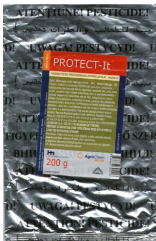
Slika 4. Komercijalno dozvoljen pripravak na osnovi dijatomejske zemlje u Republici Hrvatskoj - Protect-It™

Na tržištu Republike Hrvatske trenutno se nalazi jedan komercijalizirani pripravak na osnovi dijatomejske zemlje, pod nazivom Protect-It™, proizvođača Hedley Technologies Ltd. Ontario, Kanada (Slika 4.). To je insekticid prirodnog podrijetla, iz uputa klasificiran je kao insekticidno i akaricidno prašivo za suzbijanje kukaca i grinja u uskladištenim proizvodima.