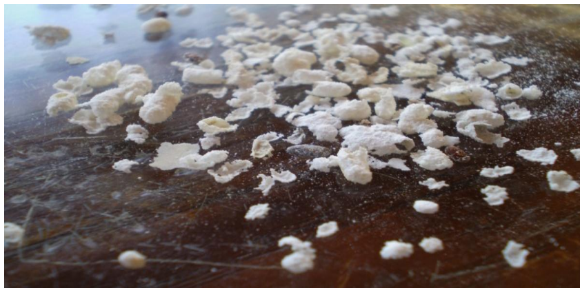
Slika 2. Proizvod oštećen od napada kukaca