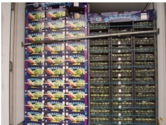
Slika 14. Kontrola konzumne robe

jeziku zemlje podrijetla ili na nekom drugom jeziku razumljivom potrošačima zemlje odredišta. Inspekcijski nadzor i kontrolu usklađenosti voća i povrća s tržišnim standardima pri uvozu iz trećih zemalja na graničnom prijelazu obavljaju fitosanitarni inspektori prije postupka carinjenja. (slika 14.). Uvoznik je obavezan najmanje jedan radni dan prije prispjeća pošiljke voća i povrća nadležnom fitosanitarnom inspektoru najaviti pošiljku. Kada dodje na granični prijelaz dužan je odmah obavijestiti nadležnoga fitosanitarnog inspektora. Fitosanitarni inspektor izdvojiti će uzorak pošiljke i provjeriti da li je voće i povrće koje se uvozi usklađeno s tržišnim standardima (slika 15.). Ako fitosanitarni inspektor utvrdi da voće i povrće zadovoljava tržišne standarde tada će dopustiti njegov uvoz i izdati potvrdu o usklađenosti s tržišnim standardima.