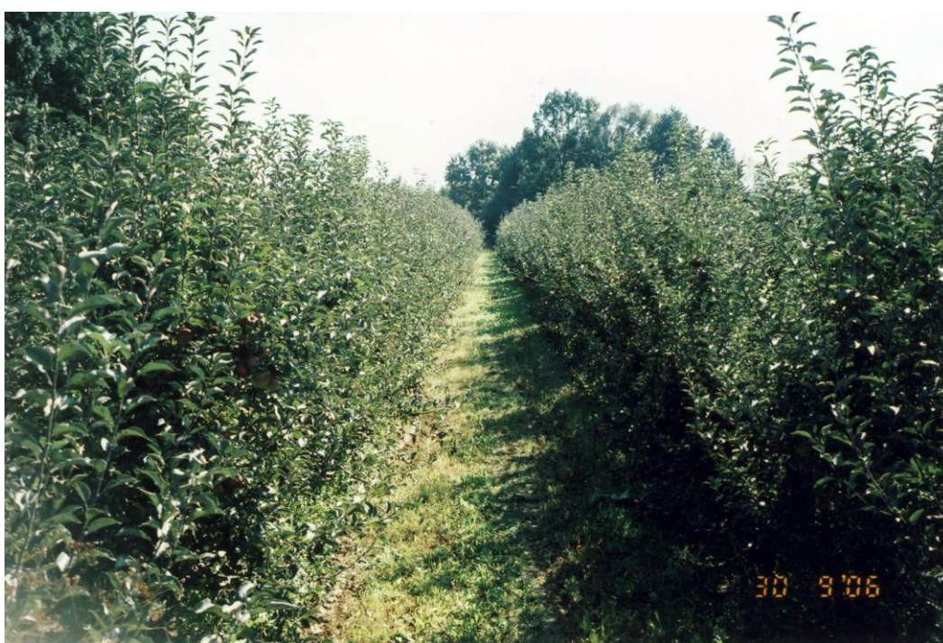
Slika 17. Voćnjak u kojem je provedeno istraživanje

Praćenje pojave bolesti i štetnika jabuke provedeno je od veljače do lipnja 2014. godine, u voćnjaku na OPG „Ergotić“, u Velikoj Kopanici (Slika 17). Voćnjak je podignut 2001. godine na podlozi MM-106. U njemu je posađeno 1.100 sadnica jabuka s razmakom sadnje 3,5 m puta 2,5 m, na površini od 1,1 ha. Uzgojni oblik stabala je vretenasti grm. Stabla su posađena u 30 redova, a svaki red sadrži između 30 i 35 stabala. Od sorata u voćnjaku se nalazi Jonagold, Zlatni delišes, Idared, Gloster i Mutsu, a najzastupljenija je Idared sorta (oko 70%), zatim Zlatni delišes (15%), i ostale sorte čine (15%).