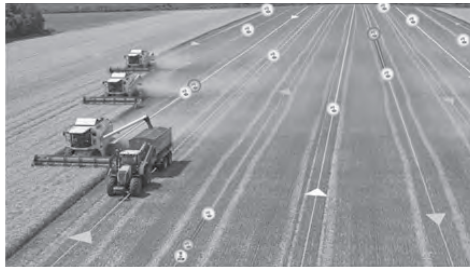
Grafikon 1. Uštede na prijevozu implementacijom novih sustava za planiranje transporta (Banker, 2011.)

Slika 4. Sustav za optimizaciju transportnih ruta kretanja poljoprivrednih agregata „Claas Telematics“ web aplikacija ( http://www.weeklytimesnow.com.au/machine/field-days/claas-telematics-upgrade-ahead-of-time-at-the-mallee-machinery-field-days/story-fnkerd4n-1227010158590 )