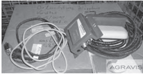
Slika 1. OBU Claas ( http://agri.eu/claas-telematics-prod371704.html )

Komunikacijski modul (Slika 2.) služi kao posrednik između telemetrijske opreme ugrađene u poljoprivredni agregat i komunikacijske mreže. Podaci se u centralni informacijski sustav odašilju i primaju putem GSM mreže kroz podatkovni protokol koji omogućuje razmjenu podataka unutar GSM mreže.