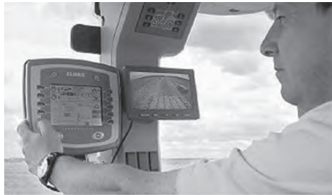
Slika 2. Komunikacijski modul ( http://www.wnif.co.uk/category/precision-farming/isobus-control-panels/ )

GPS navigacijski prijemnik (Slika 3.) očitava poziciju agregata putem sustava globalnog pozicioniranja. Navigacijski prijemnik koji se koristi u telematskim sustavima je zaseban elektronski modul koji se ugrađuje na kabinu poljoprivrednog agregata.